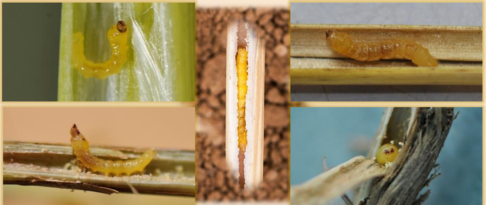
Larvas en tallos seccionados