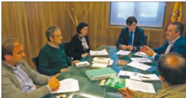
Reunión de ASAJA con el presidente de la Confederación del Duero.