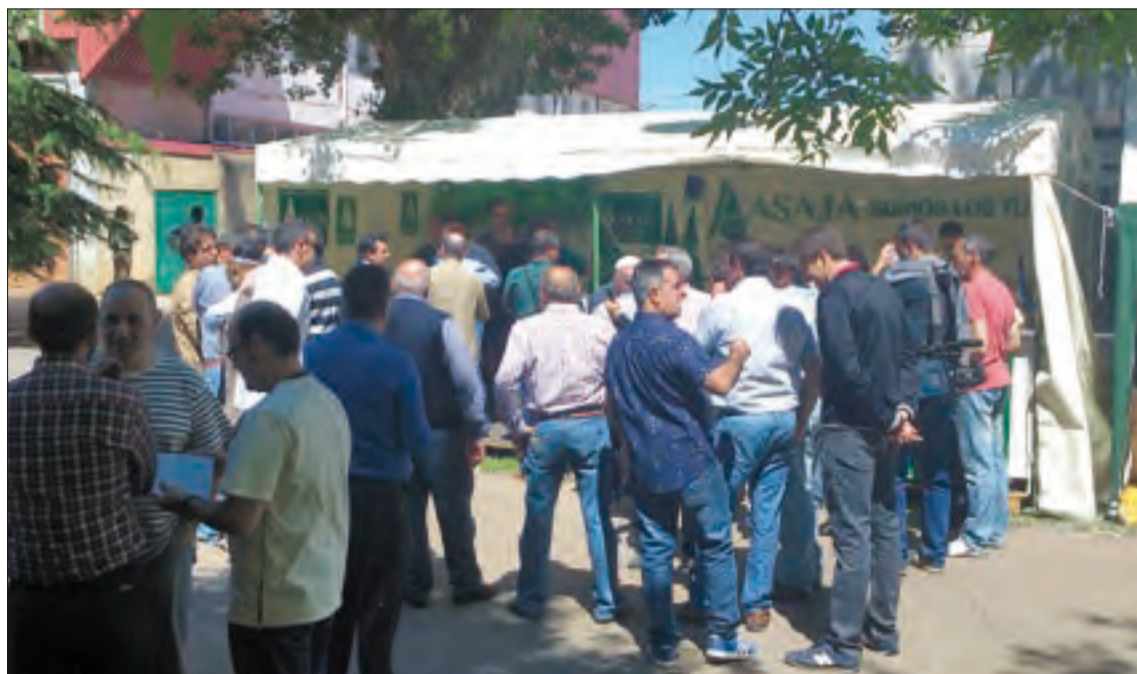
La caseta de ASAJA-Soria en la Feria de Almazán siempre congrega a muchos profesionales de la agroganadería provincial.

Los profesionales del campo de la provincia de Soria y de zonas limítrofes ya tienen una fecha especialmente destacada en su calendario, y es la que marca la Feria de Muestras de Almazán. Este año tendrá lugar los días 15, 16 y 17 de mayo. El certamen cumple su 55 edición y en el recinto del parque de La Arboleda volverá a estar presente la maquinaria agrícola, que acude a la feria cada dos años, una decisión que tomó el sector para abaratar costes a causa de la crisis. Pese a todo, este año se ha detectado que existe un enorme interés por parte de los profesionales por acudir. Conscientes de esa importancia, desde la junta directiva de ASAJA-Soria siempre se organizan, coincidiendo con el evento, actos reivindicativos, a la vez que lúdicos y eminentemente festivos y de encuentro entre las gentes del agro de Soria y de provincias cercanas. Todo ello siempre con el marchamo inconfundible de la OPA, que ha sido y es el trabajo en defensa del agro de Soria, unas enormes ganas de mejorar y el deseo de hacer que los ganaderos y los agricultores sean los que acaparen el protagonismo activo, para contribuir diariamente con un esfuerzo común a lograr una mejor calidad de vida en el sector primario. Este certamen, que se celebra habitualmente en las inmediaciones del río Duero, nació como Feria de Maquinaria Agrícola en los años 60 y ha ido ampliando su abanico de sectores expositi-