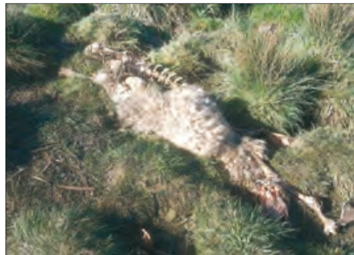
Oveja muerta en el ataque de lobos en Salvadiós.

ASAJA-Ávila reclama a la Junta de Castilla y León agilidad a la hora de abonar los daños por lobo, así como la puesta en marcha de manera urgente de medidas preventivas y de control del lobo. Asimismo, la organización profesional agraria recuerda a los ganaderos la importancia de tramitar la reclamación por responsabilidad patrimonial, que sus servicios técnicos tramitan al sector.