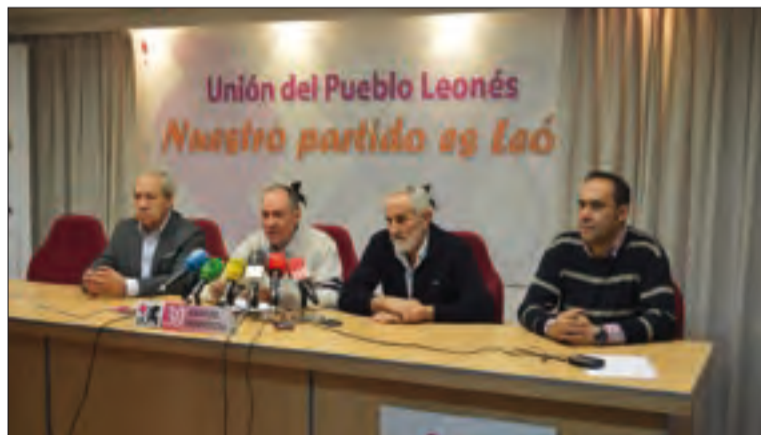
Acto de la UPL, apoyado por los representantes de UGAL-UPA.