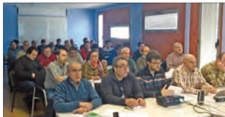
ASAJA trabaja para que el campo se adapte a la nueva normativa fitosanitaria.

Y son ya cerca de 1.150 los profesionales que se han decantado por la organización profesional agraria para formalizar el carné; una confianza que la OPA agradece y, pese al esfuerzo que ello conlleva y sin contar con ningún tipo de apoyo de las administraciones, ASAJA-Soria ha estado y estará dando facilidades a todos