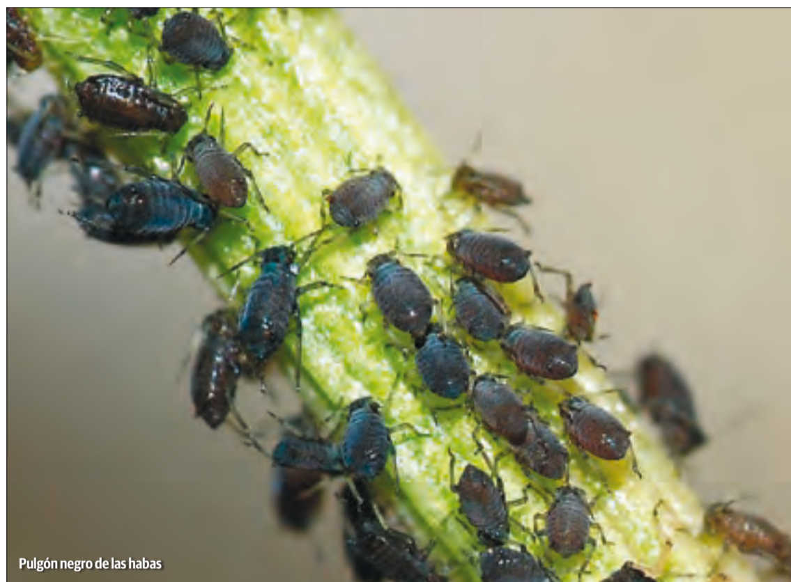
Pulgón negro de las habas