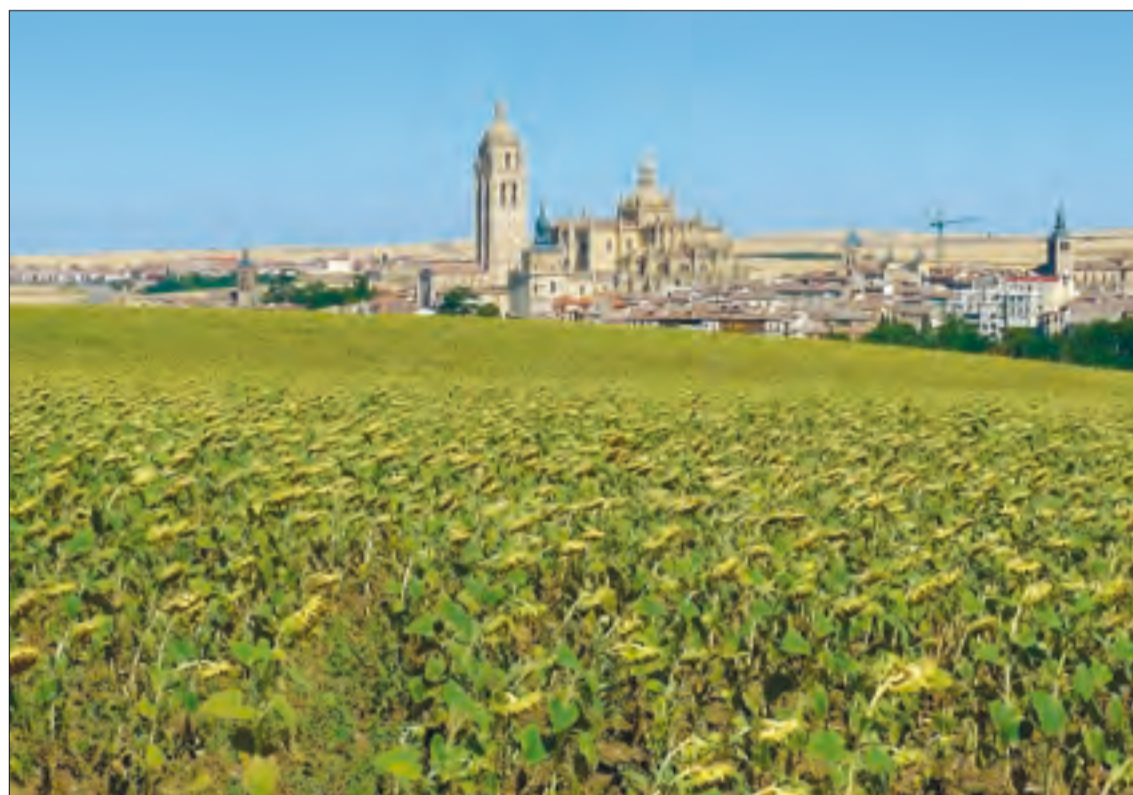
La economía de la provincia depende en gran medida de la evolución del sector agroganadero.

Año tras año estamos comprobando que los resultados del campo son fundamentales para la economía segoviana,