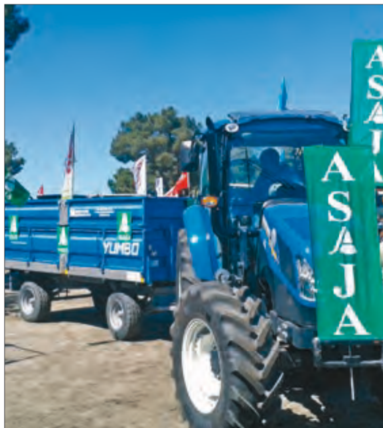
Concurso de habilidad con tractor y remolque marcha atrás, edición 2014.

Las actividades organizadas por ASAJA de Ávila en la Feria de Arévalo se difundirán a través de las redes sociales en Facebook y Twitter, con el hastag en Twitter #ASAJA Feria Arévalo.