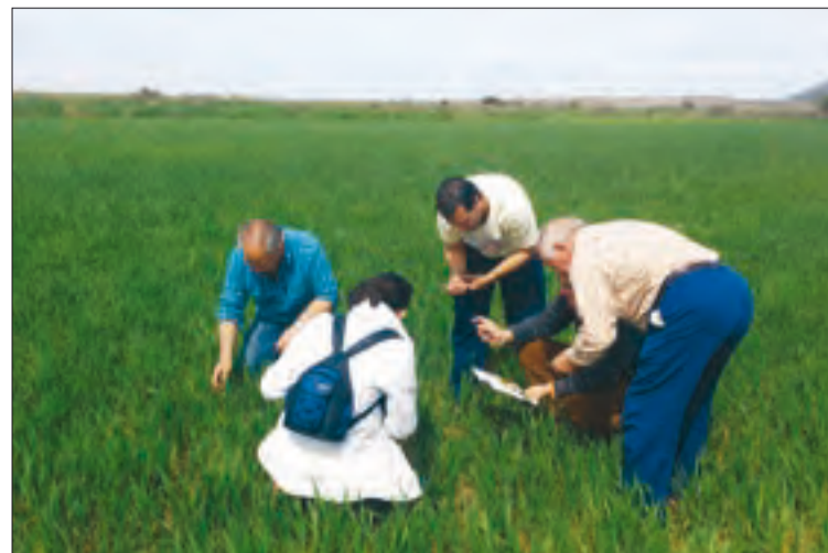
Los técnicos de ASAJA-Soria, analizando el estado de los cultivos en la provincia.