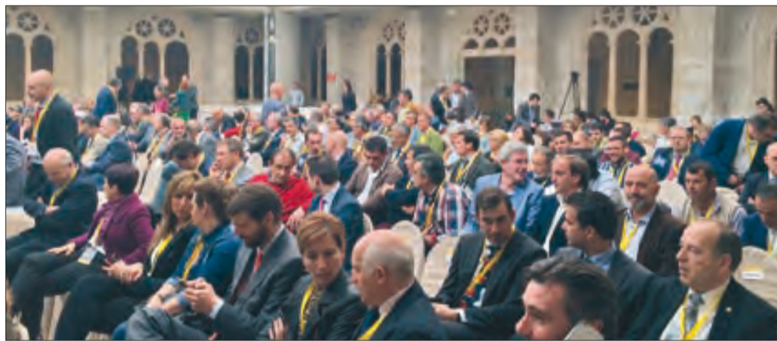
Los foros han reunido a expertos de todas las áreas relacionadas con el sector y a profesionales de la agricultura y la ganadería.