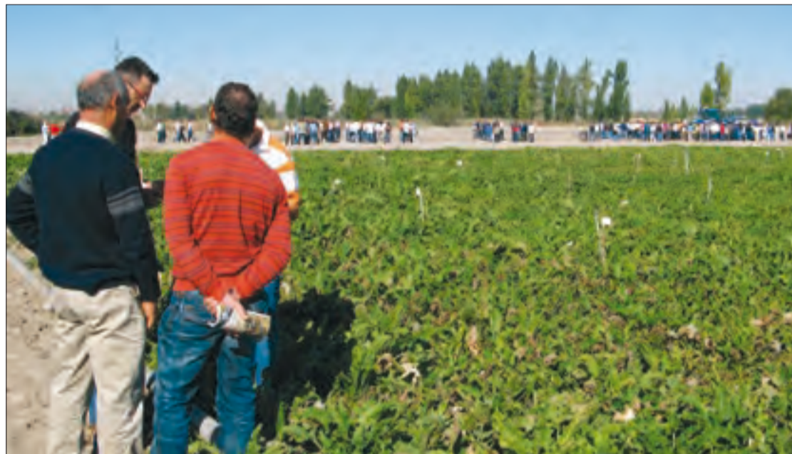
El comité de calidad industrial de la remolacha quiere que se compense el trabajo bien hecho por los cultivadores.

queza, por una parte, y la calidad industrial de la remolacha, por otra. El comité de laboratorios tiene la finalidad de elaborar un protocolo que establezca los criterios y el procedimiento para evaluar y corregir los resultados de los análisis de las muestras de remolacha cuando la polarización o el descuento determinado por impurezas