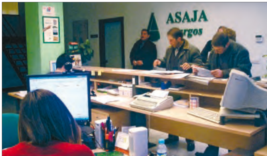
Acércate a tu oficina de ASAJA, donde serás atendido por nuestro equipo técnico.

ASAJA, como interlocutor ante las diferentes administraciones, ha solicitado a Hacienda la reducción en los