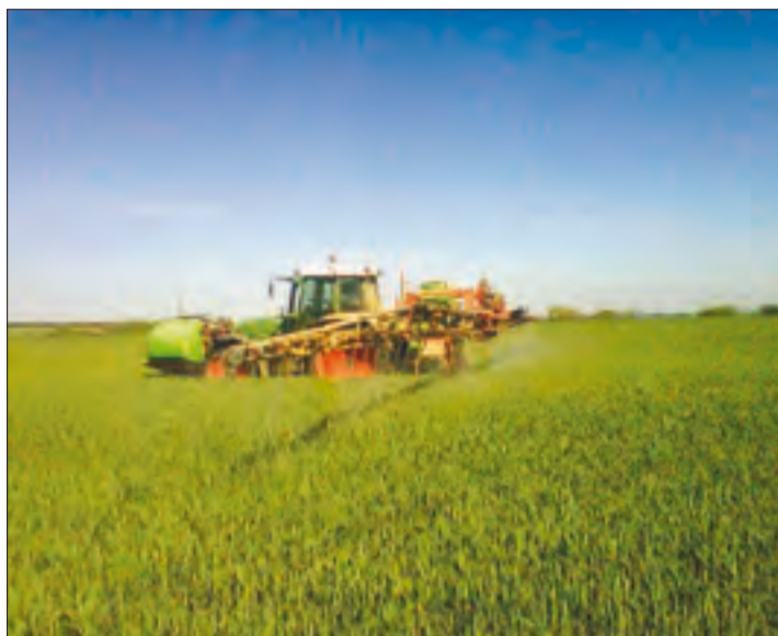
Los tratamientos son complejos y costosos.

Aunque el frío del invierno frena el avance de la roya, existe la posibilidad de haya