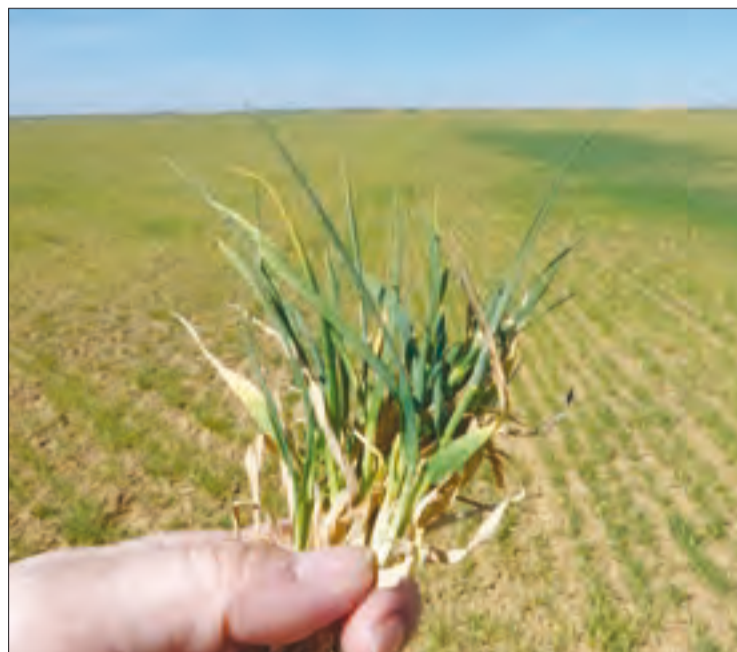
Plagas y enfermedades otra vez pasan factura al campo.

Por último, señalar que en vacuno de leche se mantiene la reducción aplicada en los últimos años, por lo que se pasa del índice 0,32 al 0,26. Y es que la situación en el sector no mejora, menos aún bajo la incertidumbre que ha provocado la desaparición de las cuotas lácteas y el temor a nuevos abusos por parte de la industria.