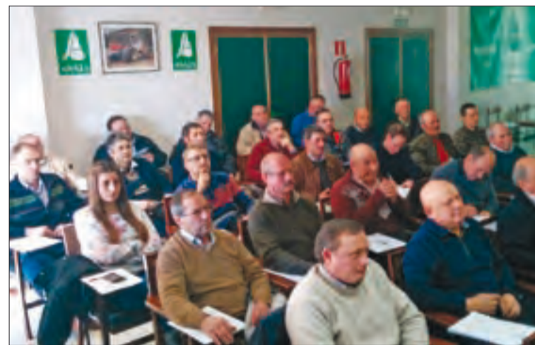
Curso desarrollado en la sede de ASAJA-Salamanca.

El Plan contra las Sustracciones en Instalaciones Agrícolas y Ganaderas implantado por el Gobierno desde finales de 2013 está suponiendo un notable