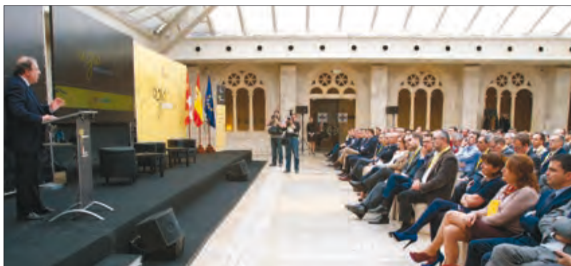
Juan Vicente Herrera, presidente de Castilla y León, en la clausura de AgroHorizonte, el martes 28 de abril en Burgos.

Concluye AgroHorizonte 2020, una estrategia ambiciosa para dar energía al sector primario de Castilla y León