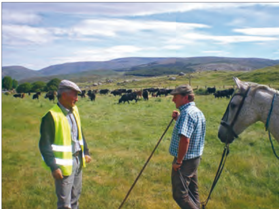
ASAJA pide unas condiciones similares a las de la dehesa para los pastos de zona de montaña.

La organización profesional agraria también critica la tardanza en la publicación de este coeficiente en nuestra provin-