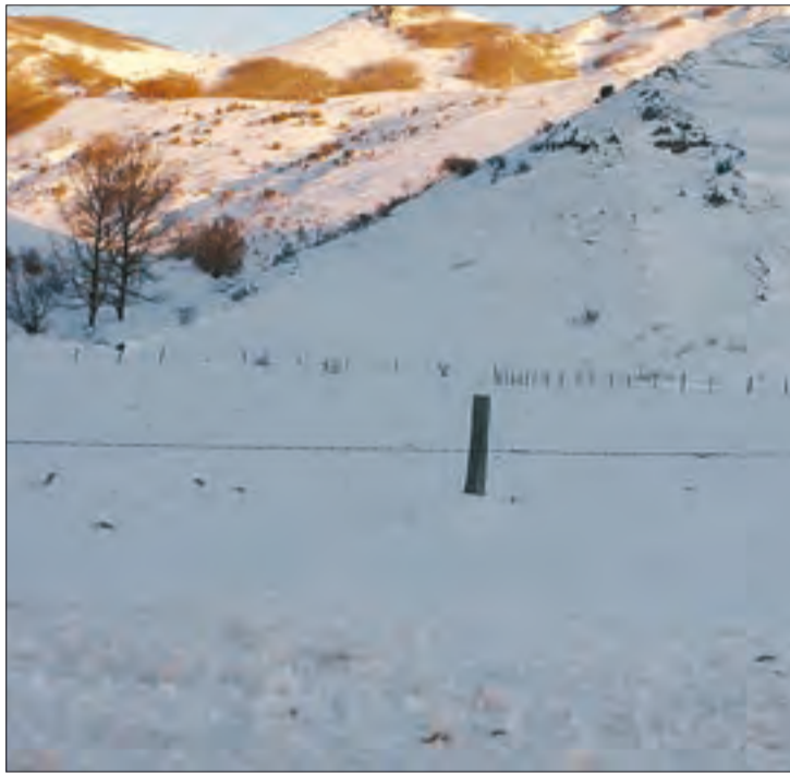
ASAJA no quiere medidas de cara a la galería, sino apoyo real.

Aunque el Real Decreto Ley establece varias medidas de apoyo, en clave ganadera lo realmente importante es la medida contemplada en el artículo