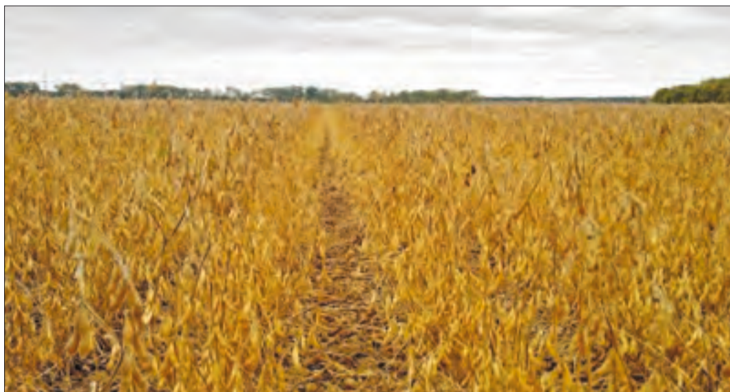
Campo de soja, proteína vegetal muy utilizada para alimentar al ganado.

Organizaciones y cooperativas opinan que el cambio atenta contra el mercado único de la Unión Europea