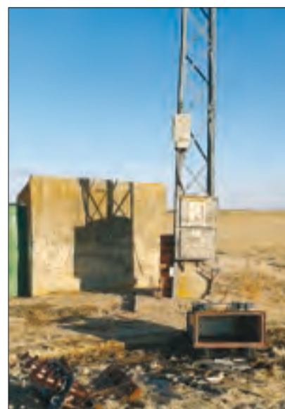
Las casetas son necesarias, no caprichos.

sanciona por alteración en el catastro inmobiliario al haber construido estas casetas. Es injusto, son casetas de unos 7 metros cuadrados construidas por pura necesidad ante la oleada de robos. No son ni un chalet, ni un merendero, ni tienen un salón con televisión. Desgraciadamente son, simplemente y llanamente, una línea de defensa y protección contra los ladrones y vemos injusto y desproporcionado que se nos sancione por proteger la propiedad privada, un bien protegido por