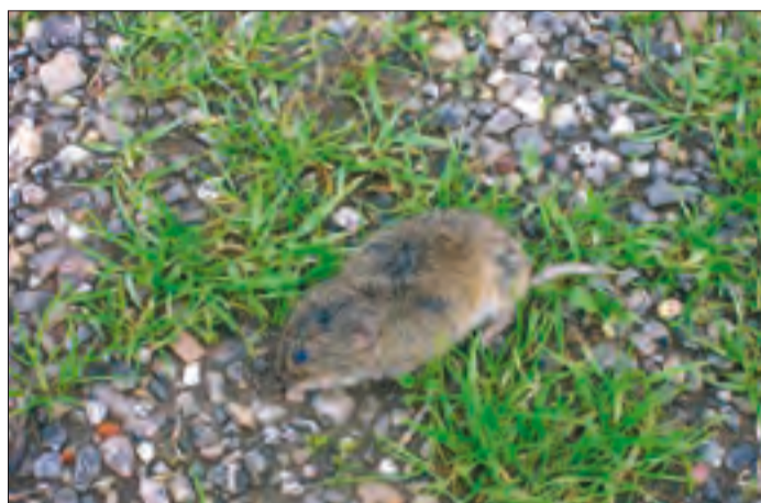
Constatado el grave daño que los topillos hacen a la agricultura.

Aunque desde ASAJA se consideran importantes estas reducciones fiscales, independientemente de que muchos términos se hayan quedado fuera, la organización lamenta que no se aplique un índice cero a la patata después de una campaña como la de 2014 en que la producción se vendió a pérdidas; no obstante el módulo ha pasado de 0,37 a 0,19.