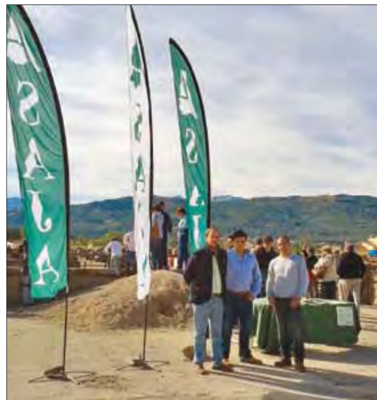
ASAJA estuvo presente, un año más, en la Feria de El Barco.

Revisar el sistema de comercialización de positivos y elevar los baremos de indemnización para que sean acordes con el valor real de mercado y se compense la pérdida de producción son otras de las propuestas de ASAJA para solu-