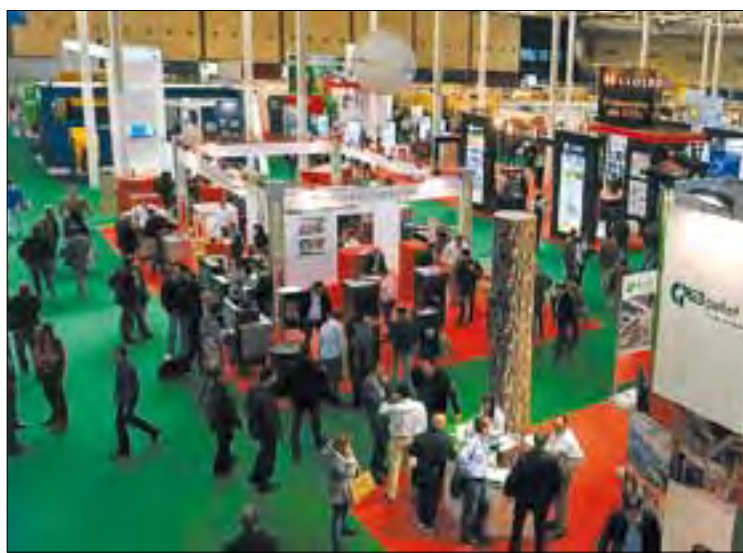
La feria tuvo cerca de 16.000 visitantes profesionales.

Las instituciones implicadas en el proyecto investigan un innovador sistema para el trata-