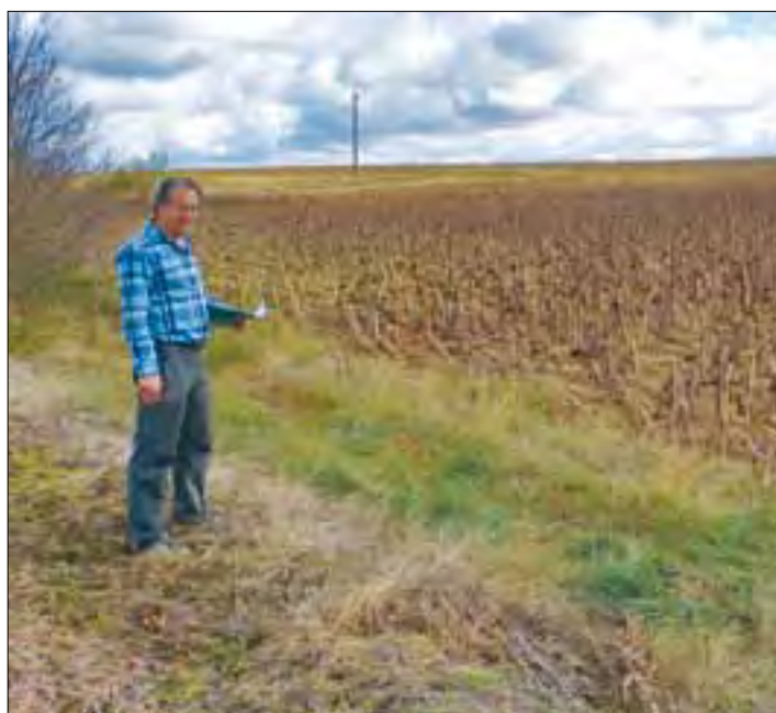
El equipo de ASAJA realiza un completo seguimiento de las parcelas dañadas.

Asaja recuerda la importancia de que el sistema de