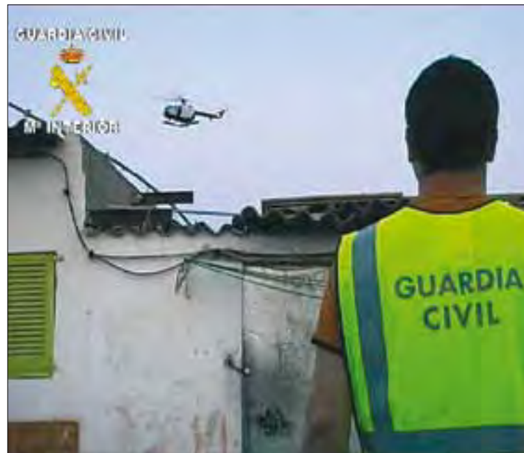
La inseguridad preocupa en muchos municipios.

Entre los consejos de seguridad que se pueden recomendar destacamos poner en conocimiento de la Guardia Civil (062) cualquier información relativa a: personas desconocidas y sospechosas que transitan por las explotaciones, matrículas y detalles de