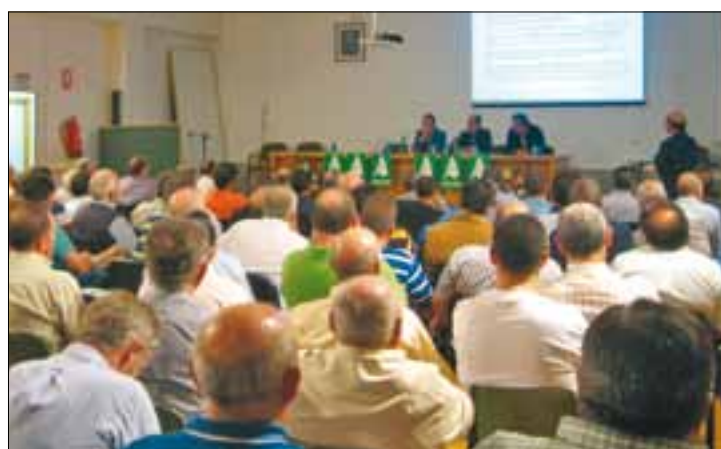
La asamblea provincial se celebró en el salón de actos de la Escuela de Formación Agraria de Segovia.