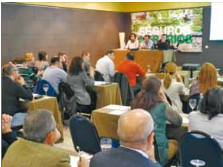
La jornada se celebró en Valladolid.