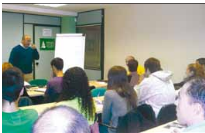
Los alumnos reciben una completa formación sobre la empresa agraria.

Desde ASAJA-Burgos lamentamos que, por segundo año consecutivo, la Junta de Castilla y León haya relegado a la "segunda división" la formación de los profesionales de la agricultura y la ganadería, destinando cero euros a la financiación de estos cursos, frente a los casi cuatro millones de euros que la Consejería de Economía concederá para este capítulo a los firmantes del conocido como "Diálogo Social" -Cecale, CC OO y UGT-.