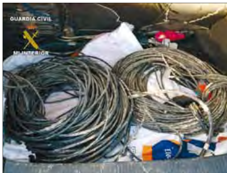
Tan importante como detener es que los delincuentes no queden impunes.