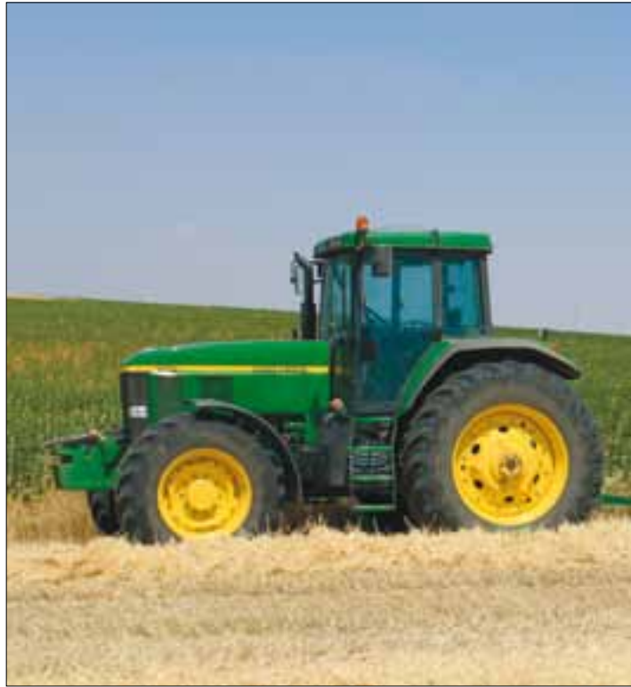
El cambio de normativa, causa de estos problemas.

El siguiente problema es cuando el tractor no lleva una cabina o estructura de la misma casa y no supera la ITV.