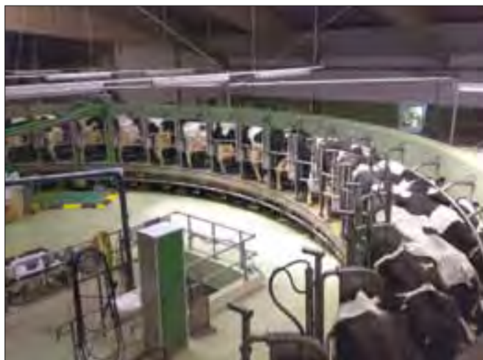
Los ganaderos se merecen un precio justo por su trabajo.

En nuestro país no se llega todavía a las cotizaciones de Alemania, aunque también se confirma esta tendencia positiva. Según el informe de entregas del FEGA, en Castilla y León en septiembre se pagó una media de 0,361