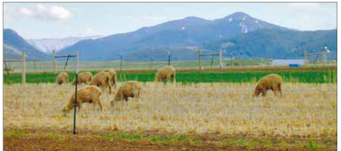
Es preciso realizar un esfuerzo entre todas las partes para devolver la fuerza del sector a los pueblos y al sector.

Ahora, desaparecida la Cámara provincial, todas esas funciones deberán ser respaldadas por la administración, pues se están gestionando una función social de la propiedad que aunque sea privada, las está regulando la administración pública (pastos, caza, etc.), y bien podrían asumirlas las Secciones agrarias comarcales