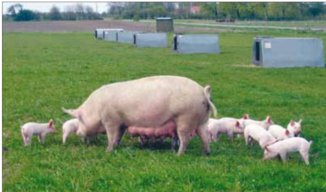
El proyecto en el que participa ASAJA es un innovador sistema para tratar residuos de purín porcino.

A continuación, Servimed llevará a cabo la formulación de diferentes fertilizantes de base mixta a partir de los residuos orgánico y mineral obtenidos previamente, a los que se añadirá un inhibidor de la nitrificación para la liberación controlada del nitrógeno. En sus instalaciones ubicadas en Almazán, se pondrá a punto