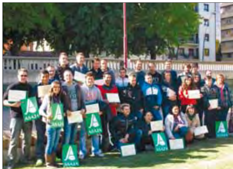
El grupo de alumnos que ha superado el curso de incorporación a la empresa agraria.

En estos 35 días de clases se han impartido materias de gestión de explotaciones, legislación de interés agroganadero, nociones sobre la política agrícola común, agronomía y zootecnia, así como nociones básicas de utilización de las he-