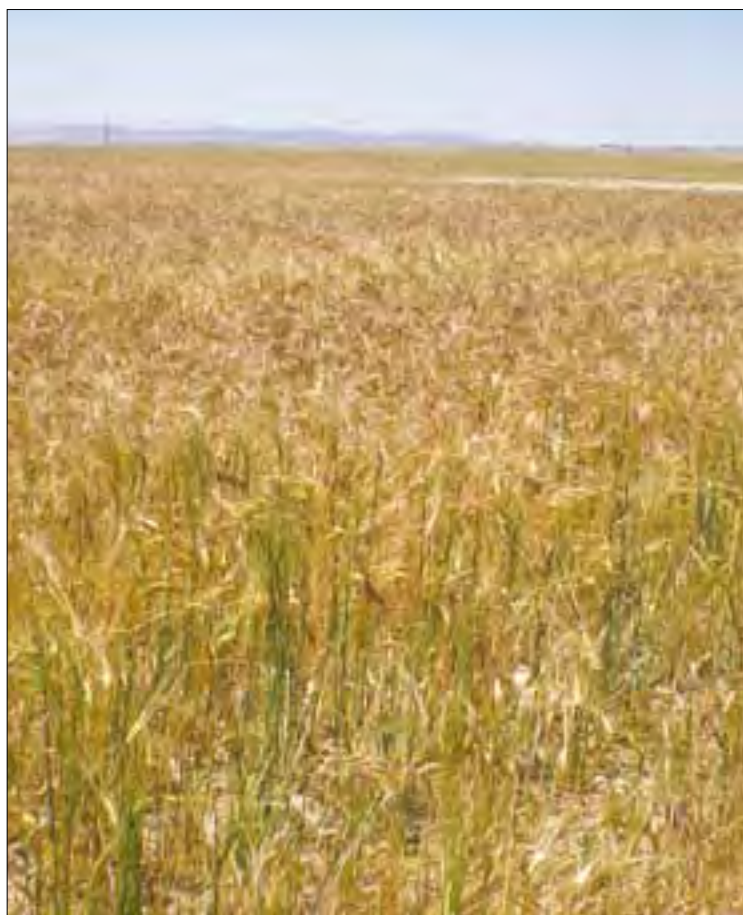
Plaga de bromus en Collado de Conteras.

En caso de que la Junta, también en Ávila, decida autorizar bajo petición individual a instancia del agricultor la quema controlada ente los agentes