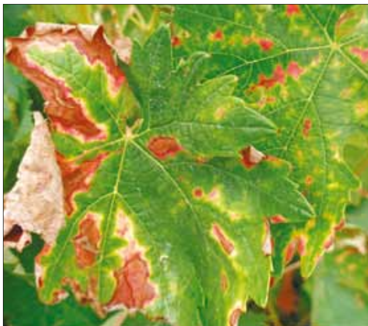
Este año la enfermedad ha alcanzado una virulencia extraordinaria.

Se trata de una campaña que finaliza con un gran temor por parte de viticultores, pues la "yesca" ha afectado con mucha virulencia a los viñedos, sobre todo de la Denominación de Origen Toro. Y se prevé que, de no poner algún remedio, en la campaña próxima la situación será mucho peor.