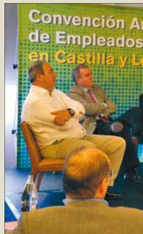
Los secretarios generales de La Rioja, Sevilla, Huesca y León.