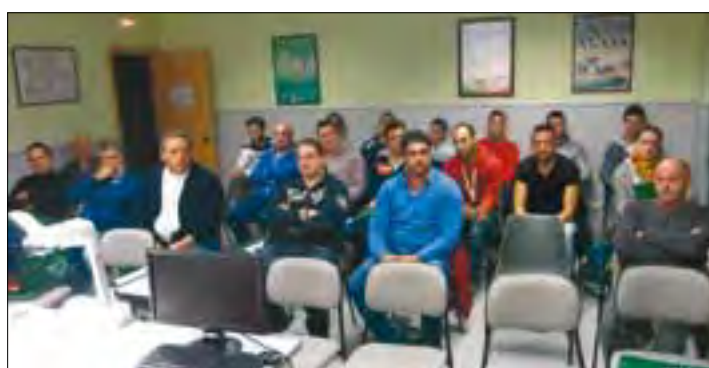
Ganaderos que participan en el curso sobre bienestar animal que organiza ASAJA.

Por otro lado, en las oficinas de ASAJA-León comenzó a impartirse el viernes día 25 de octubre un curso sobre "Bienestar animal" en el que participan 23 ganaderos de