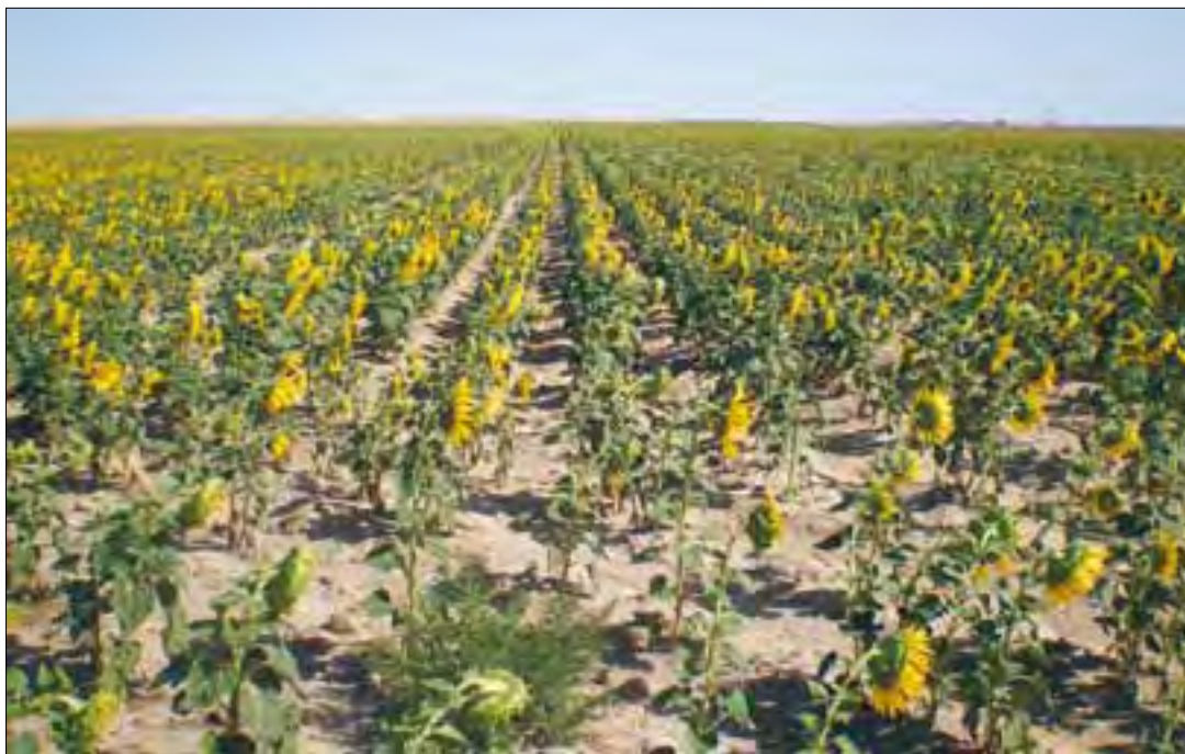
Cultivo del girasol en los campos de la Moraña.