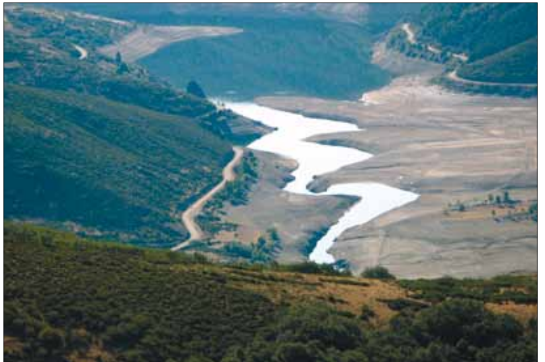
ASAJA critica que se aumenten impuestos que restan competitividad al sector.

ASAJA de Castilla y León se opone a que los regantes que utilizan aguas superficiales procedentes de los embalses de la cuenca del Duero tengan que asumir este nuevo coste. Además, pide a todas las comunidades de regantes de la cuenca del Duero que, una vez que se publiquen en los boletines oficiales las tarifas de riego y el canon de regulación para el año 2014 con la Resolución de José Valín como presidente de la Confederación Hidrográfica del Duero, lo recurran por la vía contencioso administrativa y que se nieguen rotundamente a ser recaudadores para un Estado que no se ve saciado en el co-