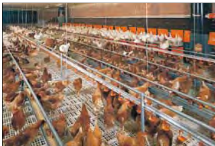
Cumplir la normativa UE ha exigido importantes inversiones.

“Nos sentimos desprotegidos puesto que las exigencias regulatorias para las empresas productoras de huevos en Europa son muy superiores a los requerimientos que se pi-