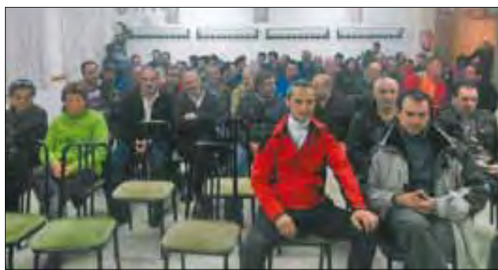
Agricultores y ganaderos de Carrizo de la Ribera en la reunión informativa.

diferentes localidades y sectores productivos. El curso se exige por las autoridades agrarias a quien gestiona