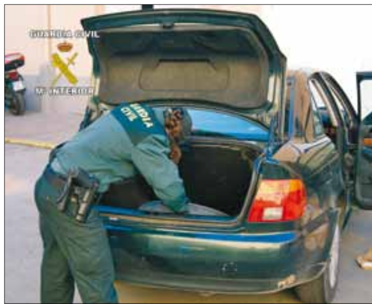
El trabajo de las fuerzas del orden es vital.

Lejos de perderse en el detalle anecdótico respecto a lo que supone la desagradable experiencia de cada afectado que ha sufrido alguno de estos atropellos en los últimos tiempos, (solo en el último mes, y según datos obtenidos en dicha reunión se calculan la cantidad de 120 robos por un importe de 1.068.000 euros). Todos los asistentes a la reunión por unanimidad acordaron la creación de una comisión gestora