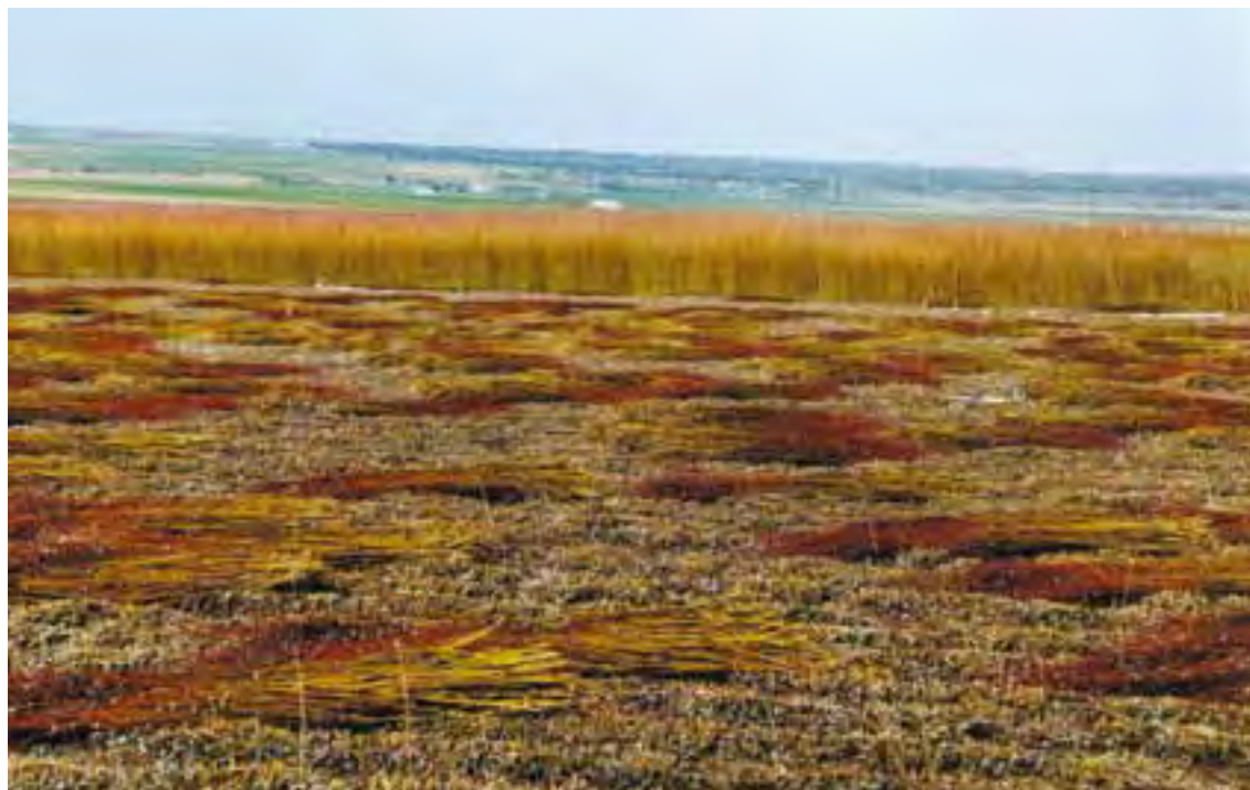
Arriba, haces de mimbre recién cortada. Abajo (izda), proceso de corta. Abajo (dcha) un detalle de una cepa.