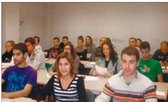
Grupo de alumnos del curso de ASAJA-Burgos.