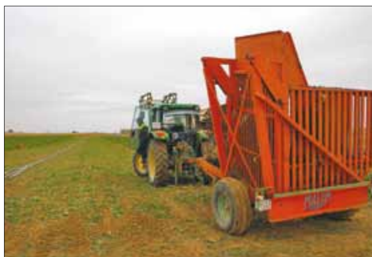
La remolacha está, en general, muy sana.

Como de costumbre fue Acor la primera que inició en la Comunidad Autónoma la campaña de recepción de remolacha, el pasado 22 de octubre; la cooperativa tiene por objetivo finalizar la molturación antes de que finalice 2013, para efectuar obras de mejora en su planta. Por su parte, Azucarera Iberia, dado el enorme retraso del cultivo por las lluvias de primavera y la campaña tan corta que se espera, espació en lo posible sus aperturas. Primero, el día 5 de noviembre, fue la molturadora de Miranda de Ebro (Burgos) la que inició la recepción de lunes a domingo. Dos días después abría la fábrica de Toro, mientras que la apertura de La Bañeza, estaba prevista para el 20 de noviembre, salvo que las condi-