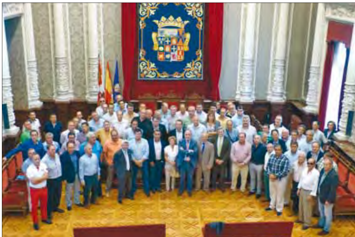
Foto de familia de los responsables de JAL durante el acto celebrado en la diputación.

Representantes de 38 Juntas Agropecuarias Locales (JAL) que recibirán subvención de la Diputación firmaron el convenio y conocieron el destino de esas ayudas para la mejora de sus instalaciones y la compra de maquinaria. La inversión supone 90.000 euros y con ella se llevarán a cabo 38 actuaciones en otras tantas JAL de la provincia. El presidente de la Cámara Agraria, Honorato Meneses, manifestó su satisfacción por el convenio con la Diputación, dado que se podrán realizar mejoras básicas en muchos municipios.