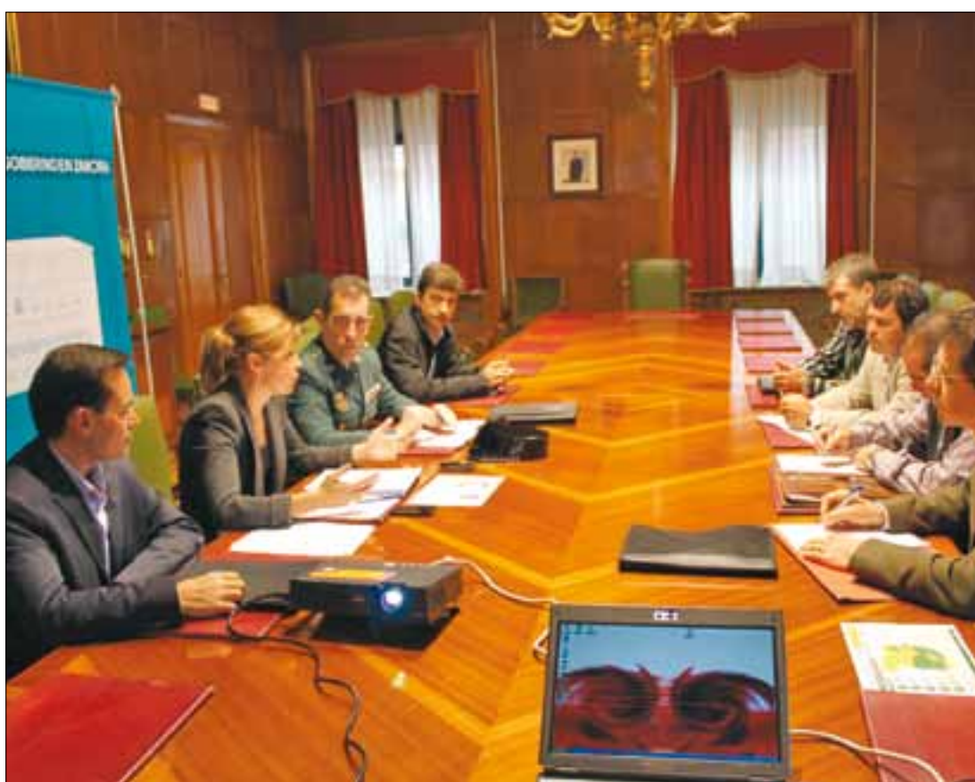
A la izquierda, los responsables de la subdelegación y de la Guardia Civil; a la derecha, los líderes de las OPAS.