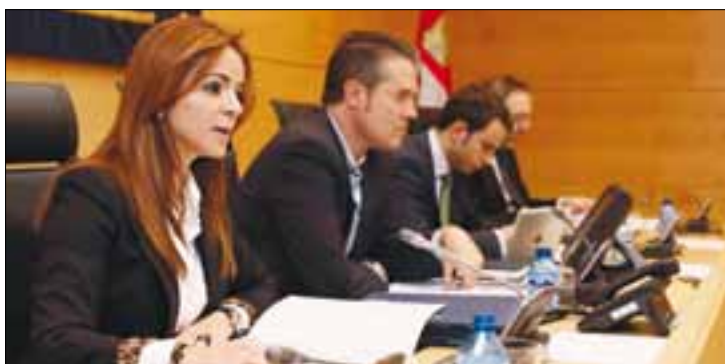
La consejera de Agricultura, en su comparecencia en las Cortes.