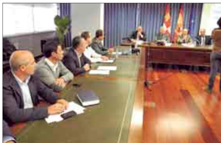
Responsables de ASAJA, durante la reunión en la Delegación del Gobierno.

d) Se introduce un nuevo artículo que castiga el robo de conducciones, cableado, equipos o componentes de infraestructuras de suministro eléctrico o de servicios de telecomunicaciones.