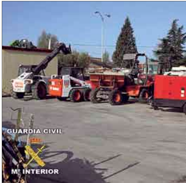
Hay que extremar la vigilancia para poner coto a estos delitos.

Debemos insistir en que se denuncien todos los robos que se produzcan, aunque se-