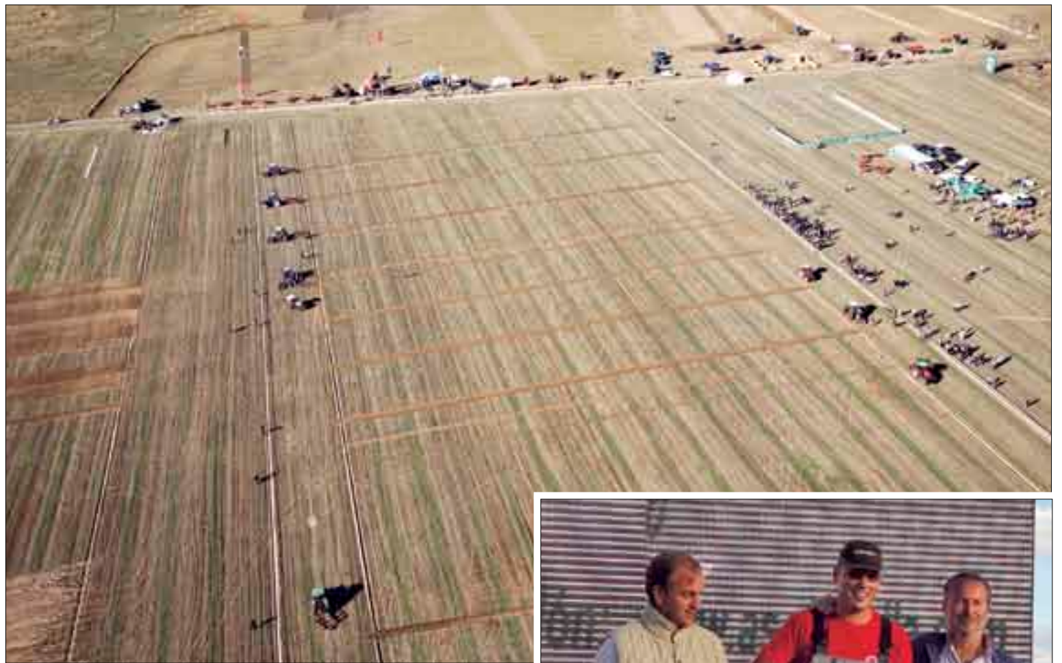
Vista aérea del surco de apertura.

Asimismo, Gas Natural Fenosa desarrolló varios talleres de manualidades y se desarrolló una gymkana infantil. También tuvo lugar una exhibición de arada de tractores antiguos, yunta de bueyes y pareja de mulas, de la mano de la Asociación Española de Amigos de la Maquinaria Agrícola y de la Fundación Villalar, respectivamente.