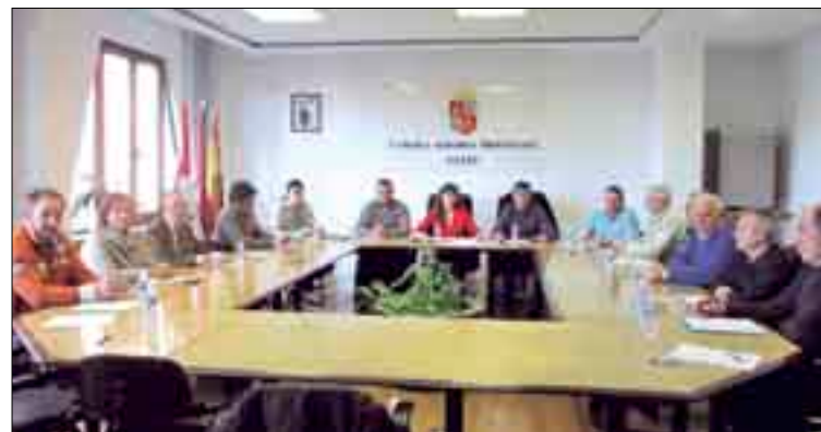
Reunión de la Lonja Agropecuaria de León.

sea una segunda sede de la Lonja, donde se reunirá en miércoles alternos en las instalaciones de la Unidad de Desarrollo Agrario dependiente del Servicio Territorial de Agricultura. En resumen, la Lonja de Agropecuaria de León pasará a celebrar sesión todos los miércoles del año, alternando entre su sede de León capital y la de Santa María del Páramo, y cotizará cereal y maíz todas las semanas, mientras que el resto de cultivos y producciones ganaderas tendrán cotización quincenal y en algunos casos limitado a la cam-