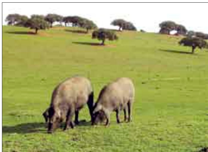
El porcino ibérico, sector clave en Salamanca.

A efectos prácticos, los ganaderos tendrán que planificar su montanera en base a la norma antigua, puesto que, aunque el Ministerio agilice al máximo todos los trámites,