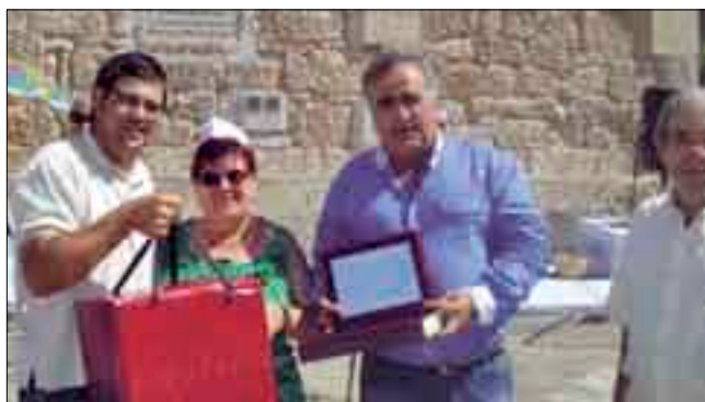
Entrega de premios del concurso.