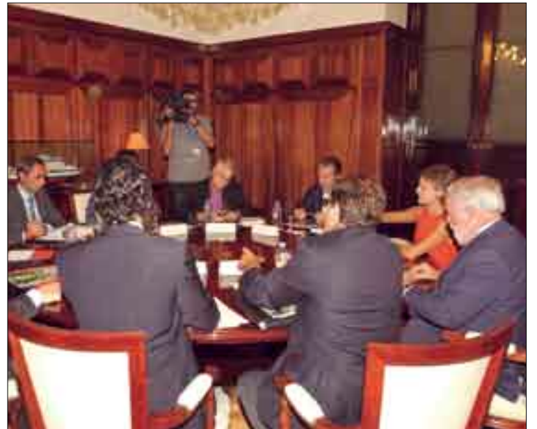
Reunión celebrada en el Ministerio, con presencia de industria y Opas.

dente de ASAJA de Castilla y León ha reclamado a la administración apoyos para el sector, así como que Azucarera "pague lo mismo al agricultor español que al inglés, porque puede y debe hacerlo".