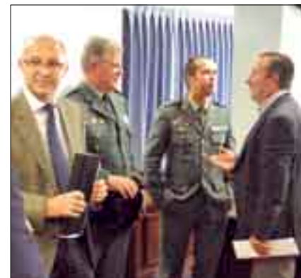
Dujó y responsables del Gobierno y Guardia civil.

Pasos importantes para tratar de controlar el gravísimo problema de los robos en explotaciones agrícolas y ganaderas. En septiembre el Gobierno aprobó la modificación del Código Penal para endurecer las penas por este tipo de delitos y castigar especialmente la reincidencia. Un punto reclamado repetidamente desde ASAJA, "porque no basta con detener a estos delincuentes, hasta