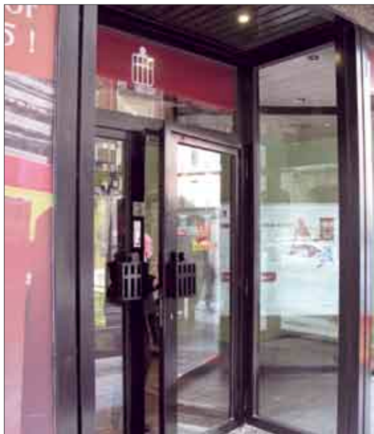
ASAJA apuesta por un buen servicio en el medio rural.

En cualquier caso, el camino para conseguirlo, para fidelizar a los clientes de cada pueblo, a los agricultores y ganaderos, pasa por dar una atención ade-