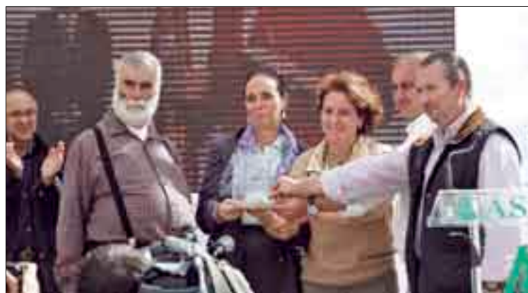
Entrega de la V Insignia de Oro a los hermanos de Loyola de Palacio.