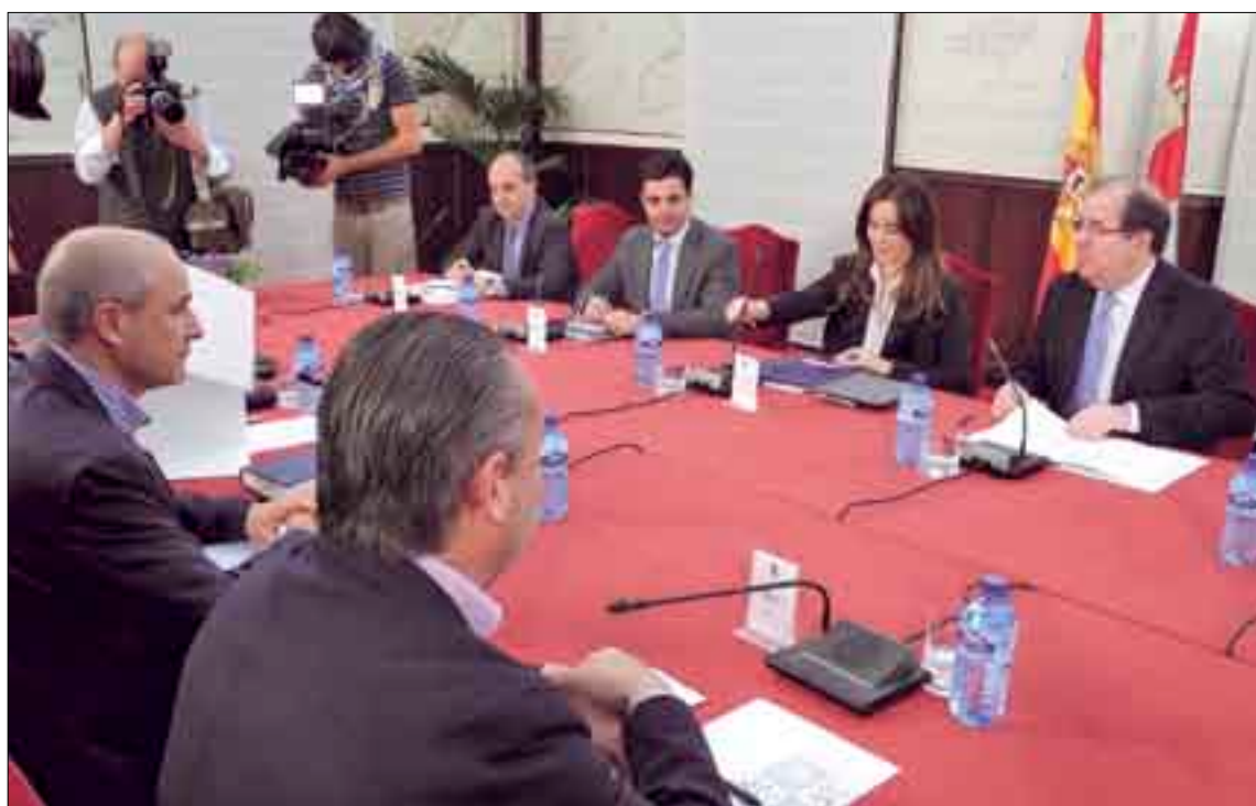
La futura Ley Agraria de Castilla y León es uno de los compromisos de Juan Vicente Herrera.

ASAJA confía en que esta dimensión sea tenida en cuenta e incorporada al espíritu y desarrollo de esta nueva norma en el trámite parlamentario, "cuajando entre todos una Ley generosa que de un marco de posibilidades y desarrollo no sólo para la agricultura y la ganadería, sino para el medio rural en su conjunto".