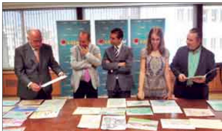
Los miembros del Jurado, durante sus deliberaciones.

Con el concurso de pintura "Así es mi pueblo", que este año cumplía su decimoquinto aniversario, se pretende que los niños del medio rural de Castilla y