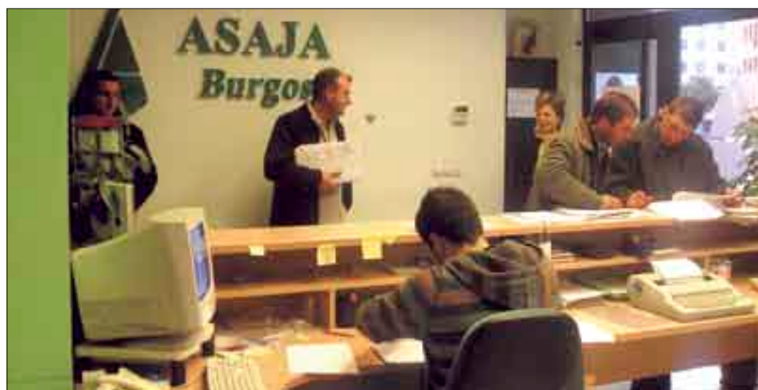
En las oficinas de ASAJA ofrecen apoyo y asesoramiento profesional a agricultores y ganaderos.

encuestas, de las que 575 serán a agricultores y ganaderos de la provincia de Ávila; 731 de Burgos; 747 de León; 516 de Palencia; 1.095 de Salamanca; 596 de Segovia; 422 de Soria; 754 de Valladolid, y 678 de Zamora.