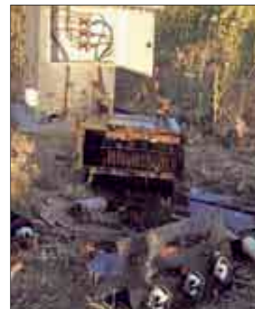
Los destrozos son muy importantes.

Para ASAJA-Valladolid es fundamental, dada la incidencia de estos robos en la comarca, la instalación en Valladolid de una base permanente del grupo de elite de la Guardia Civil GRS o en su defecto una Unidad de Seguridad Ciudadana de