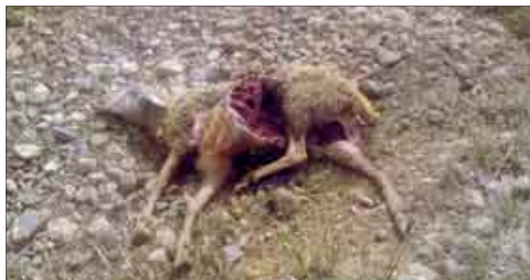
Los daños no son compensados en su valor real.

Recogiendo las denuncias de éste y otros ganaderos afectados por los ataques del lobo, ASAJA recuerda que la Junta sólo compensa con 20 euros (que corresponden a la franquicia y el lucro cesante) la muerte de un animal -en este caso, ovino-, frente a la valoración que hace Agrosseguro, que sitúa en aproximadamente 140 euros,