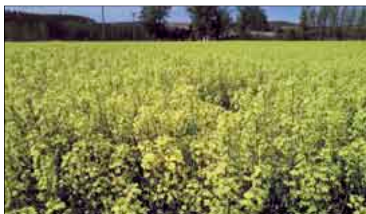
Campos de colza en la región.

Recordemos que, por acuerdo de las instituciones europeas del año 2006, se impuso