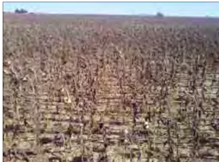
Los resultados de la cosecha están arrojando rendimientos más bajos.

Las empresas y la propia Administración tendrían que hacer una profunda reflexión para saber si de verdad quieren que el cultivo de girasol en secano, en provincias como Segovia, se desarrolle adecuadamente. Un producto en el que España es profundamente deficitaria, cada año deben importar miles de toneladas para satisfacer la demanda tanto de la producción de piensos compuestos como de aceite.