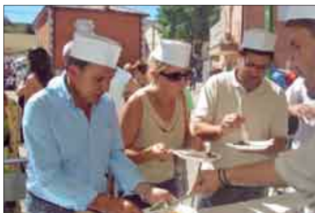
Torrepadre se ha convertido en una cita imprescindible.