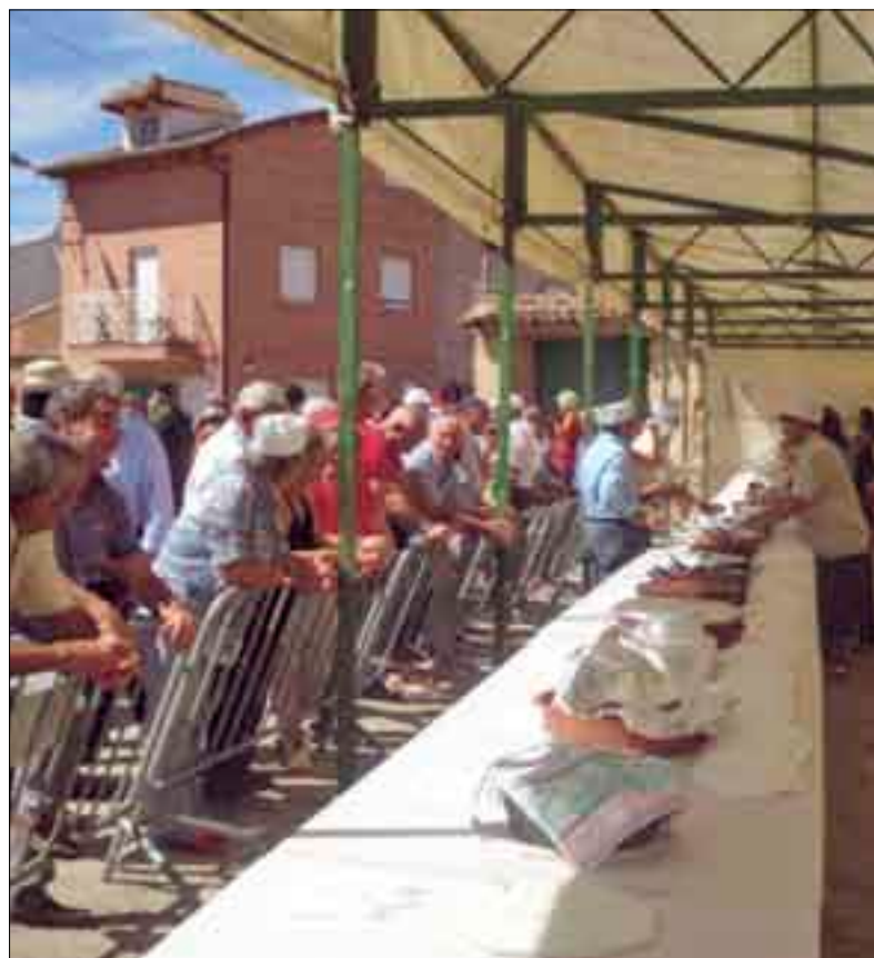
El público siguió con gran interés los concursos.