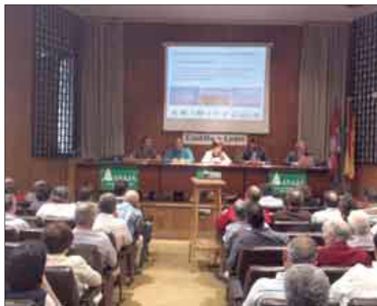
La charla sirvió para que los ganaderos de Soria despejasen algunas de sus dudas.