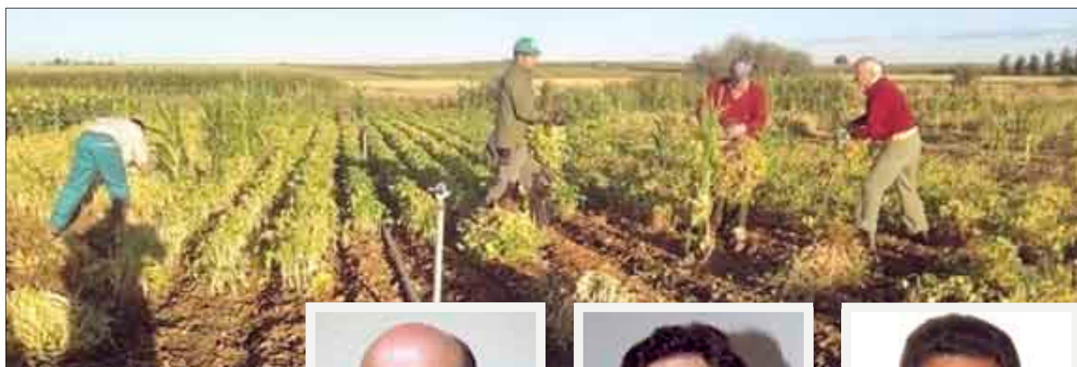
Recogiendo alubia a mano en León.

En total, según las estadísticas oficiales, esta campaña se han sembrado en Castilla y León 2.270 hectáreas de judías secas; 5.843 de lentejas, y 6.836