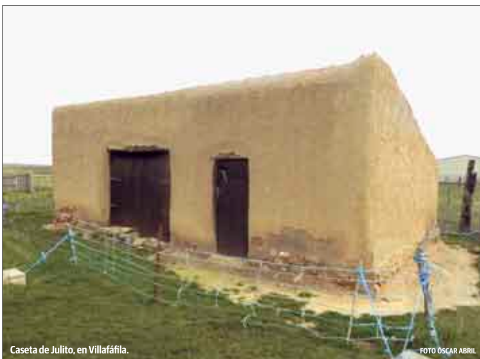
Caseta de Julito, en Villafáfila.