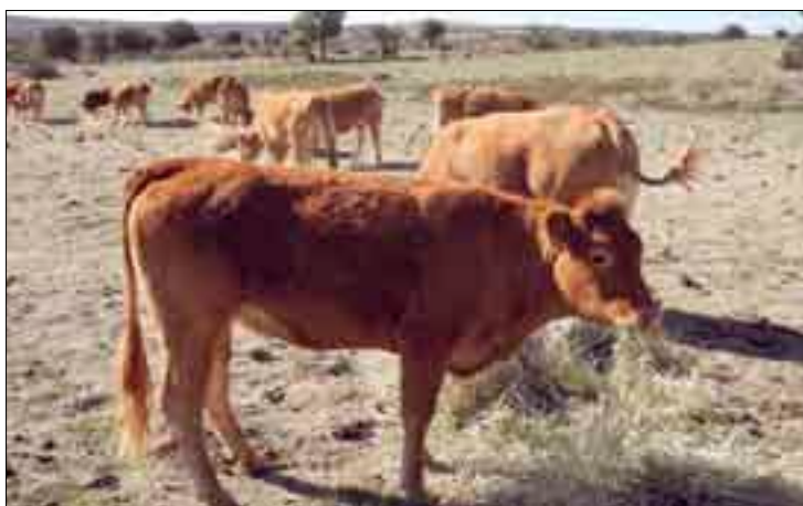
El sistema de reparto de ayudas a no profesionales crea competencia desleal.

Sin embargo, lo más notable es que la reducción de titulares que reciben la prima a la vaca nodriza es pareja a la reducción real del número real de granjas. Algo que puede parecer una evidencia, pero que no lo es, puesto que en los pagos únicos de la PAC ocurre lo contrario. "Mientras que el ga-