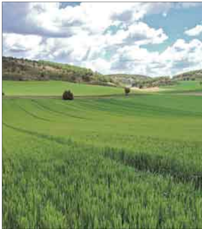
La reclamación de ASAJA es que el dinero priorice a los profesionales.

La provincia de León representó el 12,7% de todos los fondos de la PAC que llegaron a Castilla y León y el 2% sobre el conjunto nacional. En número de beneficiarios, León representó el 16,8% del conjunto de Castilla y León y el 1,86% del conjunto nacional.