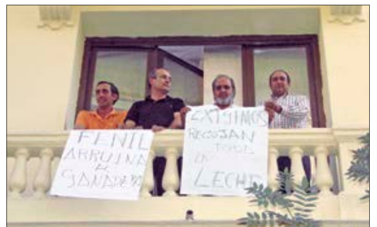
Los ganaderos y sindicalistas, el día del encierro en la sede de FENIL.

y responsabilidad civil de 80,87 euros por la falta de daños. ASAJA ha venido defendiendo que las diferencias entre el sector ganadero y la representación de los empresarios lácteos debían de enmarcarse en el ámbito de la relaciones interprofesionales. La patronal de las industrias, por el contrario, ha optado a lo largo de todo este periodo por judicializar la causa con el fin de estigmatizar y dar un “escarmiento ejemplarizante” a unos representantes del sector ganadero que no hicieron otra cosa que defender de forma civilizada sus propios intereses y los de sus representados.