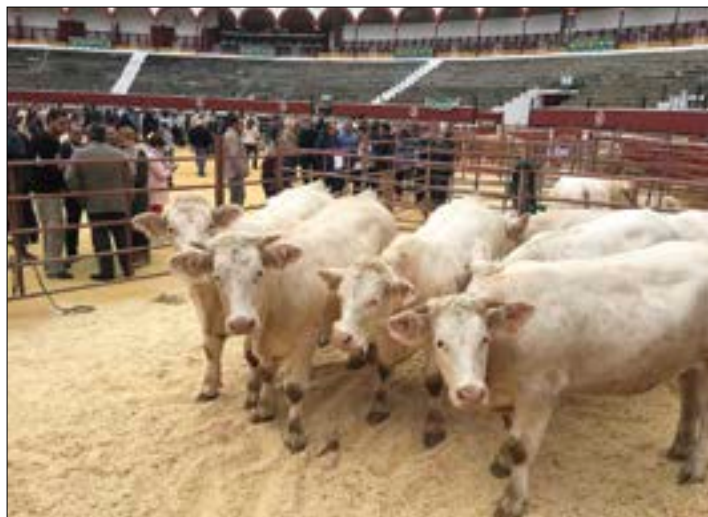
La calidad de las razas expuestas atrajo a un gran número de público a la VIII Feria.