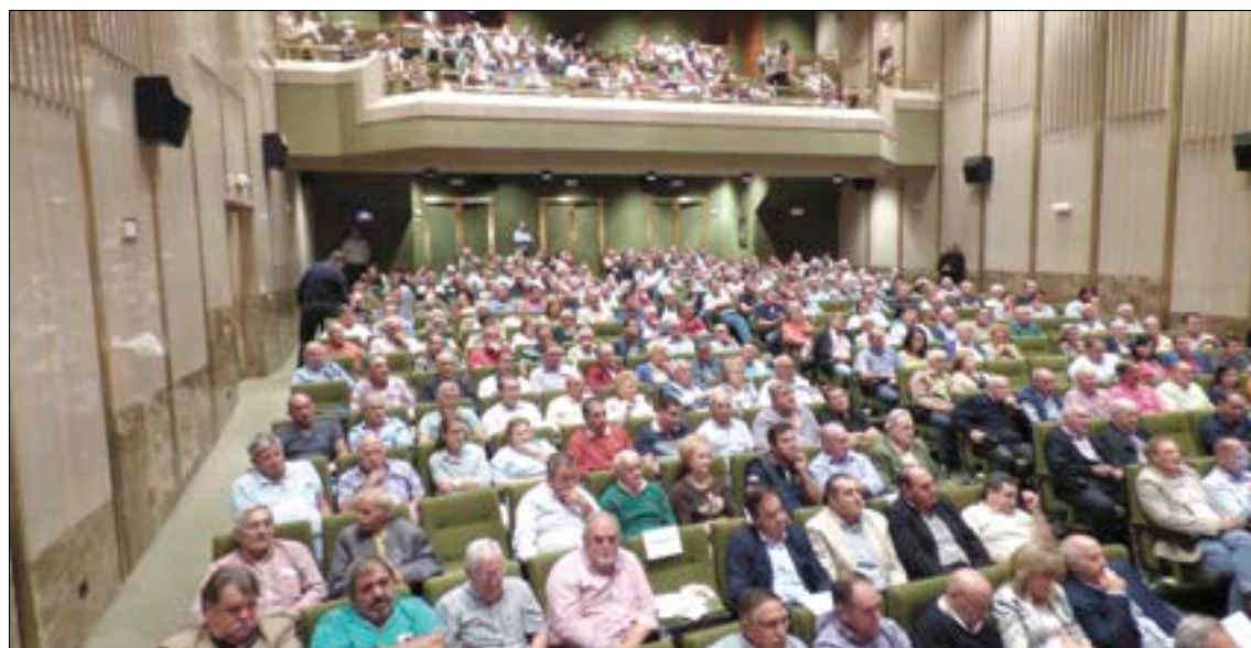
Los agricultores y ganaderos completaron el aforo del auditorio para escuchar a los ponentes.

"Somos uno de los pocos sectores económicos que puede competir a pesar de que se nos considere invisibles" indicó, y advirtió de lo negativa que es la volatilidad de los precios, lo que provoca inseguridad en el sector. "Hace falta que la sociedad se dé cuenta de que la actividad es fundamental porque administramos algo básico como son los alimentos", sentenció y recomendó seguir el ejemplo de Estados Unidos que ha fortalecido su sistema de seguros para garantizar la renta en caso de hundimiento del mercado.