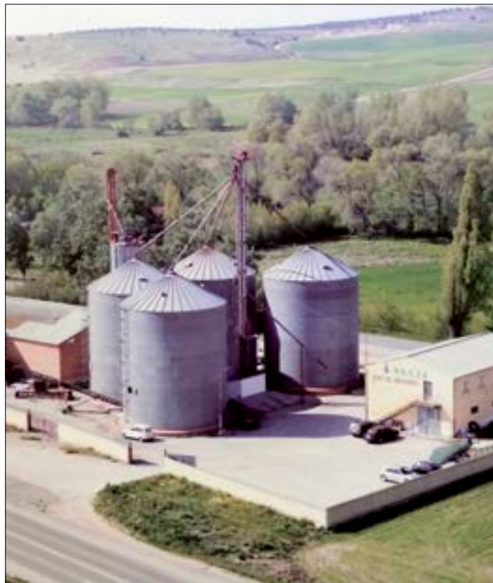
Un paso más para el fortalecimiento del sector productor.

La Coop. El Secadero durante su andadura se convirtió en un referente para el cultivo del girasol en todo el país. Propició su desarrollo en Segovia en tierras de secano, haciendo que esta segunda cosecha se convirtiera en un complemento fundamental para la supervivencia de las explotaciones. Hizo ver a los agricultores que la unión era muy importante para conseguir mejores precios por la pipa y abaratar costes con un simple proceso de