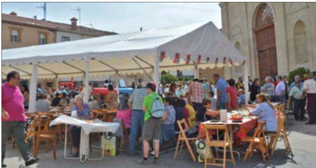
La fiesta se ha consolidado como una de las citas más importantes en la reivindicación del cordero burgalés.