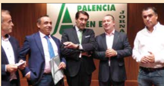
El consejero Suárez-Quiriones junto a responsables de ASAJA.

El presidente regional de ASAJA anunció que se pedirá que se eliminen restricciones a la orden, pero pidió a los agricultores que actúen con responsabilidad, sin abusar, y "sólo quemar lo que nos permiten porque no queremos salir en el telediario por causar incendios".