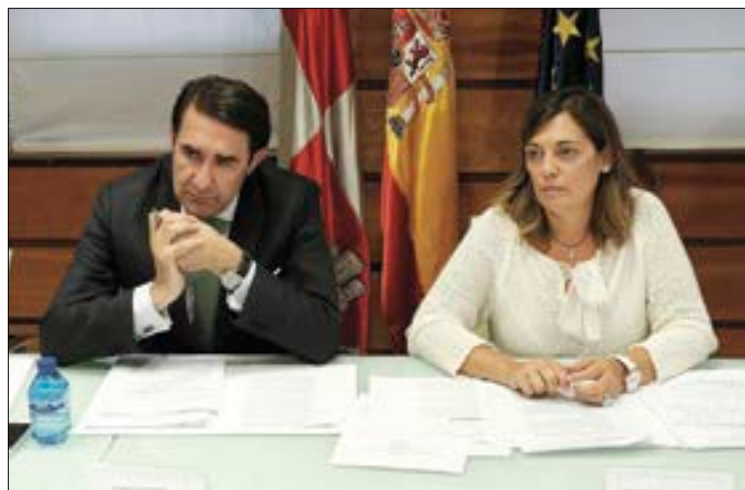
El consejero de Fomento y Medio Ambiente y la consejera de Agricultura y Ganadería.

PAC y si en 5 días no se deniega se obtiene por silencio administrativo positivo;