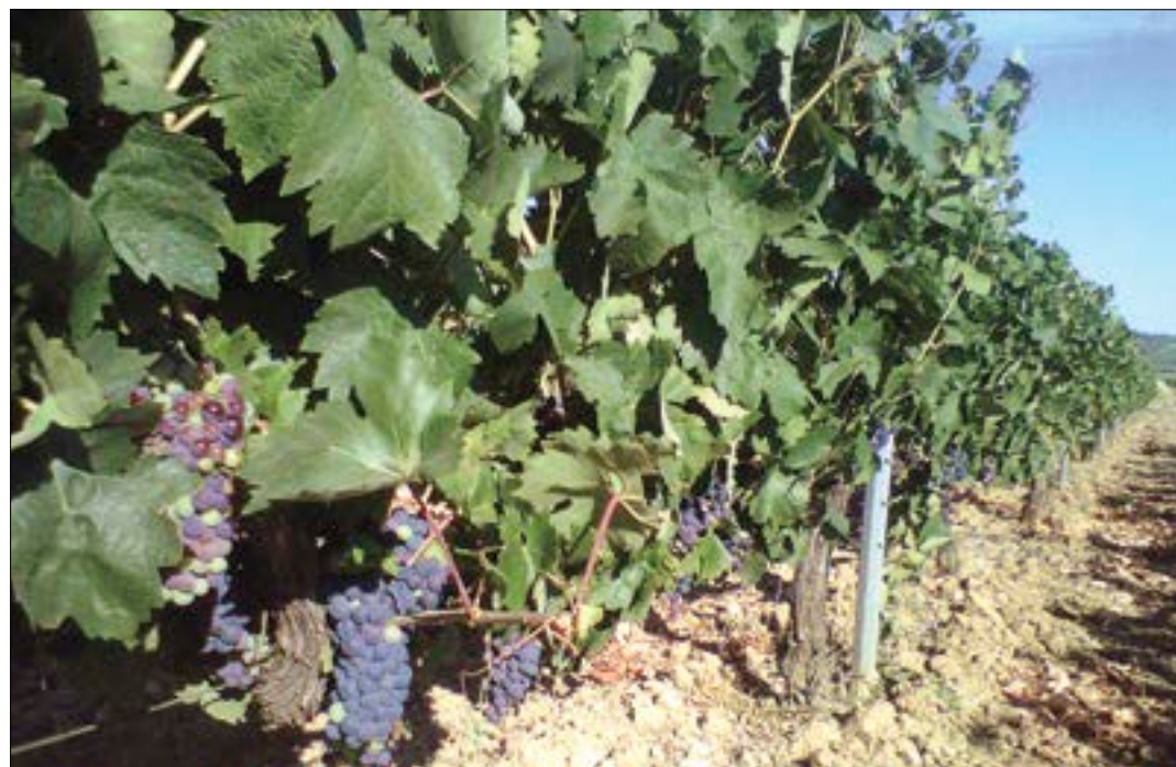
Cepas de uva en la provincia de Valladolid.

El plazo de presentación de solicitudes se establecerá en la correspondiente convocatoria, que se publicará estos días.