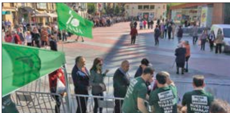
Miles de ciudadanos han secundado estas acciones de protesta.