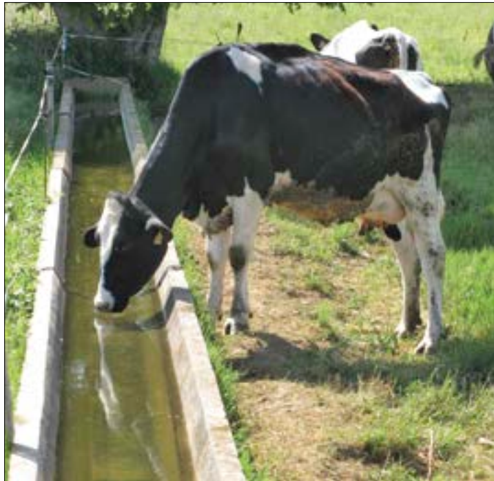
El sector del vacuno de leche vive en la cuerda floja.

El montante global de esta ayuda es de 350 millones de euros para toda la Unión, de los que 14,6 corresponderían a España. A Castilla y León, atendiendo a su peso productivo, el criterio más objetivo para efectuar el reparto, le estarían destinados 2,4 millones de euros, una cifra irrisoria a repartir entre los cerca de 1.400 ganaderos de la Comunidad Autónoma. ASAJA considera que las administraciones nacional y autonómica “deben ser coherentes y demostrar más allá de las promesas que