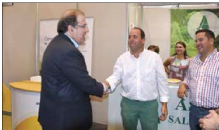
Juan Vicente Herrera, en su visita a Salamaq.