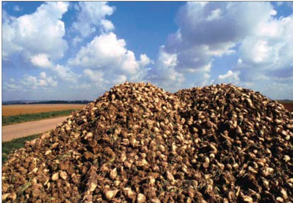
Poco a poco se irán multiplicando los montones de raíz en las tierras de la comunidad autónoma.

Según datos de las propias industrias, que ya han avanzado sus previsiones de recepción, Azucarera espera 1.605.000 toneladas de remolacha líquida de las 18.209 has de cultivo que tiene contratadas y ACOR 760.000 toneladas de las 7.400 has de sus socios. En general, menos producción y menos superficie sembrada, causadas principalmente por el retraso y malas condiciones en las siembras e incluso la imposibilidad de realizar una parte importante de las mismas.