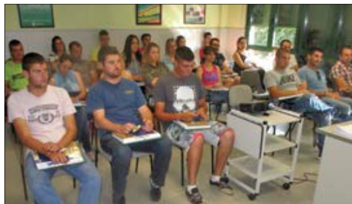
Jóvenes asistentes al curso de incorporación iniciado en septiembre.

A principios de septiembre ASAJA-León comenzaba a impartir un curso de Incorporación de Jóvenes a la Empresa Agraria, que se prolongará durante 38 días hasta completar las 150 horas lectivas. El curso se imparte en las aulas de formación de las oficinas de la organización en León capital, y cuenta con 26 alumnos matriculados que provienen de distintos puntos de la provincia, excluido el Bierzo donde próximamente comenzará otro para atender las necesidades de esa comarca. El curso, homologado por la Junta de