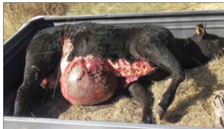
Los ataques, una pesadilla continua para los ganaderos.

Los ganaderos de la comarca de Gredos no pueden soportar la presión asfixiante que los