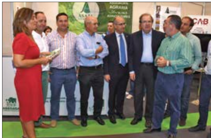
Visita del presidente de la Junta y la consejera al stand de ASAJA.