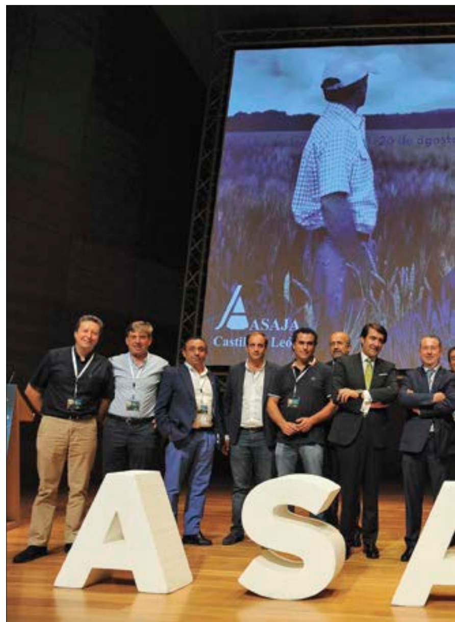
Arriba, los representantes provinciales y regionales de ASAJA, junto a los consejeros de Fomento y Medio Ambiente y Agricultura. Abajo, los compromisarios, que llenaron la sala del Auditorio Miguel Delibes, en la capital vallisoletana.

ASAJA de Castilla y León es la organización de referencia en la región destacando tanto en número de asociados como por los resultados obtenidos en las elecciones Agrarias. La organización ha canalizado todas las reivindicaciones del sector en los últimos años en una línea marcada por la profesionalidad y la independencia. Desde las diferentes organizaciones provinciales, los servicios técnicos de ASAJA han respondido a la cada vez mayor demanda de servicios por parte de los socios, en aspectos como la formación, información, tramitación de ayudas, asesoramiento fiscal y laboral, seguros agrarios, etcétera. Pero el mayor