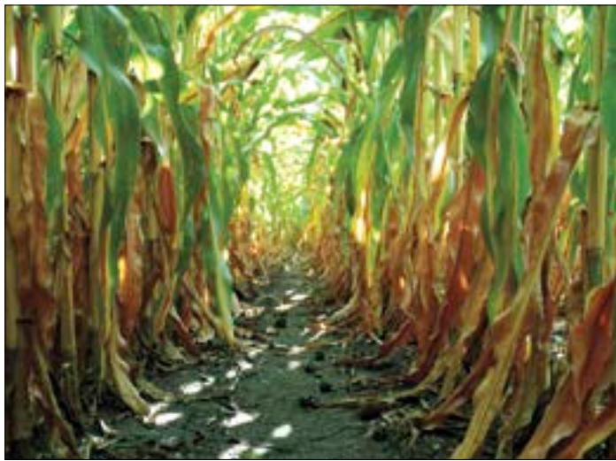
Un criterio arbitrario que deja fuera a numerosas explotaciones.

La provincia de León es la principal productora de maíz de España con una media de 70.000 hectáreas de cultivo cada año, y representa más del 55% del cultivo de toda la autonomía. Es inconcebible que no se considere prioritario un cultivo, el del maíz, que justifica la obra pública