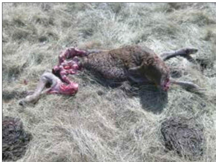
Un reciente ataque del lobo al ganado.

Sin embargo, el hartazgo que tienen los profesionales del campo, que continúan sin-