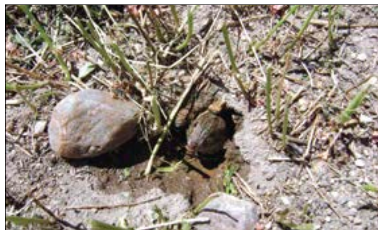
Los topillos, una amenaza permanente.