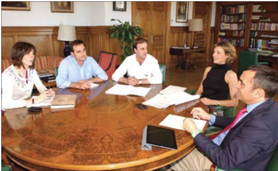
Reuniones de ASAJA para mejorar la Sanidad Animal mantenidas con Isabel García Tejerina y Valentín Almansa, en el ministerio.