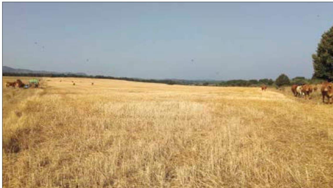
La actividad agroganadera es antiquísima y esencial en el municipio de Cidones.

ASAJA se muestra muy preocupada por la radicalización de un sector importante de la sociedad, que dicho sea de paso en su inmensa mayoría conformado por urbanitas que no hacen vida en el pueblo, para el que ciertas actividades molestas derivadas de la actividad agrícola y ganadera deben desembocar en que se limiten los