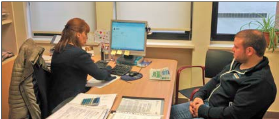
El equipo técnico de ASAJA cuenta con la experiencia y conocimientos precisos para gestionar con toda garantía las solicitudes.

Para que una solicitud de plan de mejora sea seleccionada, deberá obtener, de acuerdo con los criterios de selección, una puntuación igual o superior a 15 puntos, siendo necesario puntuar en un mínimo de 3 criterios de selección. Excepcionalmente, solo se necesitarán 8 puntos en el caso que el plan de