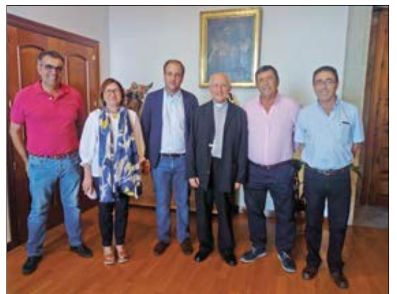
Reunión con el obispo de Ávila.

Como ya ha expresado públicamente en reiteradas ocasiones la organización agraria, ASAJA de Ávila exige respeto al resto de organizaciones agrarias y defiende la unidad de acción como la mejor herra-