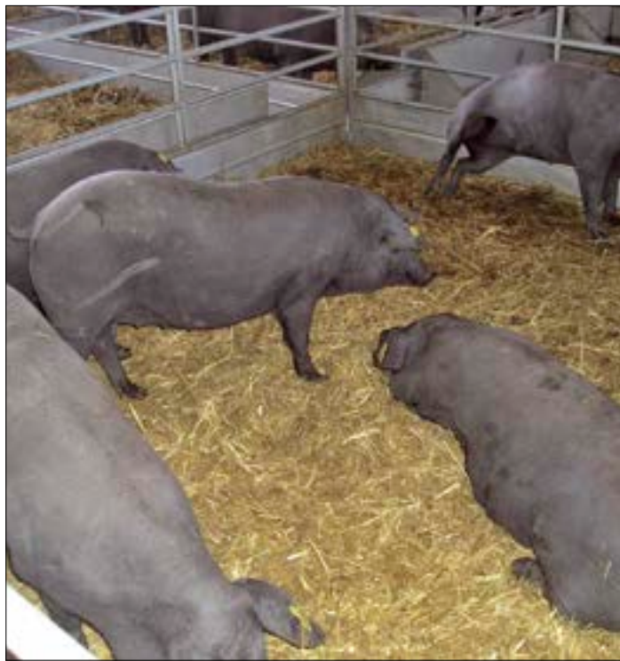
El ibérico es un sector puntero en Castilla y León.

Uno de los cambios más importantes que demanda el sector es el que tiene que ver con la edad mínima para el sacrificio de los animales. La experiencia, después de más de 4 años de aplicación de la Norma de Calidad, dice que es una edad excesiva, ya que con 8 meses es suficiente para adquirir el peso comercial y en todo caso más de los 115 Kg., de peso mínimo de la canal