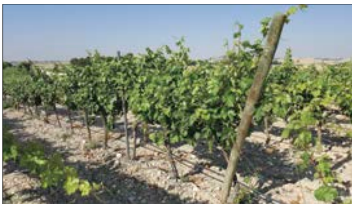
Se observa una buena calidad y sanidad de la uva.

Se espera una calidad de uva muy buena y excelente sanidad, fundamentalmente por la acertada acción preventiva de los viticultores, cada vez