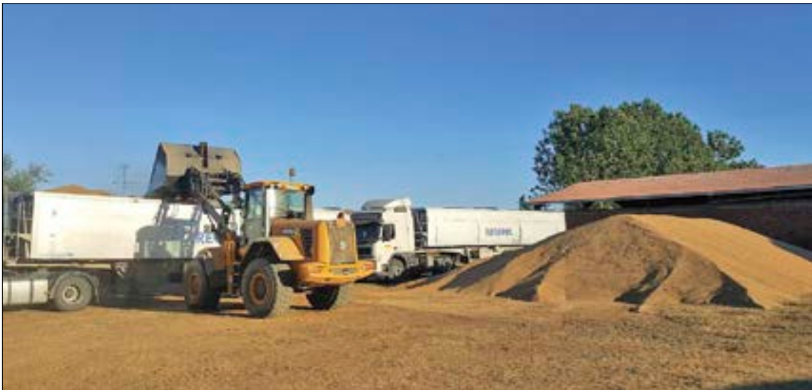
Las producciones han sido estimables, pero de nada sirve si no se vende el cereal a un precio justo.