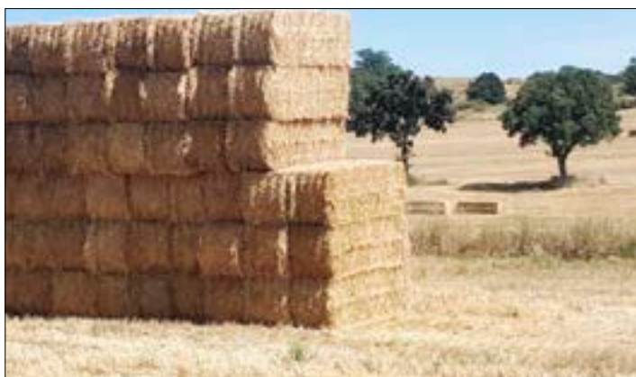
Pacas amontonadas en un campo leonés.

El destino más tradicional es las explotaciones ganaderas, bien para procurar alimento, bien cama, a los animales. Pero también se utiliza en la fabricación de pellet para calderas, o la generación de energía complementaria.