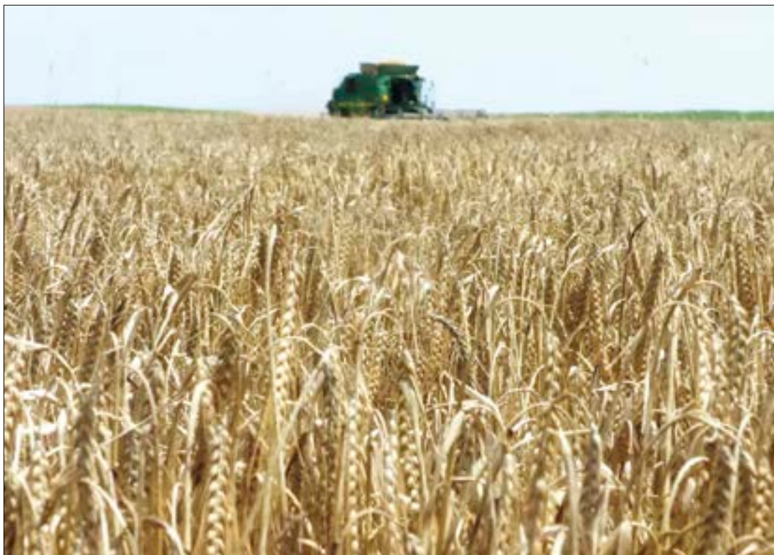
Una campaña atípica que finalmente ha arrojado en general buenas producciones.

Hay que tener en cuenta que la incertidumbre ha sido una constante a lo largo de la campaña, ya que la sequía -la peor que se recuerda- se agudizó