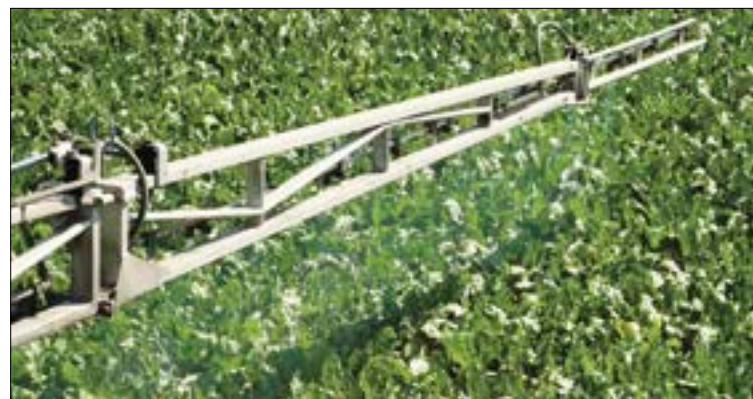
Nuevo y complejo reto para el sector remolachero.

El sector remolachero en España está buscando sus propias soluciones. El reto es conseguir unas estrategias de control de esas plagas medioambiental, económica y socialmente sostenibles.