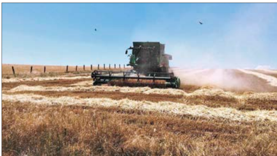
El campo necesitaba como nunca una buena cosecha.

Sin embargo los mejores resultados no paliarán las malísimas producciones y pérdidas del año pasado