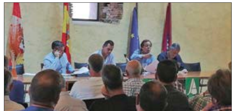
Reunión celebrada en Fuenteguinaldo..

ASAJA-Salamanca y la 19 de Abril valora positivamente los beneficios que aporta el saneamiento ganadero que se realiza en las explotaciones de Castilla y León pero consideran necesario mejorar las campañas de saneamiento y minimizar los perjuicios. Las organizaciones no entienden que los programas nacionales no se ejecu-