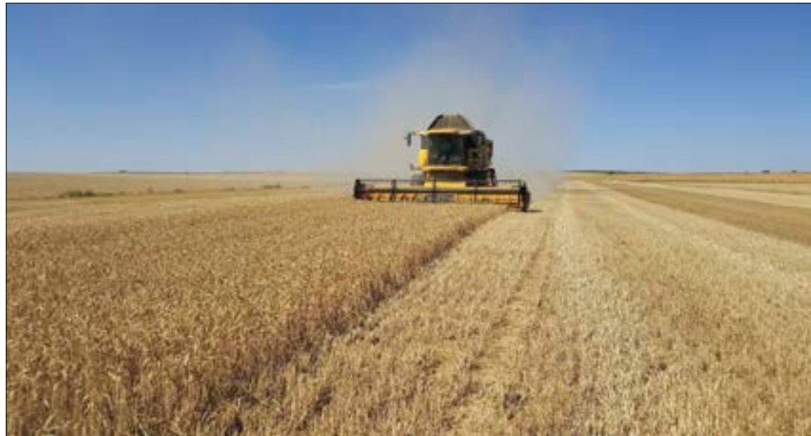
El objetivo es preparar al sector para que pueda afrontar fortalecido años como el vivido en 2017.