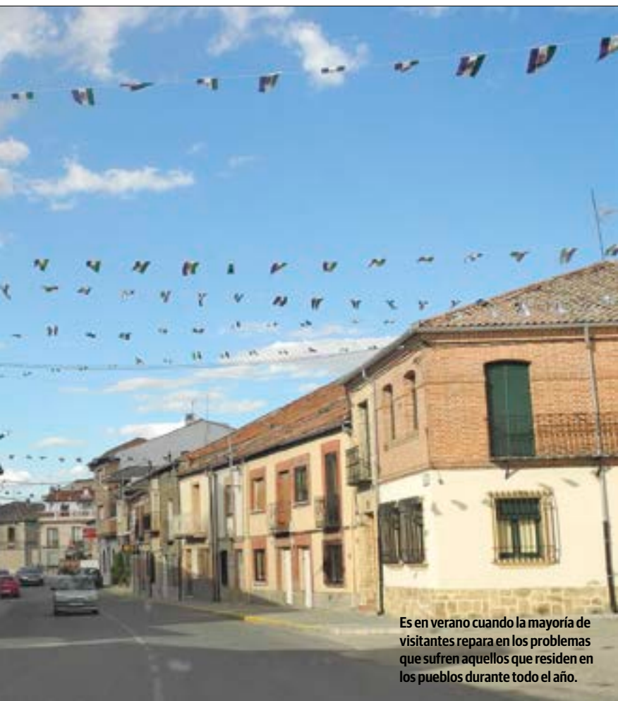
Es en verano cuando la mayoría de visitantes repara en los problemas que sufren aquellos que residen en los pueblos durante todo el año.