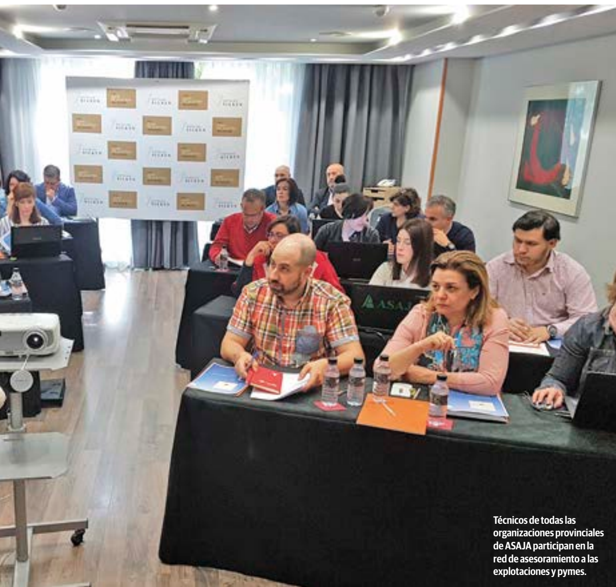
Técnicos de todas las organizaciones provinciales de ASAJA participan en la red de asesoramiento a las explotaciones y pymes.