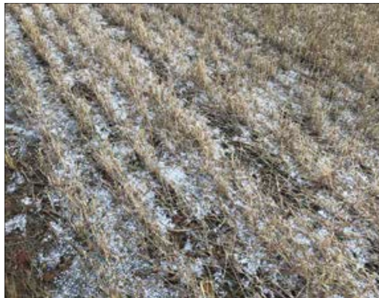
Las indemnizaciones ya han empezado a recibirse.

Las indemnizaciones ya habían empezado a recibirse por los titulares de las explotaciones a finales del mes de agosto. Aunque esas cantidades paliarán en parte las pérdidas de los agricultores afectados, suponen una cantidad mucho menor que la que estima ASAJA-Palencia sobre los da-