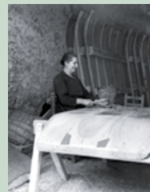
Foto de nuestros abuelos. Mujer empedrando trillos en Cantalejo (1952, Juan Cruzado).

FONDOS DEL MINISTERIO DE AGRICULTURA, PESCA Y ALIMENTACIÓN DE ESPAÑA