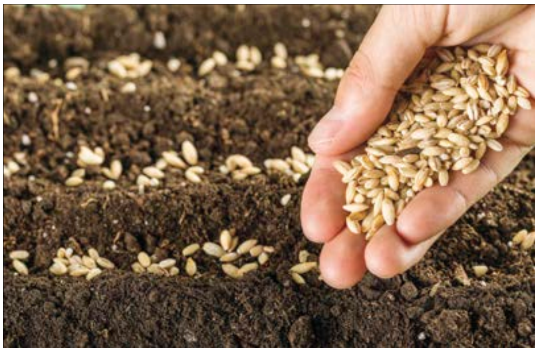
Tan solo en León se utilizan para semilla unas 24.000 toneladas de grano.

Este grano destinado a las siembras lo almacena el agricultor en sus instalaciones y en algunos casos, si dispone de remolques, lo deja en los mismos, sin descargarlo, con el fin de evitar trabajos innecesarios. Lo propio es que este grano, que se transformará en semilla para la campaña siguiente, se lleve a unas instalaciones de limpieza y selección, con el fin de apartar las impurezas, granos partidos o mal desarrollados, lo que se hace con un procedimiento mecánico de cribado, y posteriormente se incorpora un tratamiento de desinfección contra plagas y enfermeda-