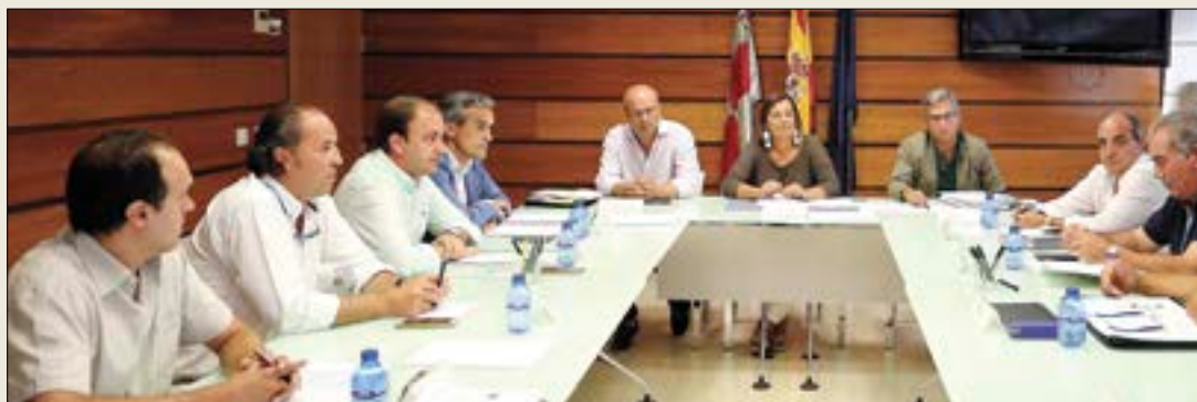
Última reunión del Consejo Agrario de Castilla y León.

El pasado miércoles 22 de agosto se celebró una reunión del Consejo Agrario de Castilla y León, presidido por la consejera de Agricultura y Ganadería, Milagros Marcos. Este Consejo Agrario, que marca el inicio del curso político después del parón vacacional del verano, es también el primero que se celebra después de los cambios políticos en el Gobierno de España y en consecuencia en el ministerio de Agricultura. El sector está pendiente de la evolución de los precios en los mercados agrarios y ganaderos, de las negociaciones para la aprobación de la nueva PAC, y de las previsiones de pago de las ayudas de 2018 cuyo anticipo del 50%