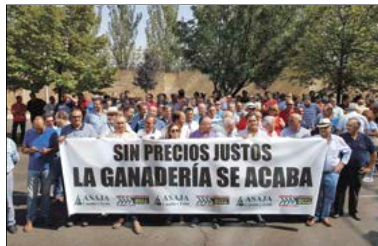
Manifestación regional a las puertas de la consejería, en Valladolid.