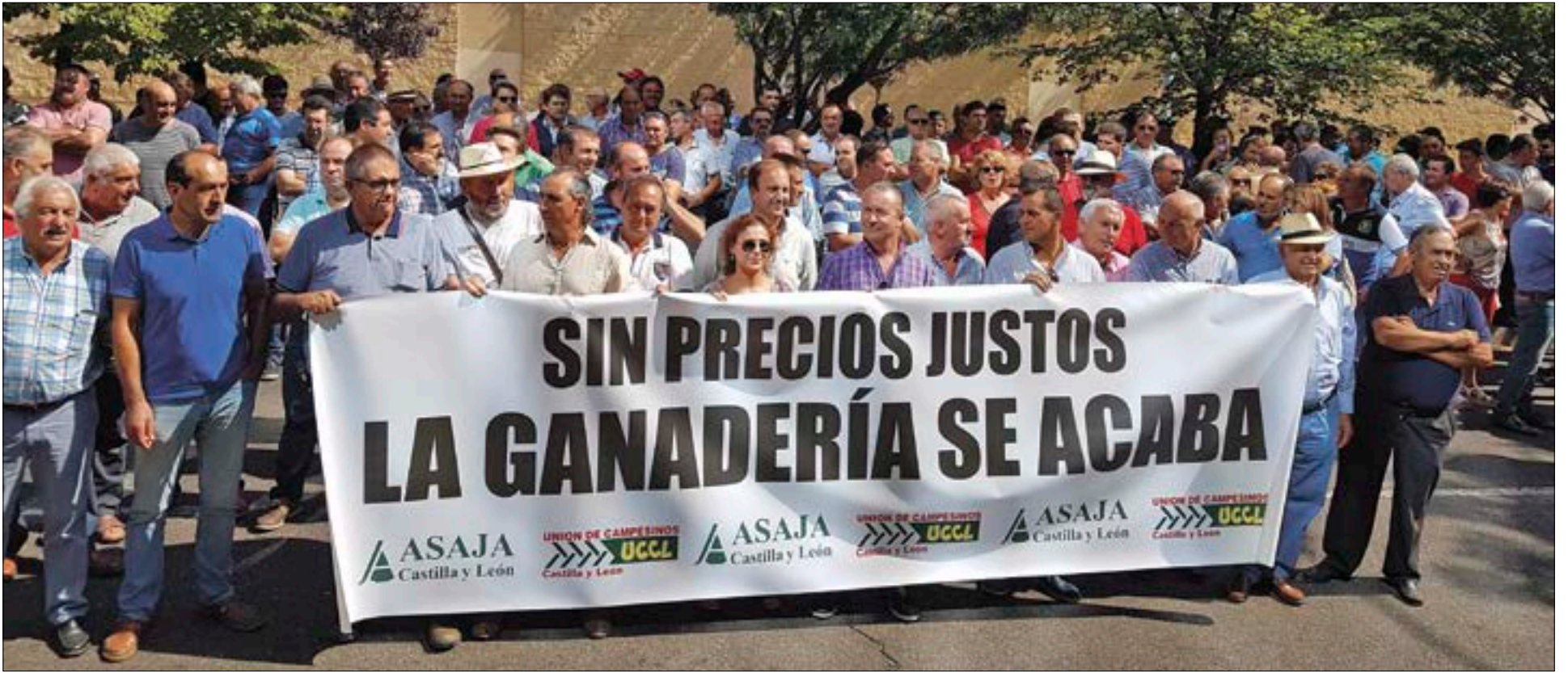
Desánimo generalizado de un sector que se esfuerza por avanzar y que lleva ya años produciendo por debajo de costes.