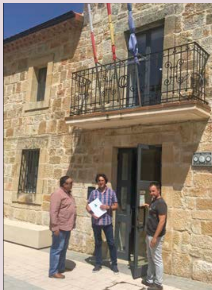
Responsables de ASAJA-Soria acudieron a Cidones para entregar el recurso.

Asimismo, ASAJA considera que se perjudica gravemente a los propietarios de suelos rústicos comunes, así como a todos los agricultores y ganaderos que en ellos desarrollan su actividad. También, se añade en las alegaciones que la modificación no supone una mayor protección ambiental, sino un intento por derivar las responsabilidades municipales, perfectamente definidas en la normativa actual, a otras instancias no competentes para ello.