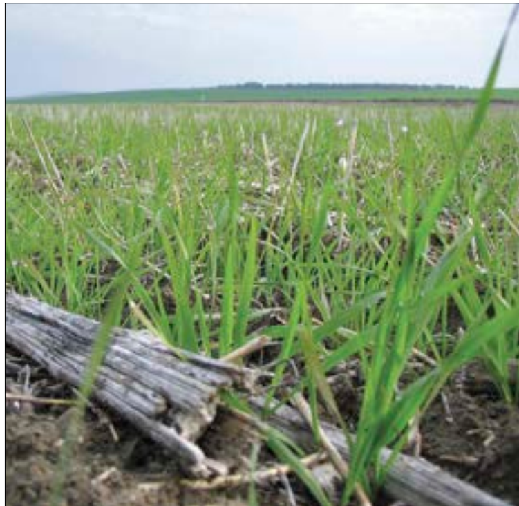
Los cursos, impartidos por expertos, tendrán 20 horas de duración.