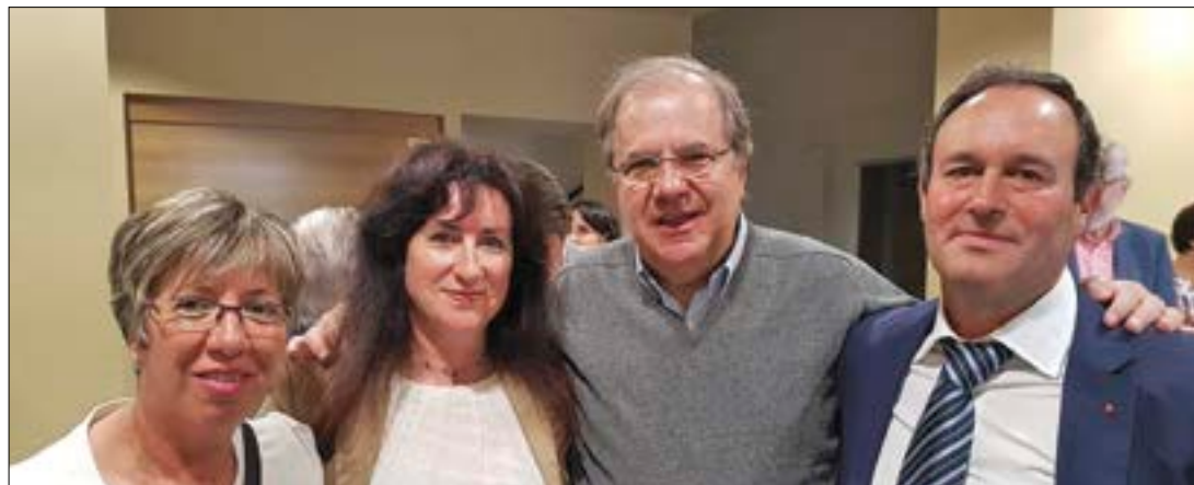
Visita de Juan Vicente Herrera a San Zadornil, aprovechada por ASAJA-Burgos para transmitir los problemas del sector.

Más concretamente, se incidió en la problemática de los municipios cercanos a la central de Garoña y al aumento de del despoblamiento como