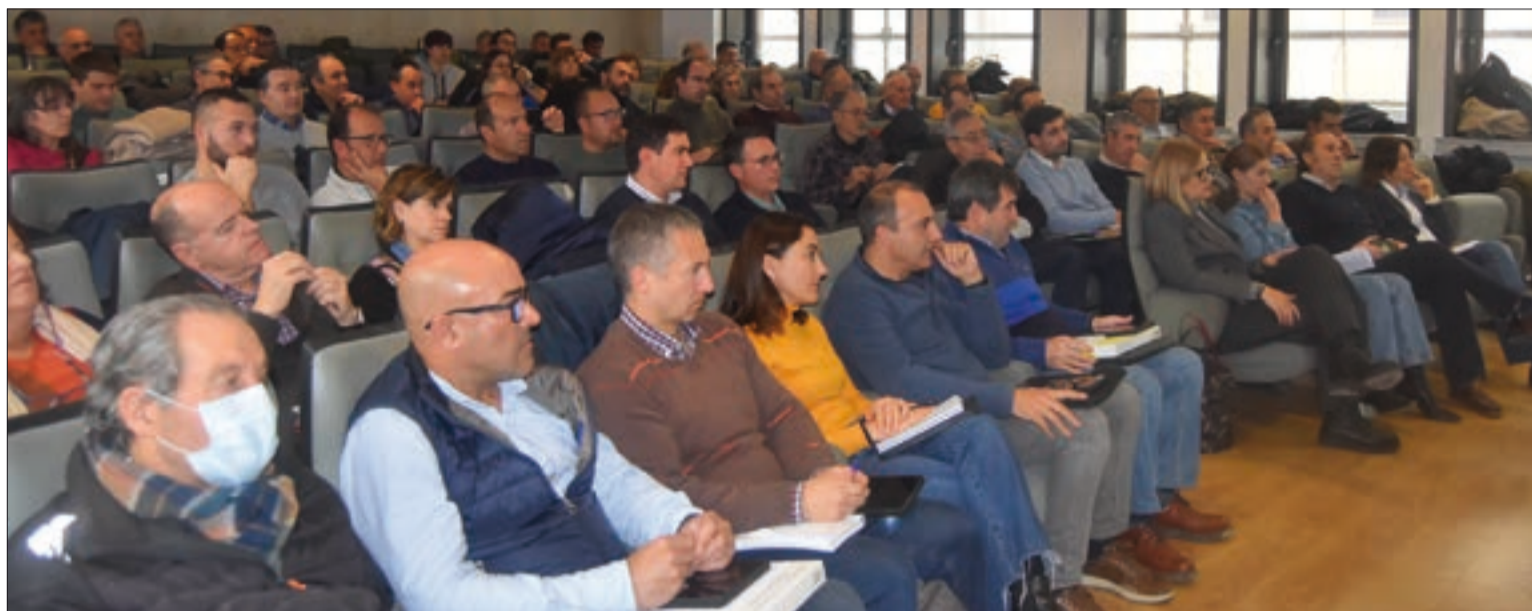
ASAJA Valladolid trabaja para que los requisitos a cumplir sean los mínimos posibles, y además para facilitar al máximo al agricultor esta tarea.

1.El SIEX o Sistema de información de explotaciones agrícolas, ganaderas y de la producción agraria, que es un conjunto de bases de datos y