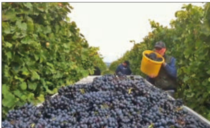
Encontrar trabajadores es cada vez más difícil.

ASAJA denuncia que la nueva subida del Salario Mínimo Interprofesional (SMI), la quinta consecutiva sin consenso con la patronal, supone un golpe insostenible para el sector agrario, que ya enfrenta una crisis estructural debido al aumento de los costes de producción, costes salariales y sociales, y a la falta de mano de obra. Con esta nueva subida del SMI, el incremento desde 2016 supone ya el 80 por ciento. El presidente nacional de ASAJA, Pedro Barato considera que "cualquier subida del salario mínimo es inasumible en el campo. Desde 2016, el incremento ha sido del 80%, lo que está llevando al límite a muchas explotaciones". El incremento aprobado eleva el salario mínimo neto a 1.184€ por 14 pagas, pero el coste real para el empresario agrícola será de 1.925€ por trabajador. De este importe, el trabajador verá descontados 720€ en co-