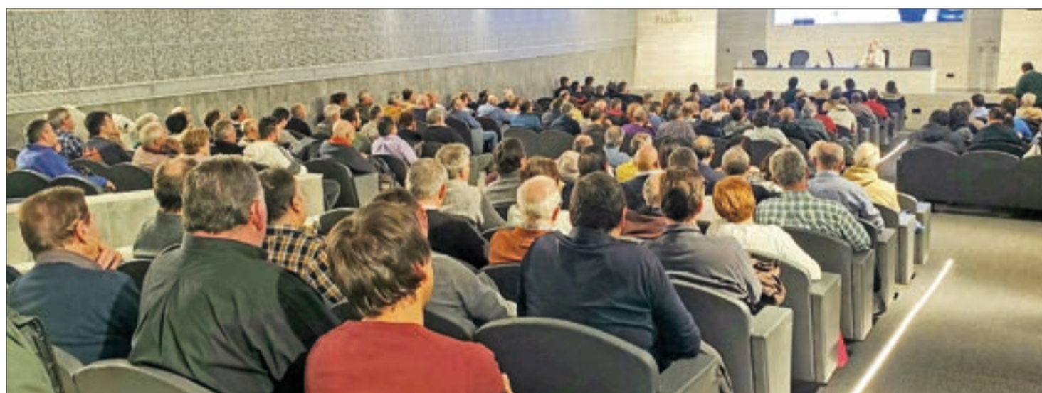
Asamblea de las comarcas de Ampudia y Dueñas, celebrada el 13 de febrero, a la que asistieron más de ciento cuenta socios.