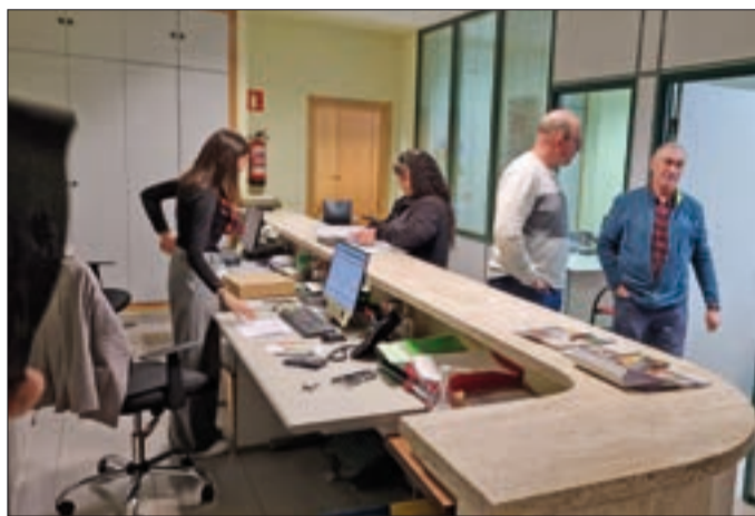
Sede de ASAJA en la capital leonesa.

La atención es horario de mañana y tarde, y es necesario pedir cita previa