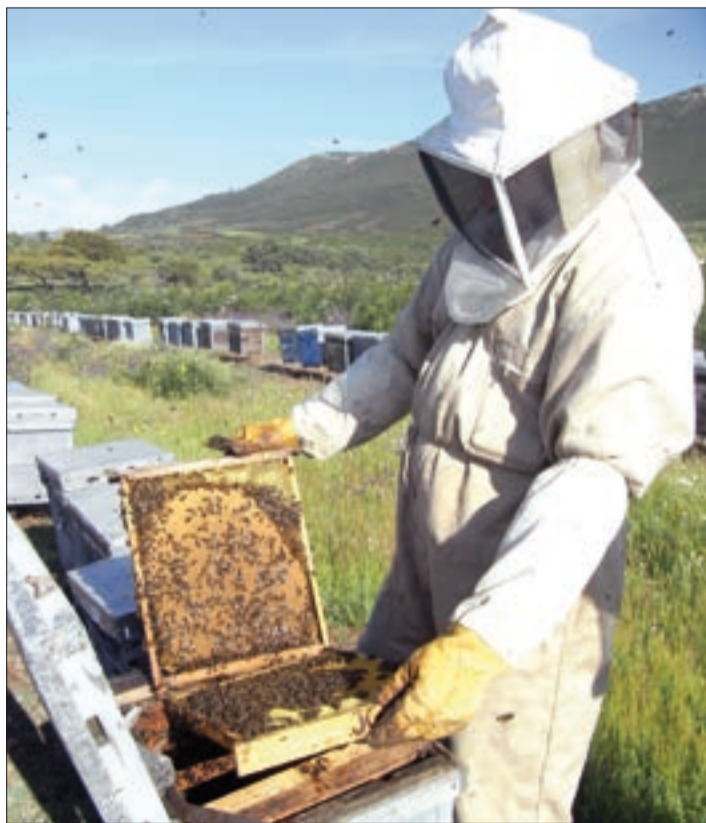
El número de explotaciones apícolas en España ha crecido.

La norma garantiza que el producto que llega al consumidor no ha sido desprovisto de las sustancias o ingredientes naturales que le confieren sus propiedades características y cumple con los criterios de composición, calidad y pureza que establece la normativa.