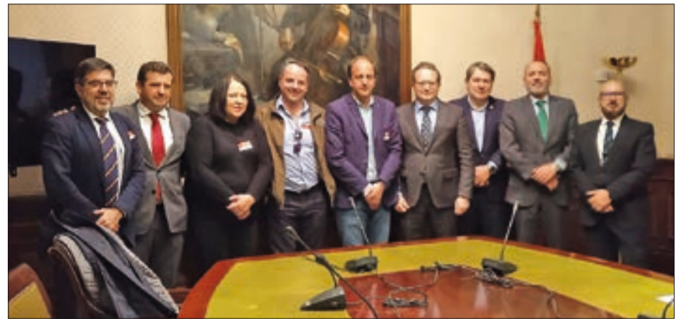
Los representantes de ASAJA abogan por el control de las poblaciones loberas.