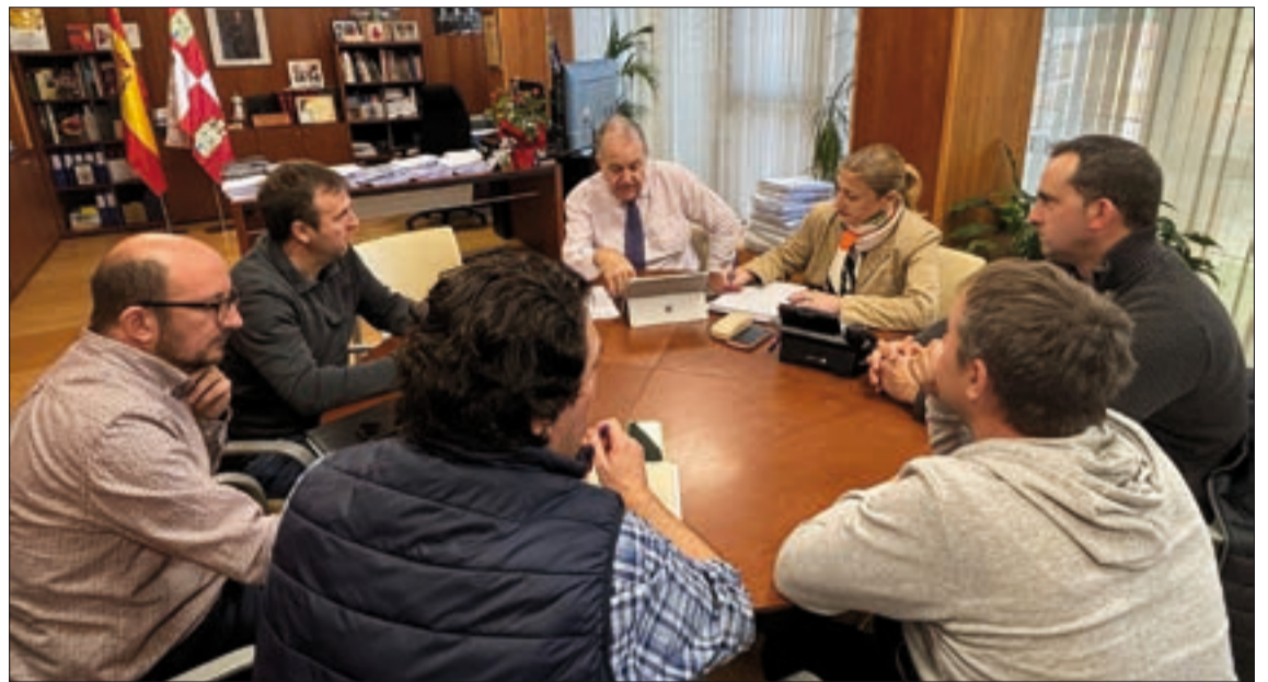
La delegada territorial de la Junta tomó buena nota de todas las indicaciones de los técnicos y responsables de ASAJA Soria.

Por otra parte, ASAJA incidió en la necesidad de actualizar y mejorar los datos en torno a las solicitudes de explotación prioritaria para poder ser incluido en el registro, cuestión muy importante porque este reconocimiento trae consigo una serie de ventajas en seguros agrarios, ayudas a la inversión como las 4.0 y beneficios fiscales importantes especialmente a la hora de adquisición de tierras... En este sentido ambas partes se han comprometido a trabajar en esas cuestiones que afectan a los trámites para mejorar la situación, actualizando los datos al año 2025, ya que los actuales -como ha denunciado ASAJA- son de 2020, previos a la guerra de Ucrania y a sus consecuencias en precios y en la economía en general. Se trata de una desactualización o desfase que ha provocado que algunas solicitudes hayan sido