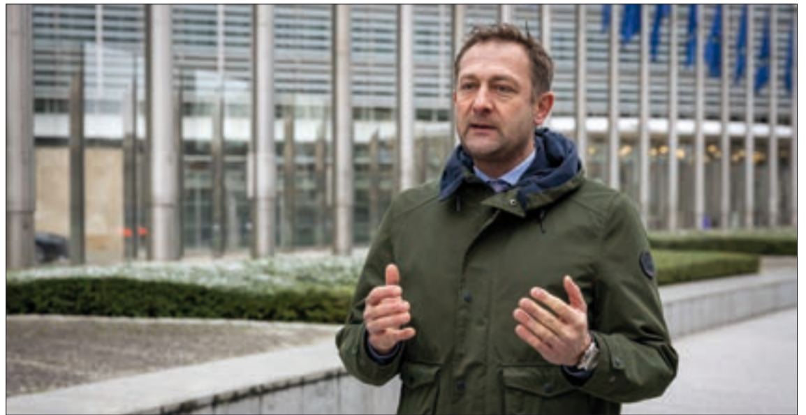
El comisario europeo de Agricultura, Christophe Hansen.

Sobre estas dos prioridades, pivotarían el resto de las propuestas comunitarias contenidas en el texto ayer presentado, tanto las que condicionan nuestras relaciones comerciales en el contexto internacio-