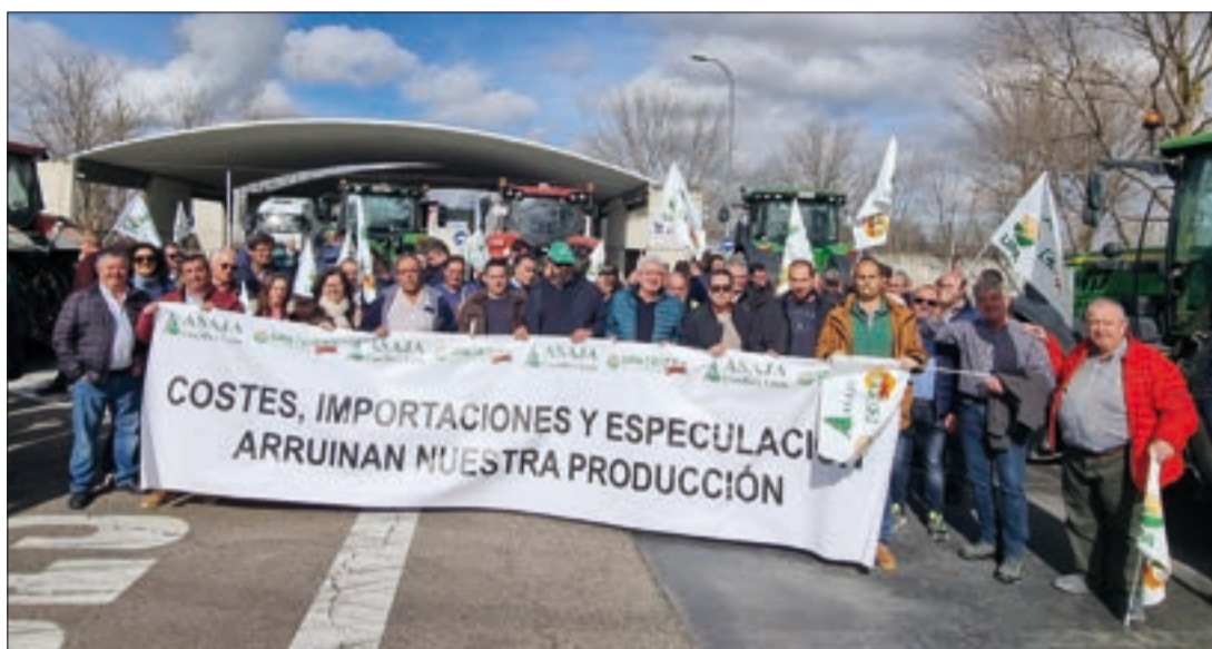
Amplia participación de ASAJA Segovia en la protesta de cerealistas de Castilla y León en Babilafuente.