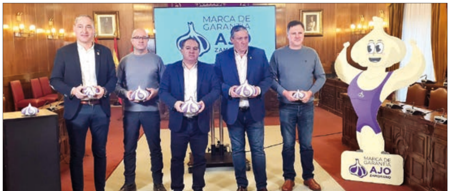
Momento de la presentación de la Marca de Garantía Ajo Zamorano.