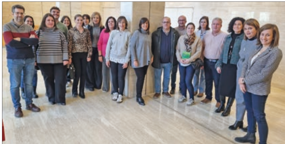
Parte de los técnicos de las organizaciones provinciales de ASAJA que acudieron a la reunión en Valladolid.

En cuanto a la condicionalidad, se suprime el control en