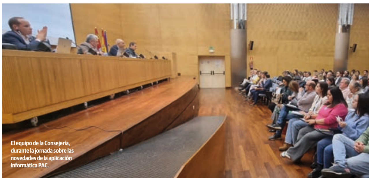
El equipo de la Consejería, durante la jornada sobre las novedades de la aplicación informática PAC.