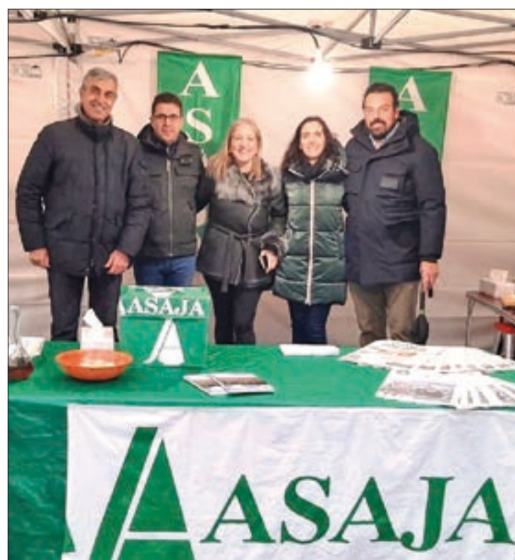
El equipo que atendió el stand de ASAJA Palencia en Saldaña.