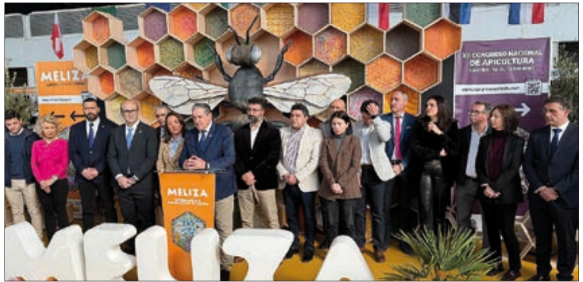
Ahora el objetivo es fortalecer la Marca de Garantía Miel de Zamora.

Además, al mismo tiempo, y por primera vez en Zamora, se