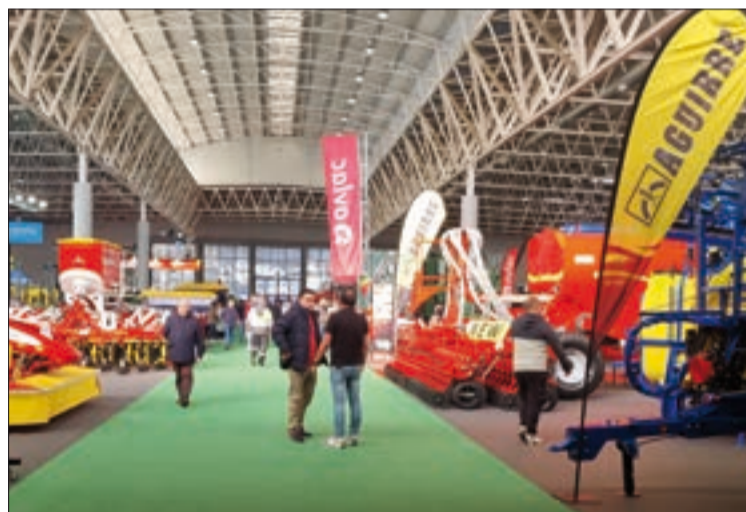
La maquinaria agrícola, un mercado importante y en continua renovación.

Dentro de nuestra comunidad autónoma, encabezan las exportaciones a gran distancia del resto las provincias de Bur-