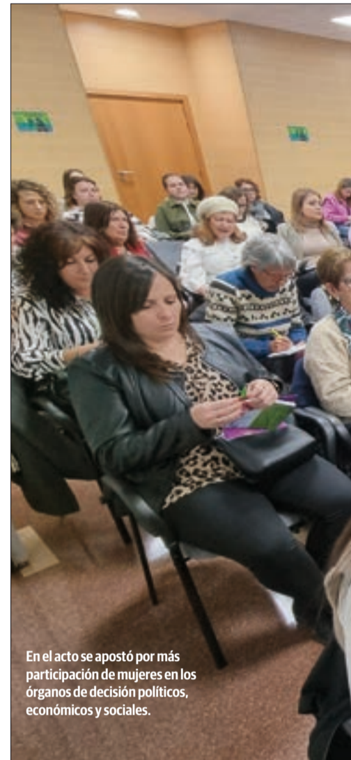
En el acto se apostó por más participación de mujeres en los órganos de decisión políticos, económicos y sociales.