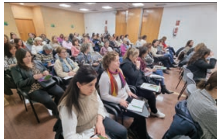
Jornada de mujeres, celebrada en el marco de la feria Agraria.