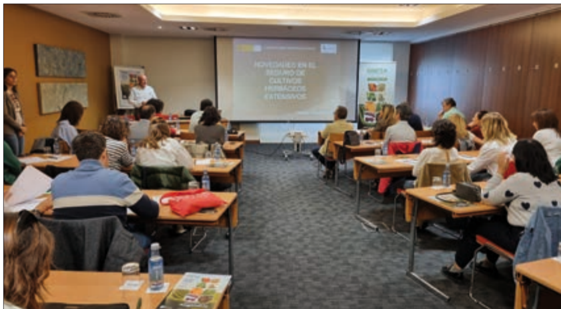
Jornada de los técnicos de Seguros Agrarios de las organizaciones de ASAJA en Castilla y León.