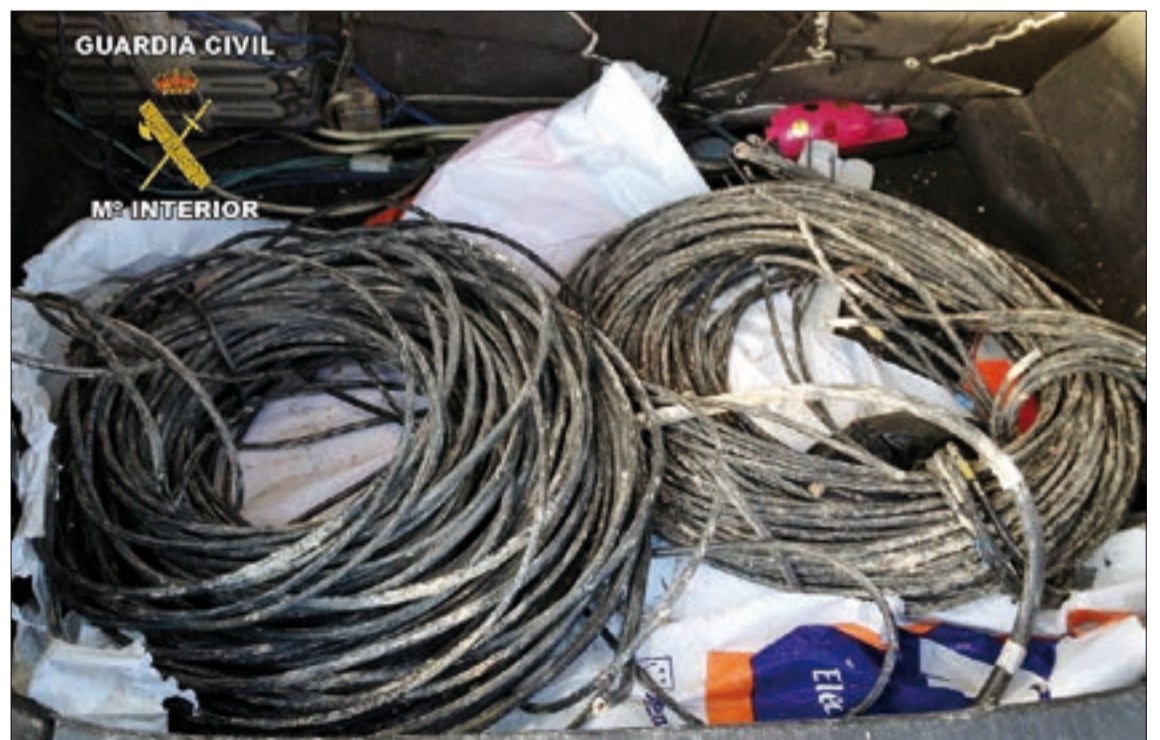
El robo de material agrícola, como el cableado de cobre, causa enormes pérdidas a las explotaciones.