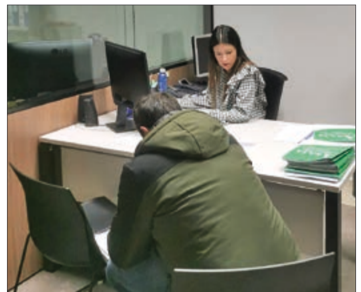
Tu solicitud PAC con todas las garantías, solo en ASAJA.

También queremos recordar las principales novedades