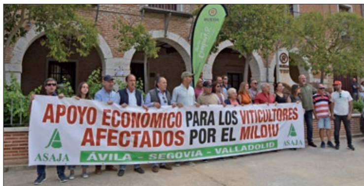
La protesta frente a las puertas del Consejo Regulador de Rueda.

El objetivo, visibilizar el problema económico que tienen los viticultores que han perdido su cosecha de uva a causa del mildiu, principalmente en la C.R.D.O. Rueda y en el resto de zonas vitícolas como Cigales y la Ribera del Duero.