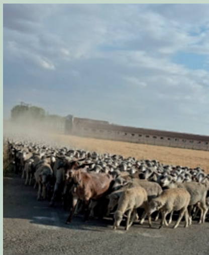
De vuelta para casa, después del pasto.