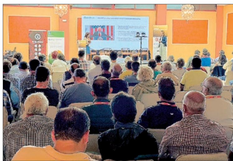
Participantes en el XII Congreso 'El Futuro del Cereal', en Magaz de Pisuerga.

sino a nivel mundial, que repercute en el mercado interior debido a los acuerdos de libre comercio y a medidas como el