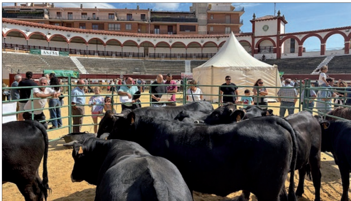
La feria sigue, con paso firme, consolidándose como una cita imprescindible para los amantes de la ganadería, del campo y de la tradición en Soria.

La feria ya se celebraba antaño en las eras de Santa Bárbara y hay que tener en cuenta que Soria tiene una importante tradición ganadera desde hace siglos. Después de 14 ediciones en la plaza de toros, la feria si-