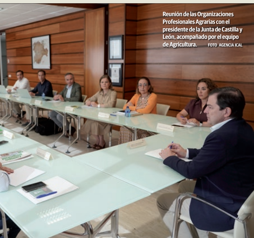
Reunión de las Organizaciones Profesionales Agrarias con el presidente de la Junta de Castilla y León, acompañado por el equipo de Agricultura.

ASAJA valora el buen criterio del ministro de favorecer e incentivar el seguro agroganadero, pero le critica su falta de sensibilidad con la ganadería y agricultura profesional –mayoritaria en Castilla y León–, a la que da el mismo trato que a quienes tienen el campo como una actividad complementaria.