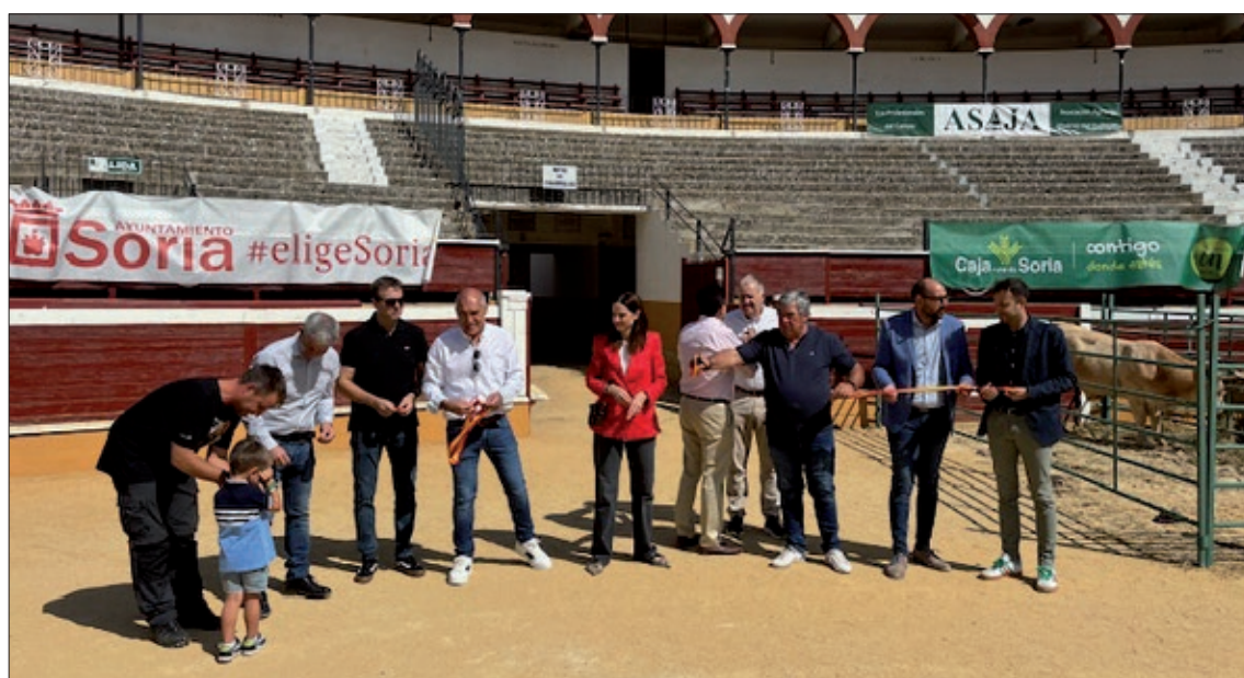
ASAJA Soria, siempre presente en la inauguración. Esta vez, al vicepresidente le acompañaba un representante de la sectorial de vacuno con su hijo.

gue adelante con el mismo objetivo con el que nació, que es acercar todo lo posible y de forma clara y sencilla el campo a la ciudad y dar a conocer a la so-