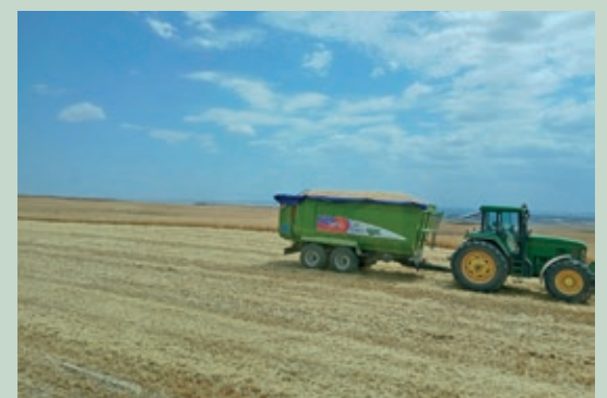
Una imagen del final de la cosecha 2025.