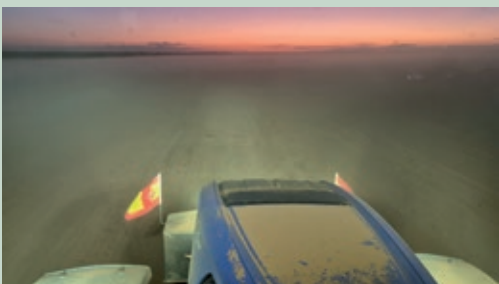
Siembra con poco tempero, por la falta de lluvias. Foto Donaciano, desde Ledigos, Palencia