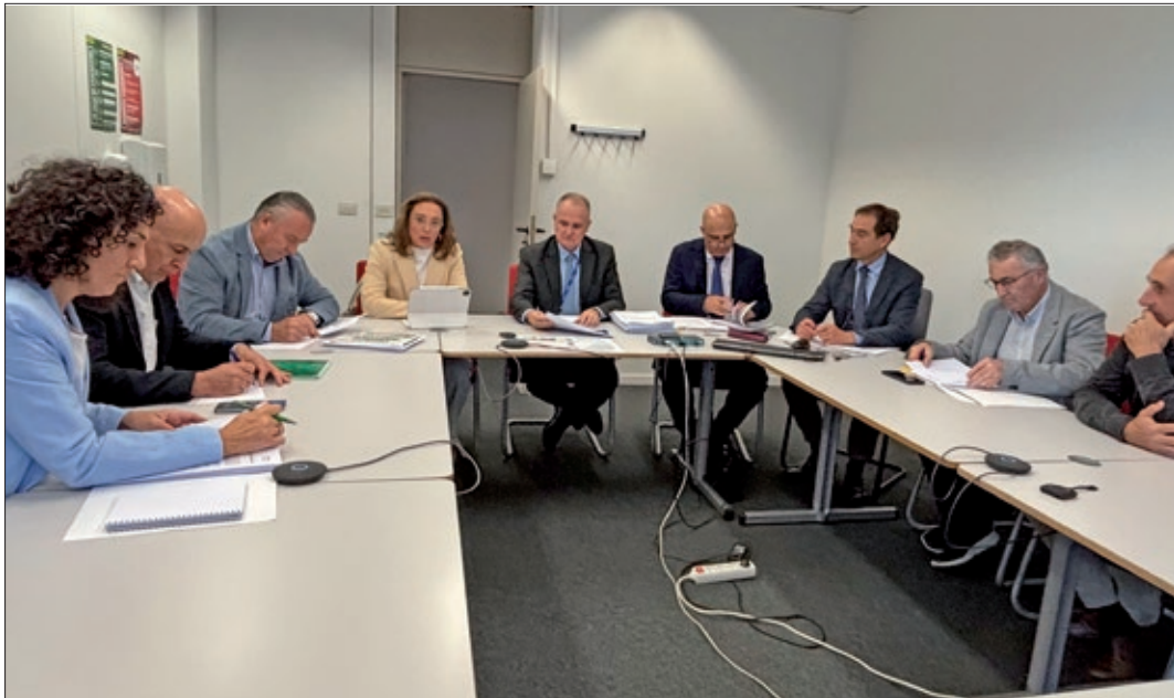
Representantes de ASAJA y del resto de OPAs, junto a la consejera de Agricultura, con responsables de la DG de Agricultura de la CE.

Consejera y OPAs se reunieron con la DG de Agricultura