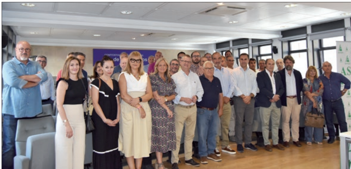
ASAJA Valladolid quiere ofrecer a sus socios las herramientas que les permitan ser competitivos frente a tanto reto que afronta el sector.

Estas herramientas para la rentabilidad también pasan por una apuesta fuerte y decidida por las nuevas tecnologías que está haciendo ASAJA Valladolid en los últimos años formando a sus socios, para en un contexto de costes tan altos,