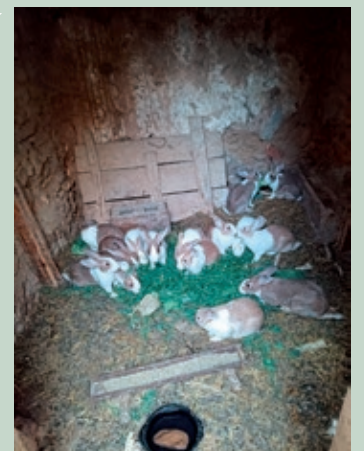
Conejos. Revilla de Collazos, Palencia