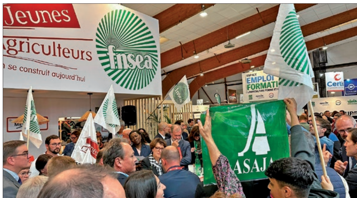
El equipo de ASAJA León, en el stand de FNSEA, durante la visita de la ministra francesa de Agricultura.

Parte de la plantilla de técnicos de ASAJA de León visitó la feria ganadera SPACE 2025, que ha tenido lugar en la ciudad de Reims, en el oeste de Francia. Es uno de los certámenes feriales agroganaderos más importantes en el país vecino y está especialmente representada en ella la ganadería de vacuno lechero. El equipo de ASAJA León visitó el stand de FNSEA y Jeunes Agriculteurs, organizaciones hermanas francesas, justo el día que la ministra de Agricultura gala, Annie Genevard, visitaba la feria.