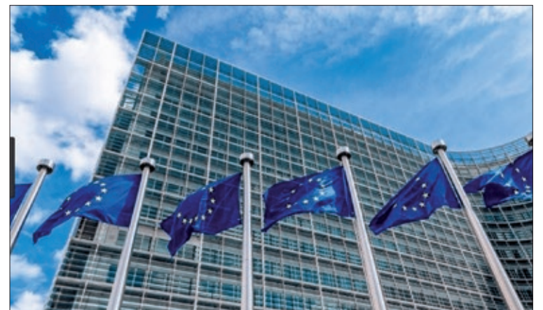
ASAJA pide que no se añadan cargas administrativas a los productores.

Una de las principales preocupaciones es el mecanismo de etiquetado propuesto, ya que la creación de un nuevo código o