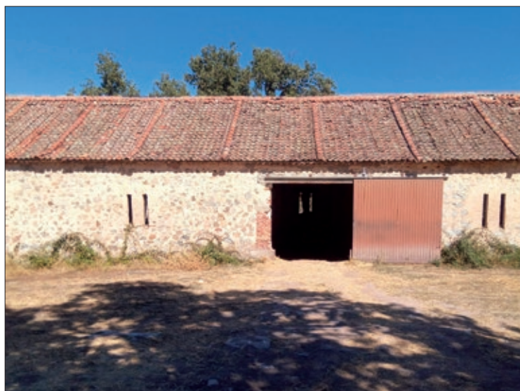
El almacén da servicio a los ganaderos de la zona.

Desde ASAJA Segovia, celebramos esta labor y animamos al OAPN hay que siga haciendo inversiones el pro de la actividad ganadera, que realiza una labor tan importante y necesaria en el cuidado del Medio Ambiente, principalmente en la prevención de incendios forestales y limpieza de montes y pinares.