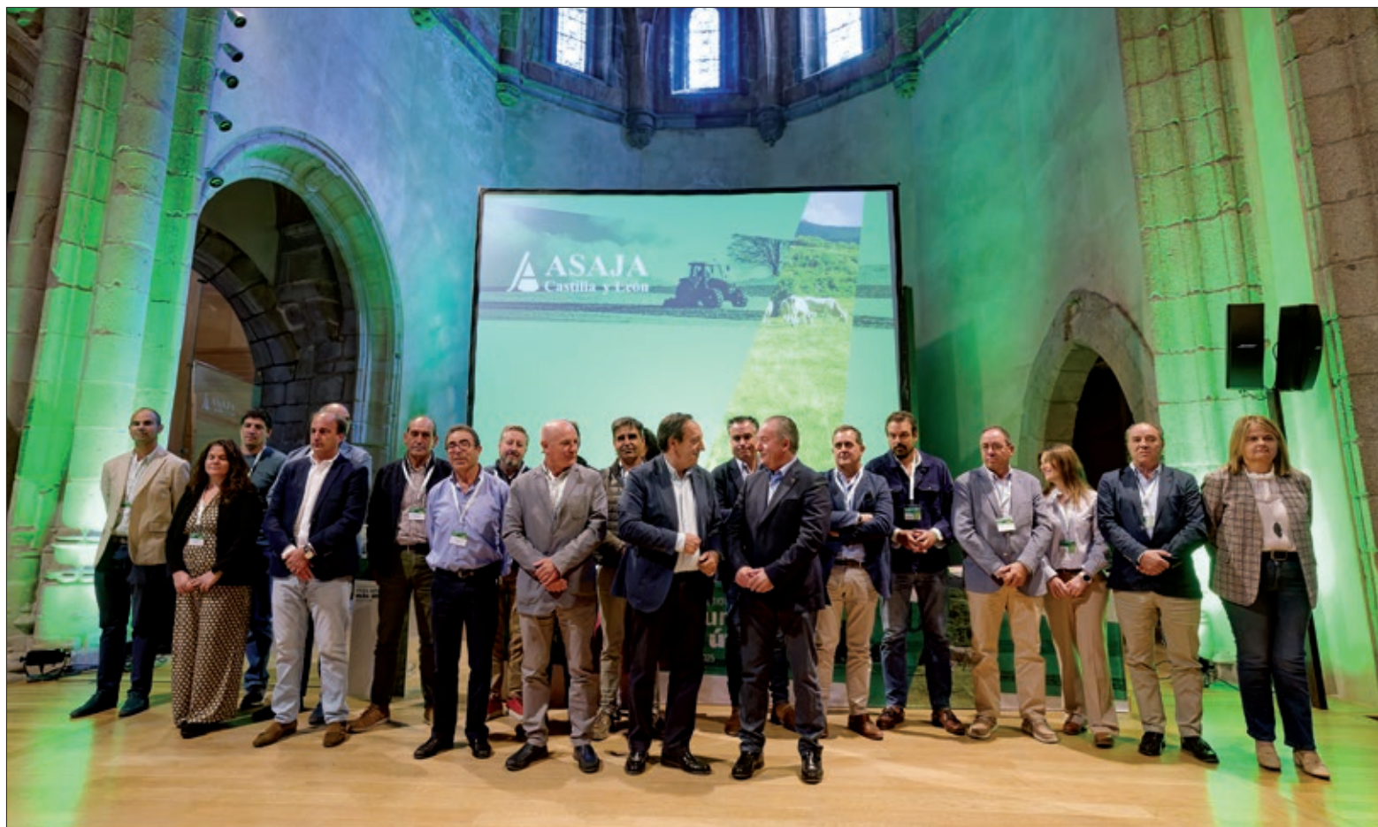
Los miembros de la Junta Directiva que pilotará ASAJA de Castilla y León durante los próximos cuatro años.