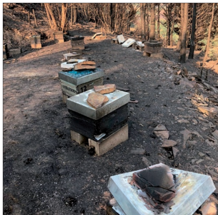
Colmenas calcinadas tras los incendios de este verano, en El Bierzo.

Una vez que se hayan puesto en marcha las ayudas, ASAJA espera de la Junta de Castilla y León y del Estado una profunda reflexión sobre la gestión forestal, en la cual