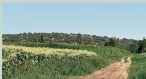
La diferencia entre maíz dulce (amarillo) y maíz verde grano seco (forraje).