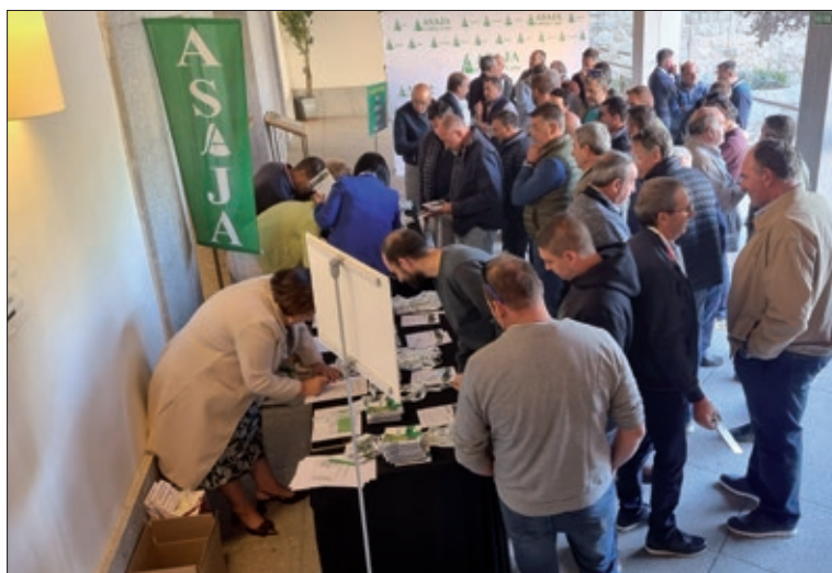
Acreditación de los compromisarios, representantes de las organizaciones provinciales.

vinciales, los servicios técnicos de ASAJA han respondido a la cada vez mayor demanda de servicios por parte de los socios, en aspectos como la formación, información, tramitación de ayudas, asesoramiento fiscal y laboral, seguros agrarios, etcétera. Pero el mayor éxito de la organización y de sus dirigentes ha sido el de mantenerse unida y tener un mensaje claro y coherente con su base, los agricultores y ganaderos. “En cualquier circunstancia, cuando todo cambia, ASAJA permanece y responde”, subraya Donaciano Dujo.