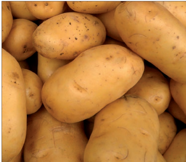
ASAJA denuncia que hay ventas por debajo de coste, algo ilegal.

En nuestra provincia la patata es el principal cultivo de regadío, con una larga tradición en las comarcas de regadío de nuestra provincia; se han sembrado en 2025 en torno a 1.900 hectáreas, lo que hace de la patata uno de los principales cultivos de nuestra provincia. En Castilla y León se han sembrado alrededor de 19.000 hectáreas, siguiendo con la tendencia creciente en superficie de 2023 (16.928 ha) y 2024 (17.290 ha.). Castilla y León aporta alrededor del 40 por ciento de la patata nacional, unas 800.000 toneladas.