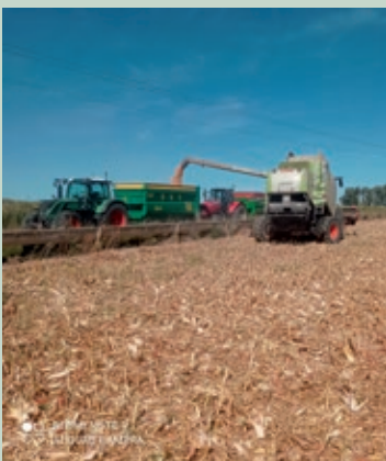
Cosechando maíz.