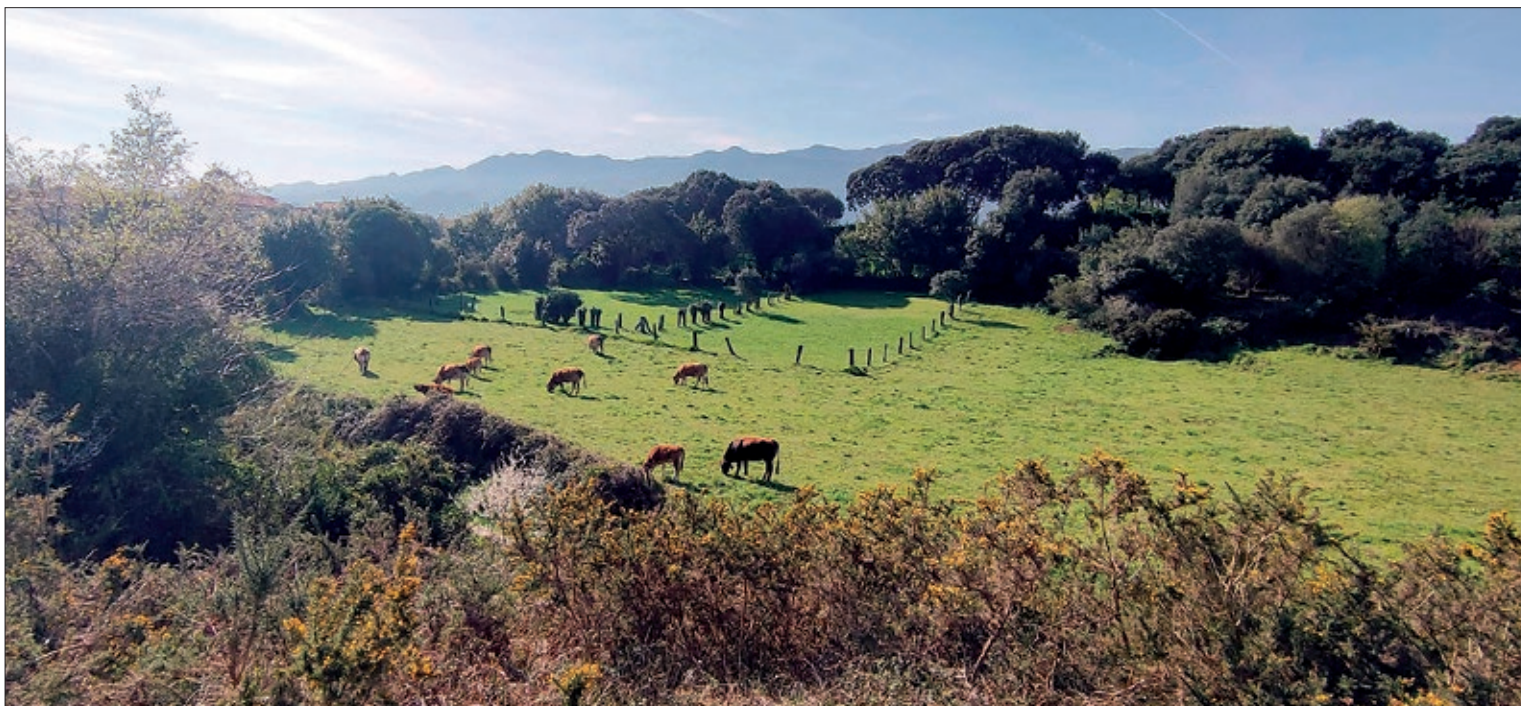
ASAJA había reclamado que los ganaderos particulares pudieran solicitar estas ayudas para sus explotaciones.