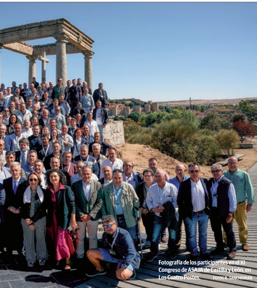
Fotografía de los participantes en el XI Congreso de ASAJA de Castilla y León, en Los Cuatro Postes.