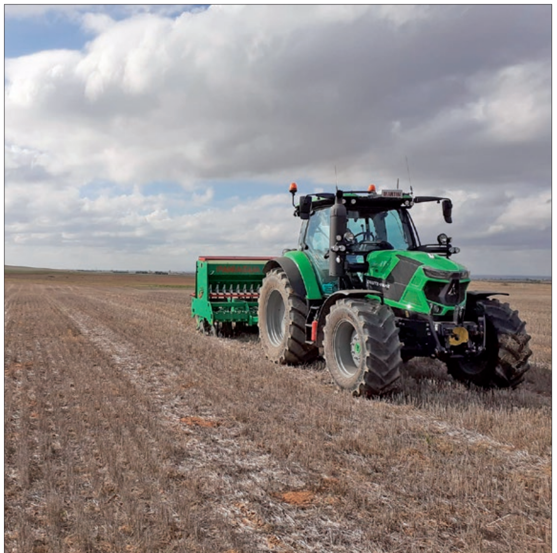
El seguro agrario, una herramienta tan imprescindible como el tractor para el agricultor profesional.