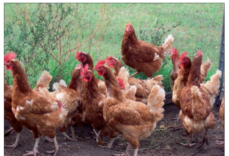
El frío facilita la supervivencia del virus.

Desde julio se han notificado cerca de ciento cuarenta brotes de gripe aviar en granjas avícolas de Europa. En España se han producido catorce focos en explotaciones, la mitad en Castilla y León, concretamente en Valladolid, la mayor productora. Estos focos han obligado al sacrificio de más de dos millones y me-