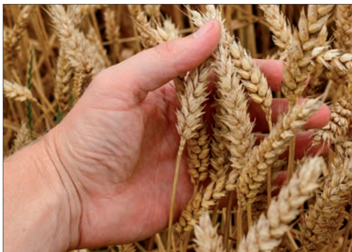
Un informe de la Universidad de Valladolid confirma la cruda realidad.

Para cubrir los costes de producción del trigo habría que vender, dependiendo de la provincia, entre los 185 y los 215 euros la tonelada. En el caso de la cebada, habría que vender, dependiendo también de la provincia, entre 186 y 210 euros la tonelada. El mercado, desde que se inició la campaña en el mes de julio, ha estado por debajo de esas referencias, por lo tanto no se han cubierto los costes