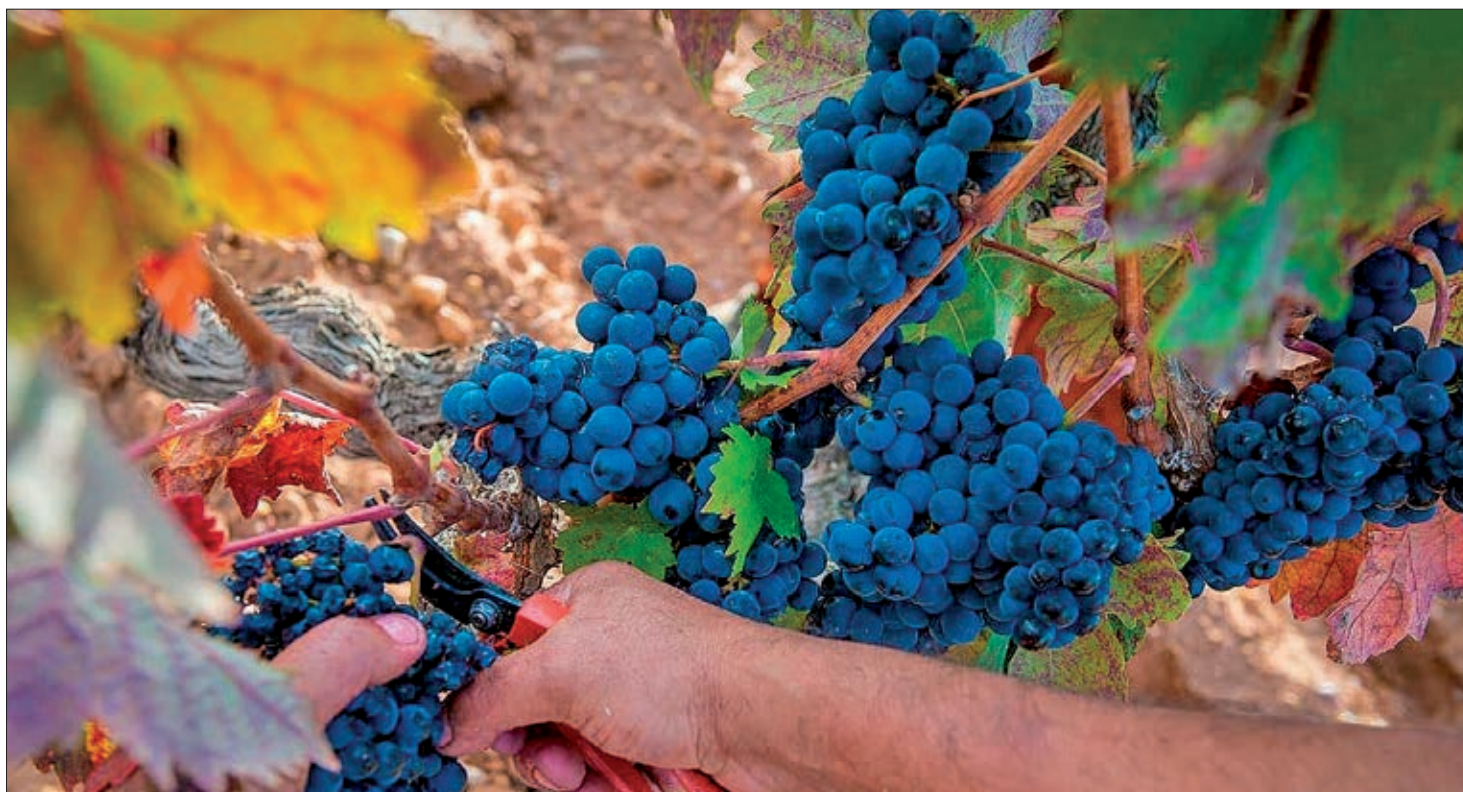
El programa impuesto por la Administración complica el trámite a los viticultores.

El programa de la Junta complica enormemente las declaraciones de uva