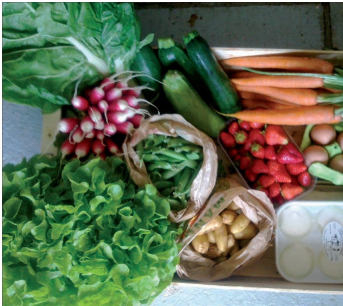
Esta posibilidad de venta ya existe en otras comunidades autónomas y países.

Una vez se apruebe el decreto, que se espera que sea próximamente, la Junta proporcionará a los interesados una guía con las