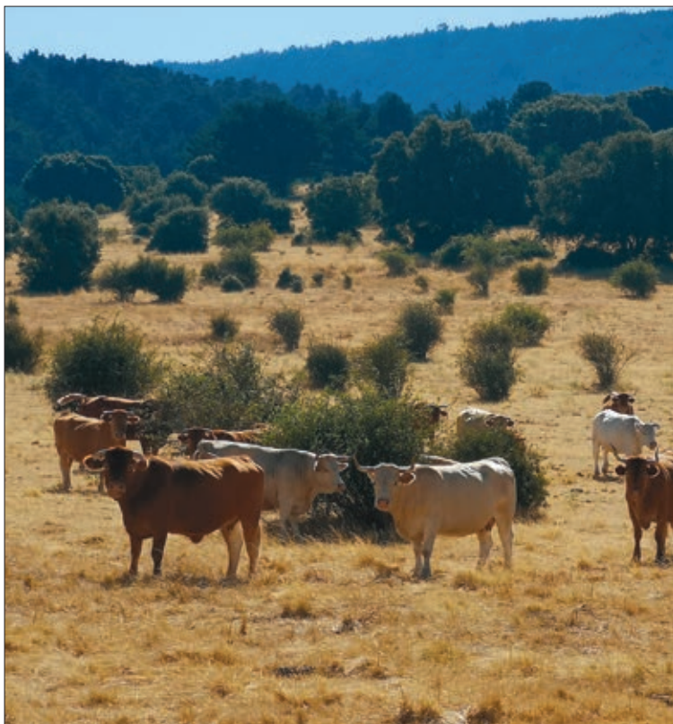
La DNC afecta al ganado bovino.