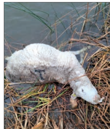
El drama del lobo.

Asimismo, la organización reclama que la Junta de Castilla y León ponga en marcha actuaciones eficaces para frenar estos ataques, que dejan indefensos a los ganaderos y ponen en riesgo la continuidad de sus explotaciones.