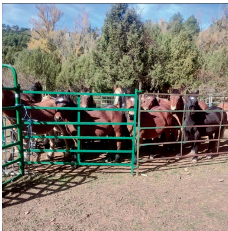
La denuncia de ASAJA-Burgos ha frenado una situación irregular.

Los caballos se han comido un pasto que no les pertenece, en detrimento del ganado que pasta con la correspondiente adjudicación, han mordido a terneros y han creado una serie de perjuicios ante la pasividad y permisividad del Ayuntamiento. Hay que lamentar esta inacción del Concejo que ante los repetidos requerimientos para que actuara en defensa de sus bienes y de los ganaderos que tiene asignados esos pastos, se ha puesto de perfil, perjudicando a sus vecinos y consintiendo unas actuaciones, de todo tipo, ilegales.