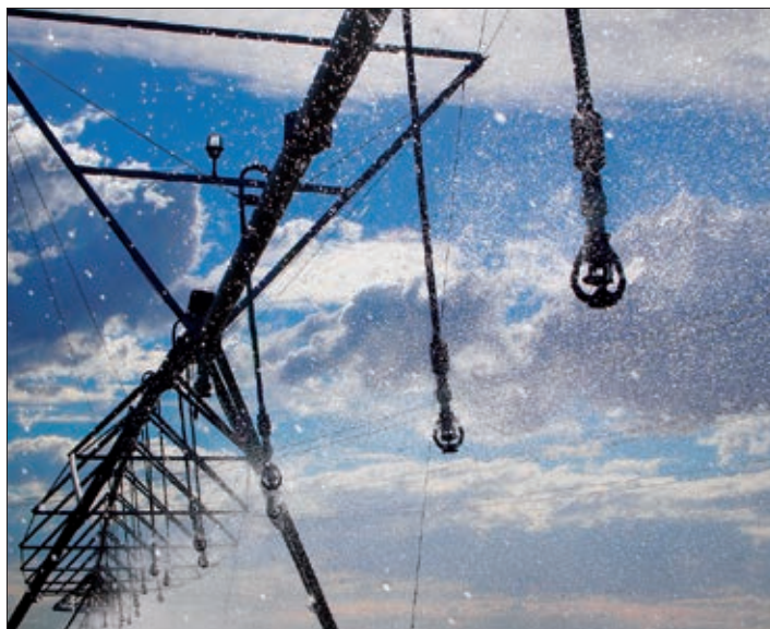
Los márgenes están tan ajustados que incluso obligan a vender a pérdidas.

ASAJA critica que el coste de la energía eléctrica, en cuyo escándalo hay un elevado componente político, ponga sobre las cuerdas a sectores económicos como en este caso