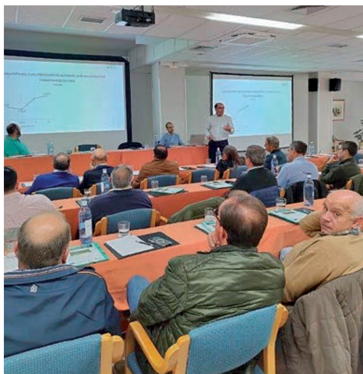
Entre otros temas, se habló sobre la dermatosis nodular contagiosa.

La segunda parte de la jornada se centró en los retos, fortalezas y peligros del sector de vacuno de cebo. Punto principal fueron los temas sanitarios que pueden afectar de forma directa a las exportaciones, talón de Aquiles del sostenimiento económico del sector. Se analizaron también todas técnicas y