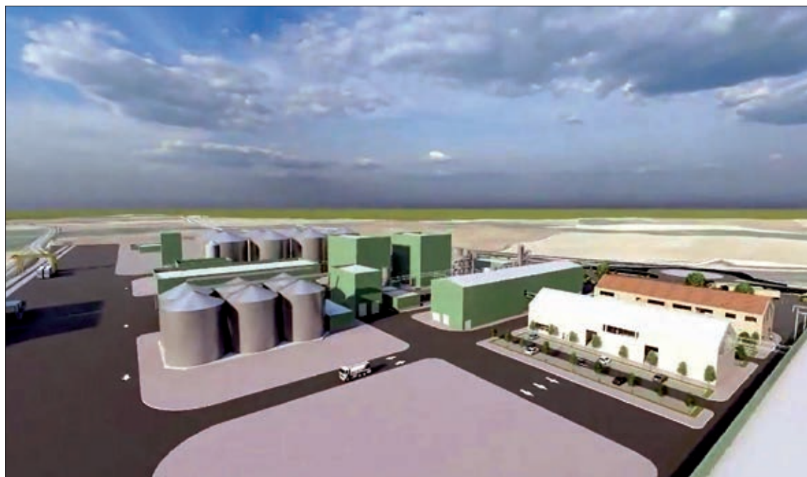
Recreación infográfica del futuro complejo industria IberÓleo.

Esta tercera y última fase permitirá también fabricar harina de torta, además de la obtención del aceite crudo de girasol y colza, dos cultivos con creciente importancia en Palencia. En la pasada campaña (PAC 2025) se sembraron en la provincia unas 46 000 hectá-