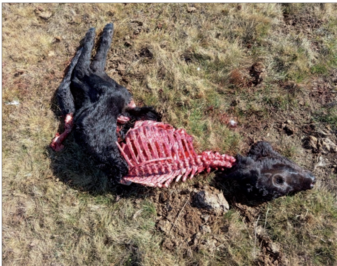
Ávila es la provincia más afectada de toda Castilla y León por los ataques del lobo.

Pero lo más sangrante es la injusticia económica de los baremos de indemnización que aplica la Junta de Castilla y León, que condenan al ganadero a la impotencia, sin poder actuar ni defender su medio de vida frente a unos ataques constantes, mientras carga