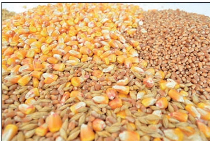
Estas importaciones suponen una competencia desleal.

“El sector agropecuario no puede seguir pagando las consecuencias de un conflicto interminable. No puede ser moneda de cambio constante. Deben buscarse otras alternativas para seguir apoyando al pueblo ucraniano. El campo español y europeo está en una situación límite, y no puede soportar más cargas”, reclaman desde ASAJA Valladolid.