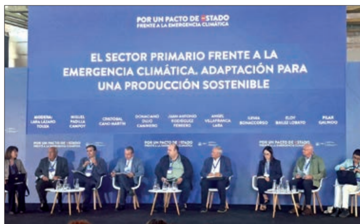
Debate nacional celebrado en Ponferrada.

que protejan y hagan sostenible la producción agrícola y ganadera en un contexto climático cada vez más complejo. ASAJA pide "una verdadera política hidráulica que permita contar con más agua para riego y disponer de una red de regadíos modernizados y eficientes", así como un refuerzo del sistema de Seguros Agrarios, que hoy precisa de una revisión para que cubra los nuevos riesgos.