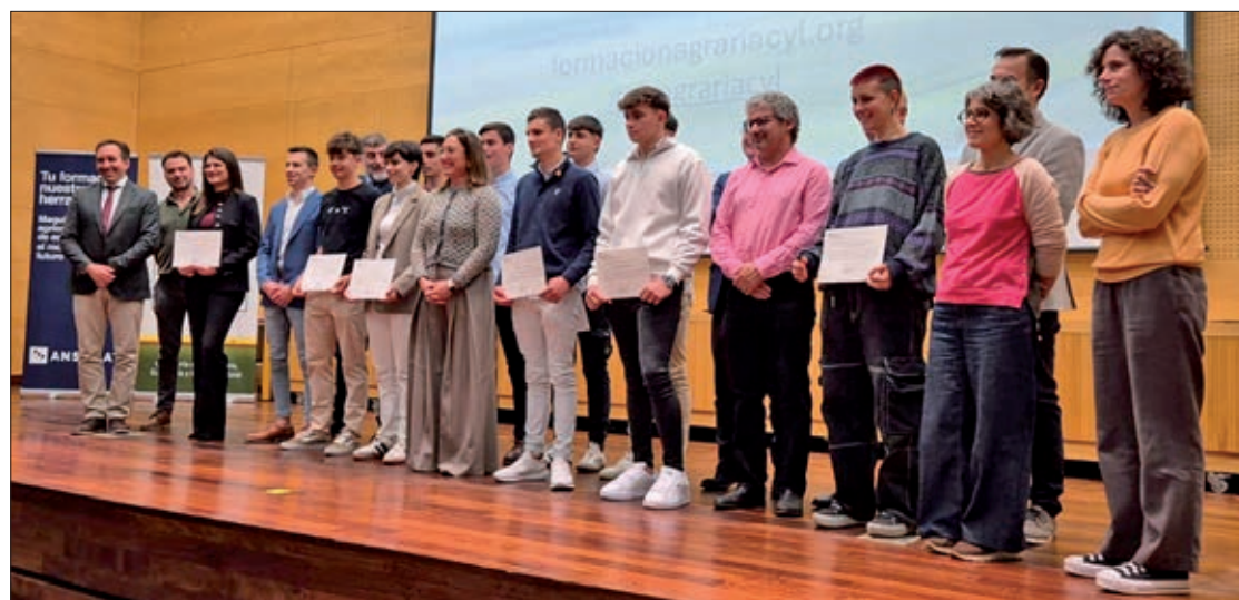
Foto de familia de los premiados y sus tutores, junto a la consejera de Agricultura, Ganadería y Desarrollo Rural.