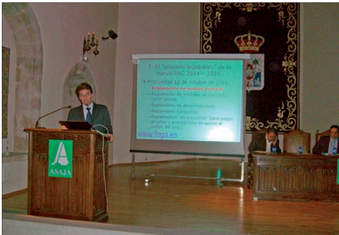
En la asamblea navideña siempre se pueden escuchar ponencias de primer nivel, como ésta de hace 15 años que versó sobre la anterior PAC.

El Premio Espiga, por el contrario, es el que se concede a la persona, empresa, entidad, administración, cargo, campaña, o acto que haya contado con el visto bueno de los socios de la organización profesional agraria y que consideran que merece un reconocimiento público por su contribución positiva al sector. Entre los Premios Espiga más destacados se encuentran los concedidos a las Fuerzas y Cuerpos de Seguridad del Estado; a 'Tierra de Sabor' y 'Saborea Soria', campañas institucionales de promoción y valorización de nuestros productos agroalimentarios, y a la cooperativa soriana Copiso, por su esfuerzo en la creación de empleo y las inversiones para el agro. En algunas ediciones se