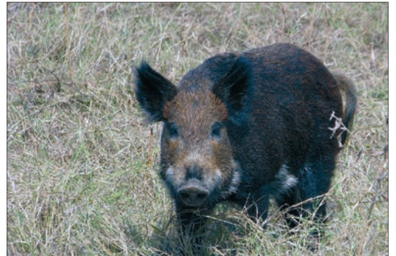
El jabalí es plaga en toda España.

alimentaria, y que es el gran consumidor del cereal, principal producto agrícola en nuestra tierra. Los perjuicios para el sector ganadero no son tanto los derivados de un sacrificio masivo de animales si el virus llega a determinadas explotaciones, como de una hipotética caída de las ventas por limitaciones a la exportación que puedan llegar de terceros países.