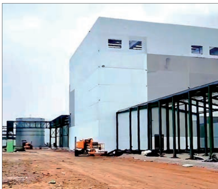
Estado actual de las obras, tras quince meses de trabajos.