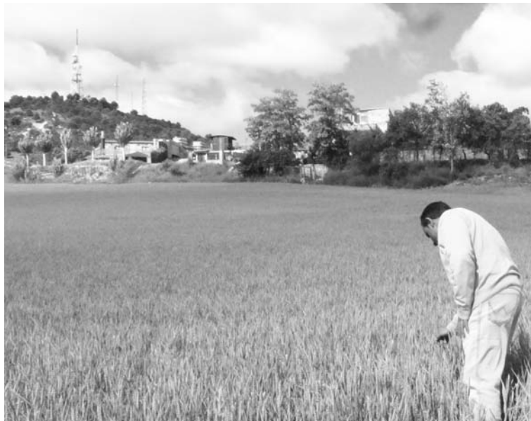
Desde ASAJA PALENCIA se ha advertido de la aparición de la roya no sólo en trigos, sino también en cebadas.-

Aunque el frío del invierno frena el avance de la roya, existe la posibilidad de haya permanecido latente al menos en parte en los campos, y dados los precedentes de rápida dispersión registrada en la campaña anterior, el servicio de plagas aconseja prudencia y pide a los agricultores que estén alerta.