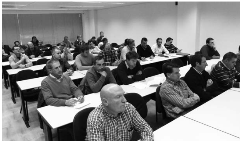
Durante la Junta Provincial de este mes se abordaron diversos asuntos, entre otros, el de las propuestas ante los comicios.-