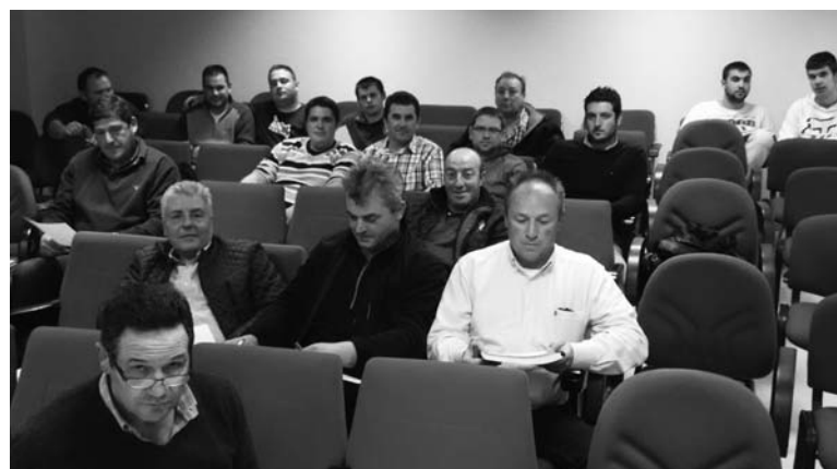
Imágenes de cursos celebrados en Abastas y Saldaña.-