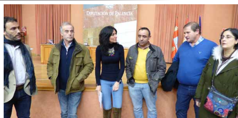
El presidente de Asaja, los responsables de la sectorial de ovino y vacuno de la organización, con la responsable del Consorcio de Residuos, tras la reunión celebrada en la capital.-

De éste proyecto se ha encargado el Itagra sobre la generación de este residuo, que supone un importante problema en la provincia, así como la propuesta que