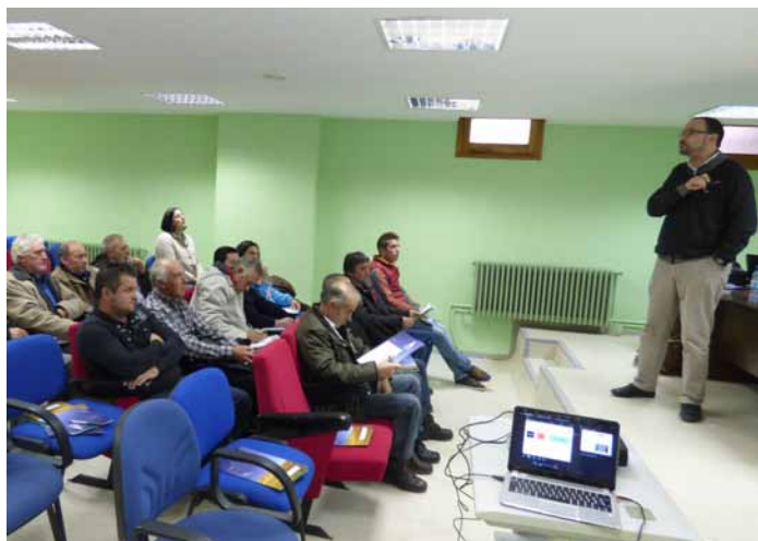
Ganaderos y veterinarios en la jornada de ovino celebrada en Saldaña.-

De esta forma, instaron a los ganaderos a buscar nuevas fórmulas, en lo que a reproducción animal se refiere, para aumentar la rentabilidad de sus granjas, ya que en el sector de la leche no está siendo un año bueno.