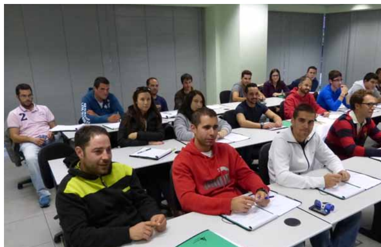
Jóvenes en un curso de incorporación celebrado en Asaja.-

•Tener dieciocho o más años y no más de cuarenta años de edad, en el momento de presentación de la solicitud de ayuda.