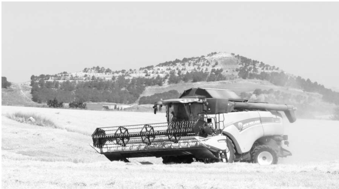
La zona más afectada por la sequía fue Tierra de Campos.-