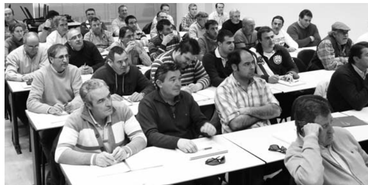
Asistentes a una de las jornadas de actualización del carnet de fitosanitarios.-

En caso de inspección se deberá poder comprobar el cultivo por el que se han solicitado las ayudas asociadas en la PAC 2015.