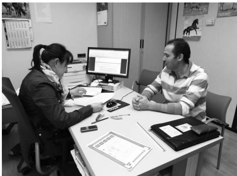
Los técnicos de ASAJA PALENCIA han suplido con gran esfuerzo la improvisación que ha presidido la campaña PAC.-