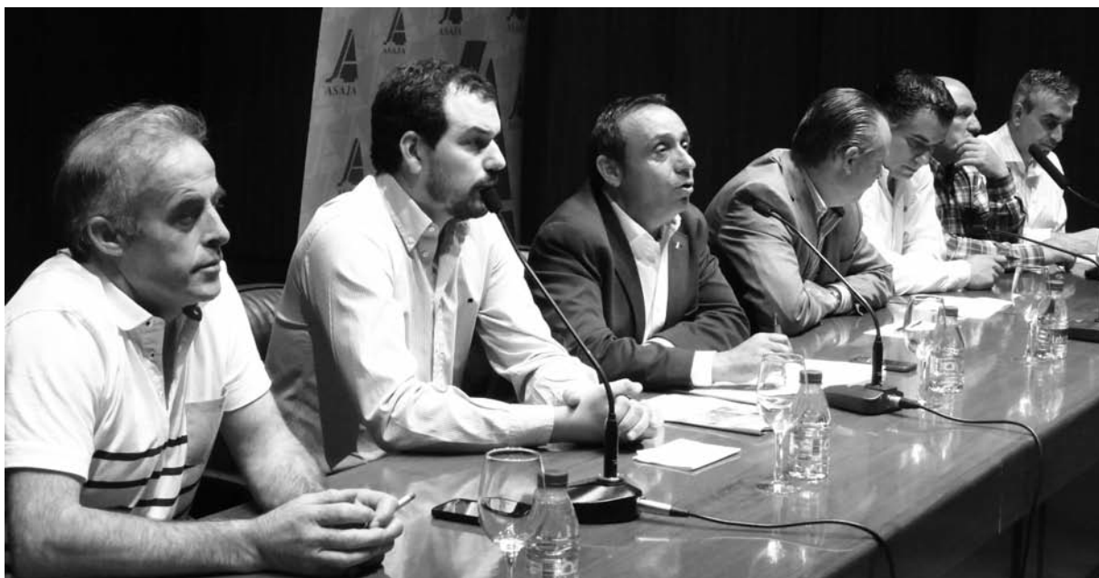
El comité ejecutivo de ASAJA PALENCIA, con el presidente regional de la organización y el gerente provincial.