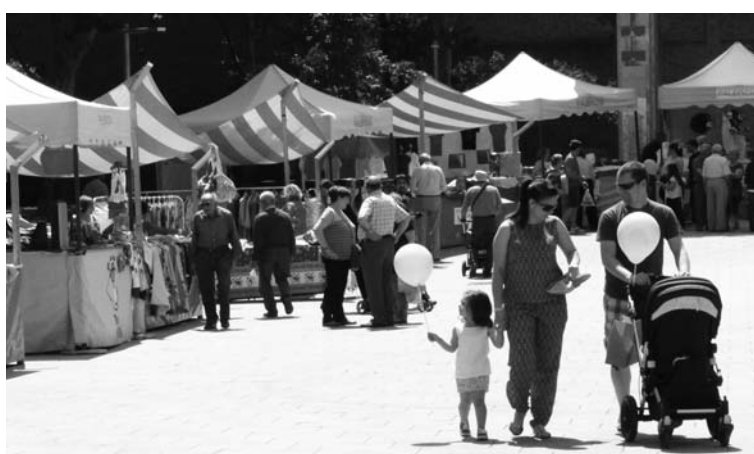
Arriba, inauguración del Mercado de Emprendedores. Debajo, una vista de las casetas que se instalaron en el Salón. Este año el mercado ha contado con la presencia de la ONG FundEO-