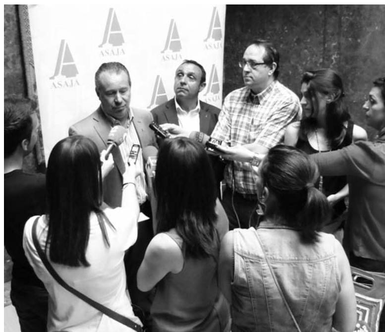
Los presidentes regional y provincial de ASAJA atendieron a los medios de comunicación antes de la asamblea.-

Especial preocupación mostró por las consecuencias que tendrá esta situación en el sector ganadero, “que no tendrá pastos, un alimento natural y que no cuesta, y tendrá que comprar otro que no es natural, del que hay poco y que será caro”.