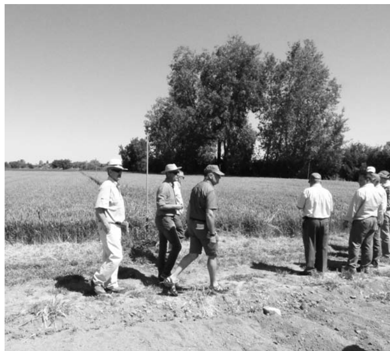
Agricultores observan los campos de ensayo de Viñalta.-