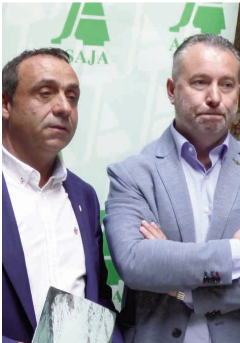
La preocupación por la campaña era evidente en el gesto de los presidentes provincial y regional de Asaja.-

Por último, Meneses destacó la labor de los técnicos de Asaja Palencia durante todo el periodo PAC que acaba de terminar, con cuyo esfuerzo y dedicación ha sido posible completar la tramitación de miles de expedientes, “a pesar de las trabas y complicaciones que se ponen desde la Junta”.