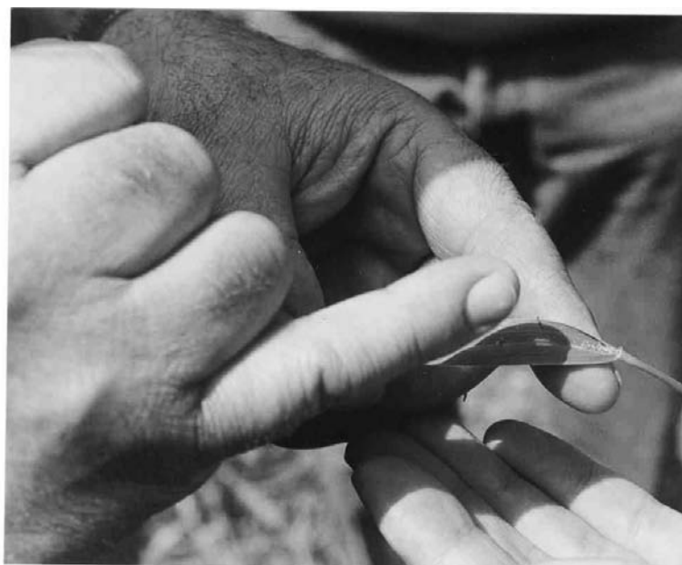
Una planta afectada por nefasia.-

ASAJA ha expresado su preocupación por la persis-