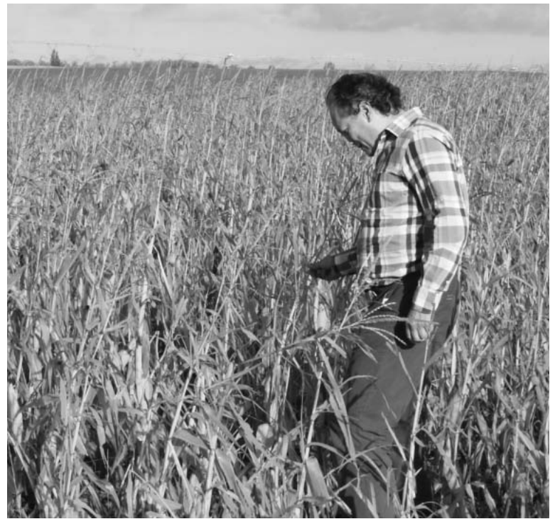
Un técnico de ASAJA revisa daños de pedrisco en maíz.-

ASAJA recuerda que hasta el 15 de junio permanece abierto el plazo de contratación del seguro de cultivos herbáceos (cereal), con coberturas en caso de pedrisco y otras adversidades climáticas, y que también cubre daños por