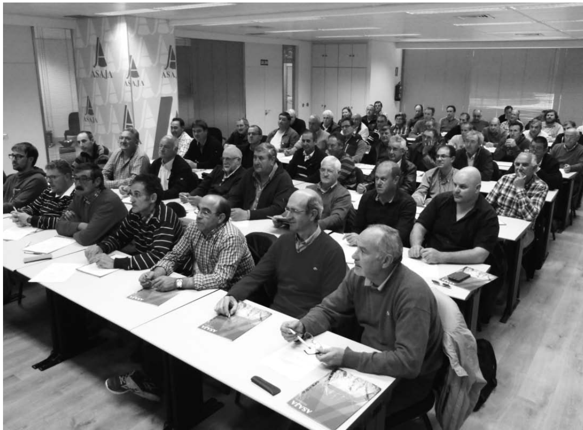
Asistentes a una de las jornadas de actualización del carnet de fitosanitarios.-

Todas las jornadas se desarrollarán en horario de mañana, en el salón de actos de la respectiva oficina de ASAJA. Los interesados están a tiempo de inscribirse en los cursos.