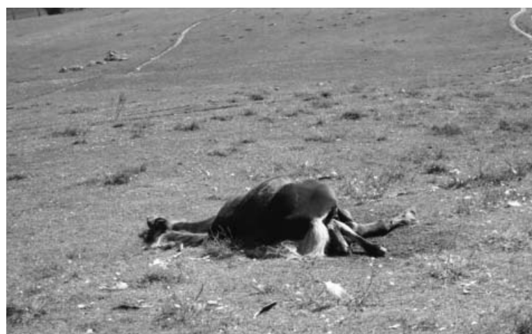
En las imágenes se observan los buitres sobrevolando sobre los caballos, y la yegua atacada.-