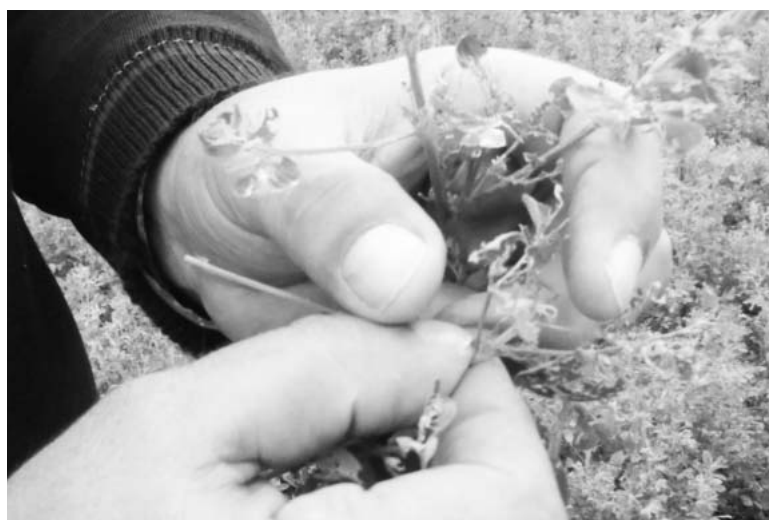
En las parcelas donde ha aparecido el gusano la afección llega al 100 por cien.-