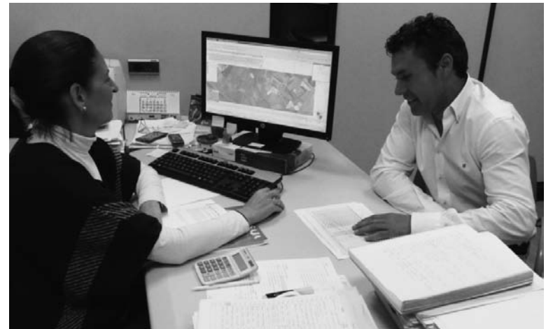
Técnicos de ASAJA PALENCIA en plena campaña de la PAC 2015.-