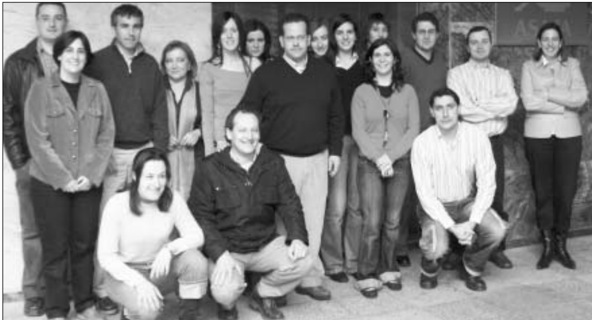
El equipo de ASAJA-PALENCIA dedicado a la PAC, al completo.-