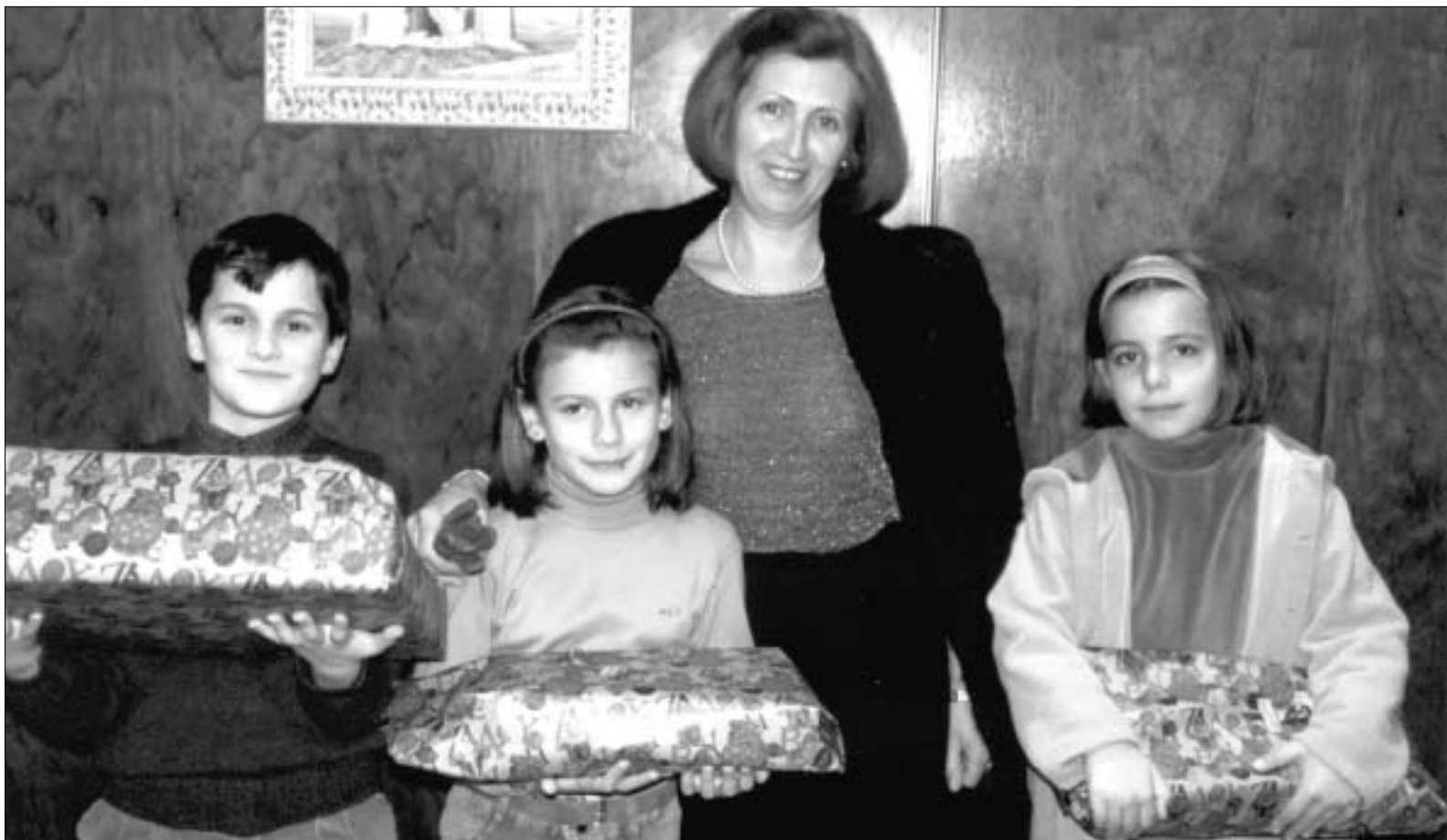
Una imagen conjunta de todos los premiados durante el acto de entrega de regalos, en las oficinas de ASAJA.-