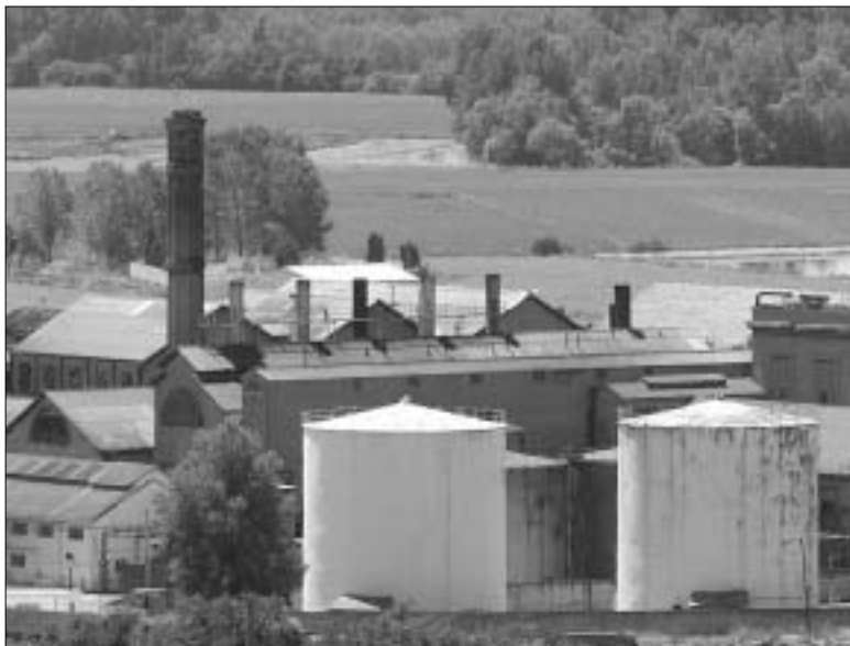
Instalaciones de la azucarera de Monzón