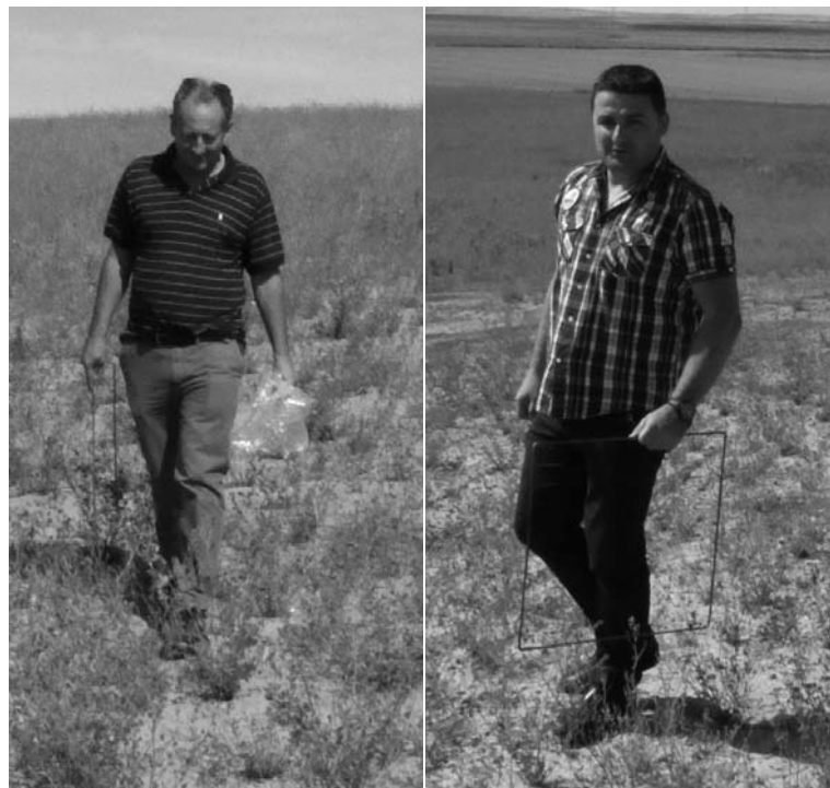
Técnicos de ASAJA PALENCIA valoran los daños de los topillos en la alfalfa.-

Aunque estas medidas se han autorizado ya para todos aquellos municipios que lo soliciten, en un primer momento solo se habían permitido en 24 municipios de Palencia, la provincia con mayor superficie afectada, el 78 por ciento, mientras que en Valladolid, con el 15 por ciento de los daños se autorizaban las quemas en 55 municipios, y 34 en el caso de Zamora, cuando la superficie dañada es del 5,7 por ciento.