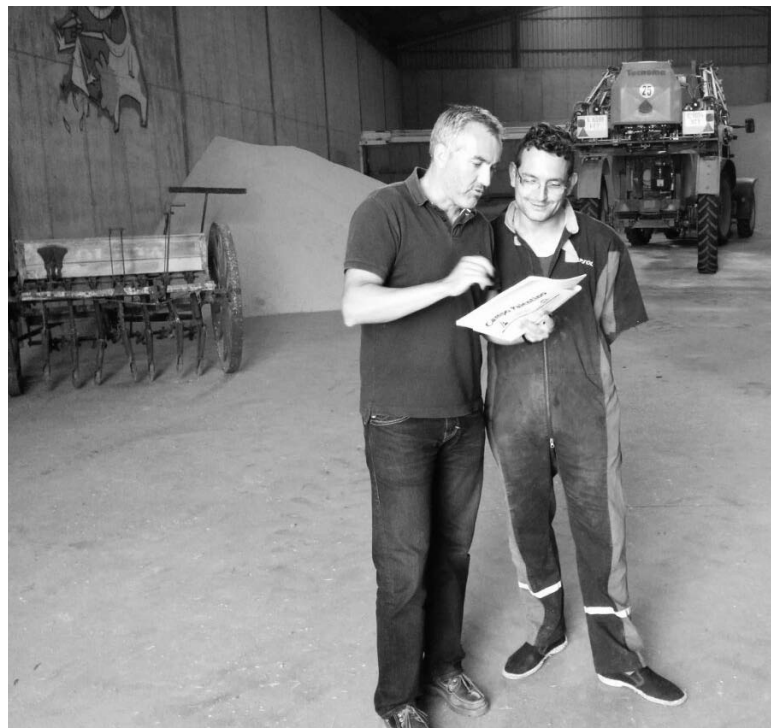
Un técnico de ASAJA aclara algunas cuestiones a un afiliado en el interior de su nave agrícola.-

Los usuarios profesionales de productos fitosanitarios que realicen los tratamientos para terceros como prestación