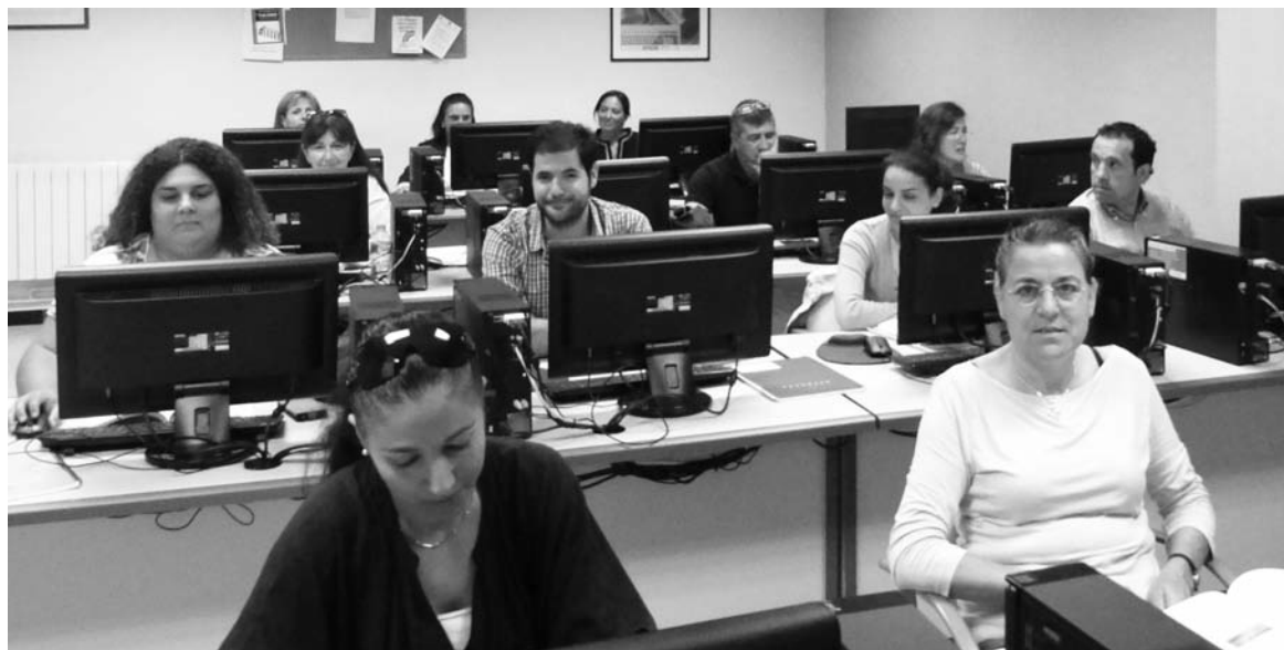
Participantes en el curso de Prevención de Riesgos Laborales celebrado hace solo unos días.-