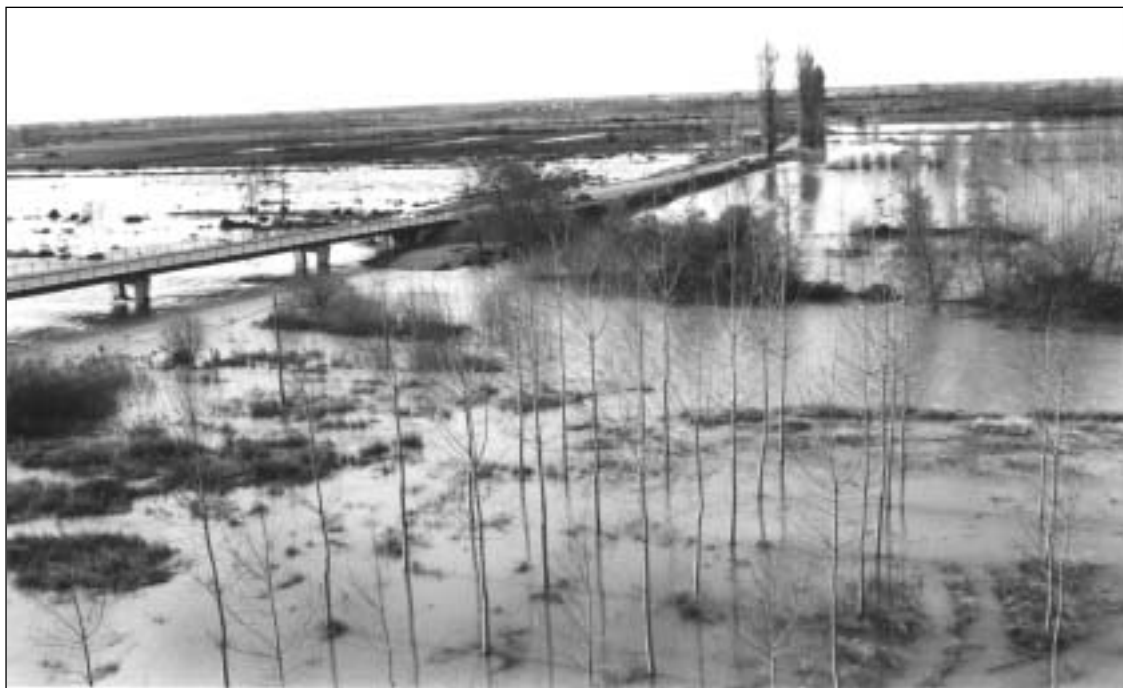
Fincas inundadas en la zona de La Serna.-