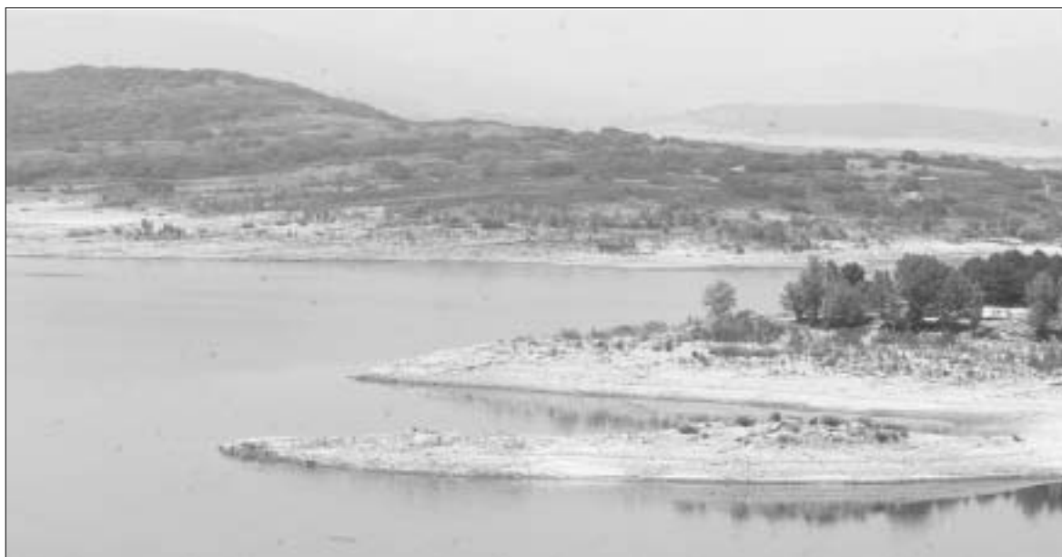
Los embalses de la provincia, como el de Aguilar, se encuentran al 30 por ciento de su capacidad. -

Los seguros para formalizar los préstamos de sequía, también en 06