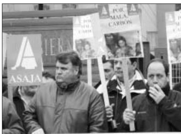
Los Reyes Magos de Palencia-Oriente, sujetan la pancarta junto al presidente de ASAJA-PALENCIA, y el rey Baltasar posa delante del carbón que se "expuso" por el suelo.-