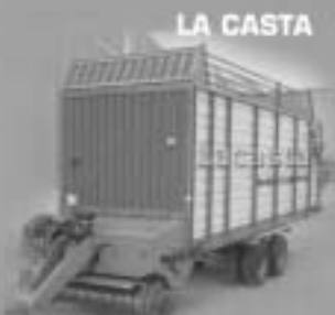
Matriculaciones año 2003: 112 Unidades Matriculaciones Lacasta: 67 Unidades