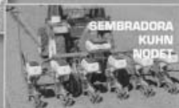
Robustez y precisión a toda prueba