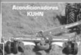
Rendimiento 6 Hectáreas hora