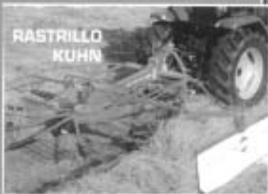
¡El arte de recoger el buen forraje!