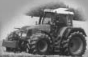
TRACTORES FENDT Recomendado por todos los fabricantes de autocargadores.