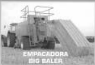
En campaña servicio también los días festivos