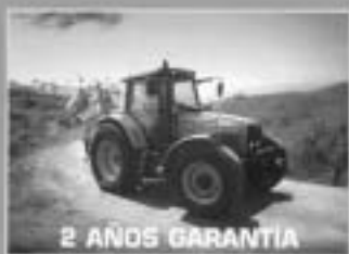
Nueva gama M.F. 7400 Transmisión continua Dyna VT.

CON SERVICIO EN CARRIÓN Y EN PALENCIA ¡Consulte al profesional del sector alfarero!