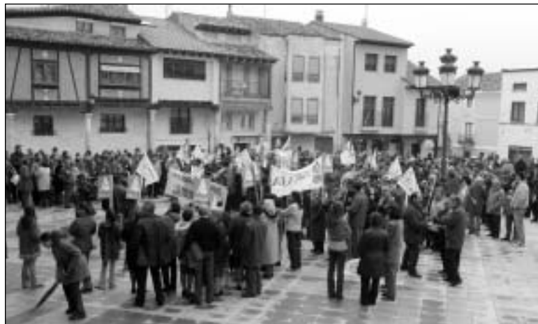
Manifestación en favor de la central de biomasa en Baltanás.-