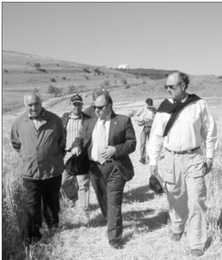
El presidente de la Diputación (centro) y el titular de la Cámara Agraria (dcha.) durante una visita a los campos de ensayo.-

Los abrevaderos, los muelles de carga de maquinaria, la compra de rodillos o de placas solares para básculas son otros