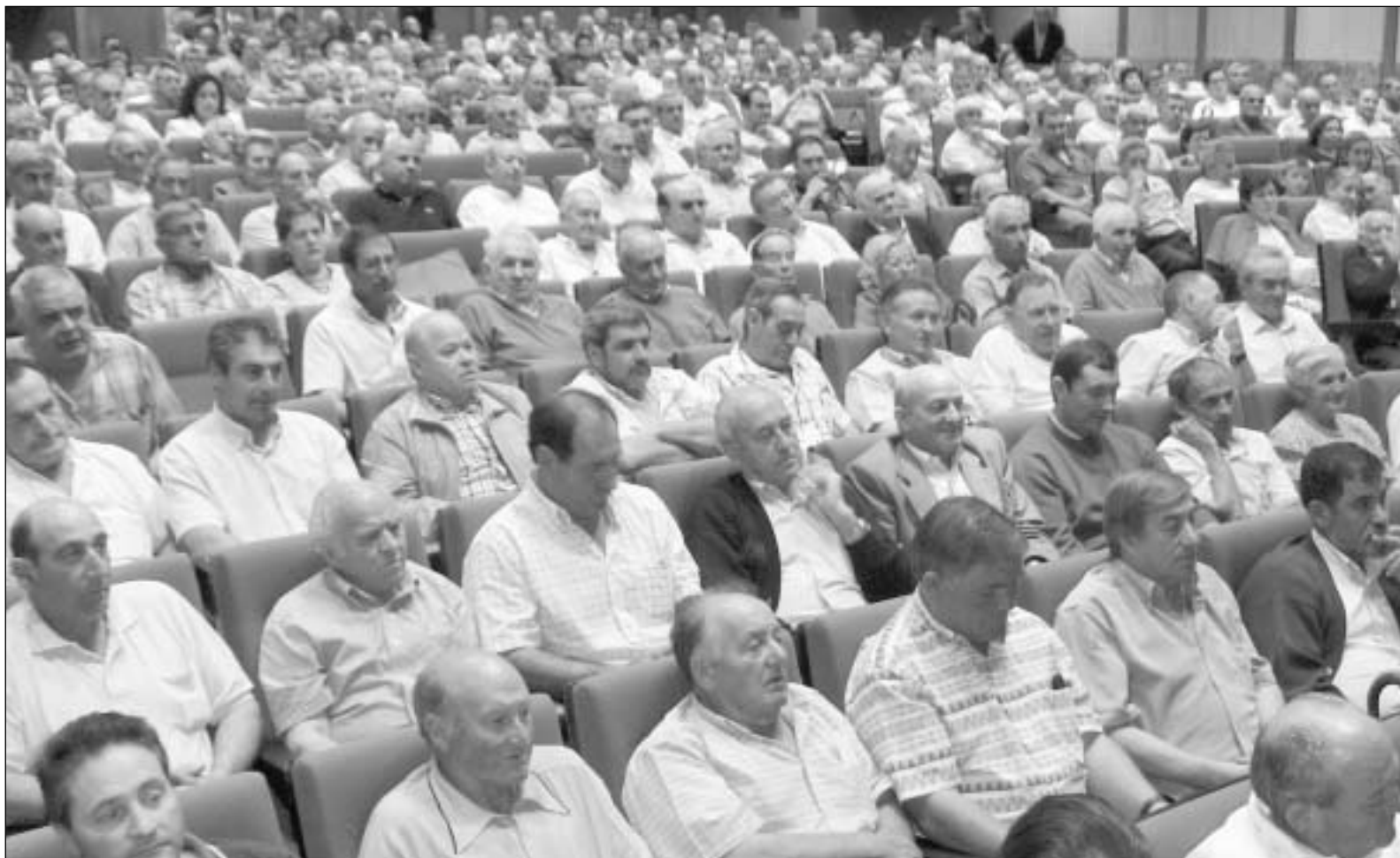
El auditorio de Caja España registró un lleno absoluto en la asamblea general de ASAJA.-