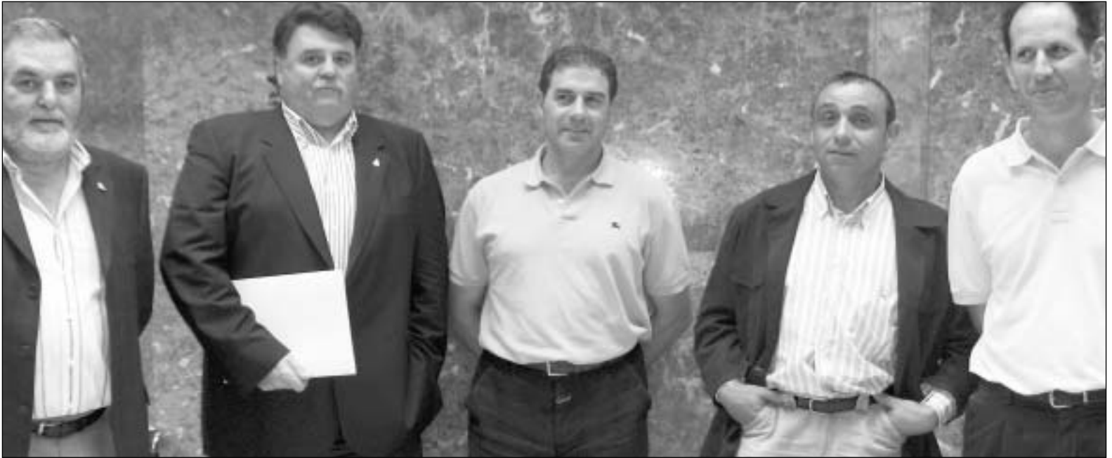
La nueva directiva de ASAJA-PALENCIA, cuyos miembros aparecen en la imagen, fue ratificada durante la asamblea.-