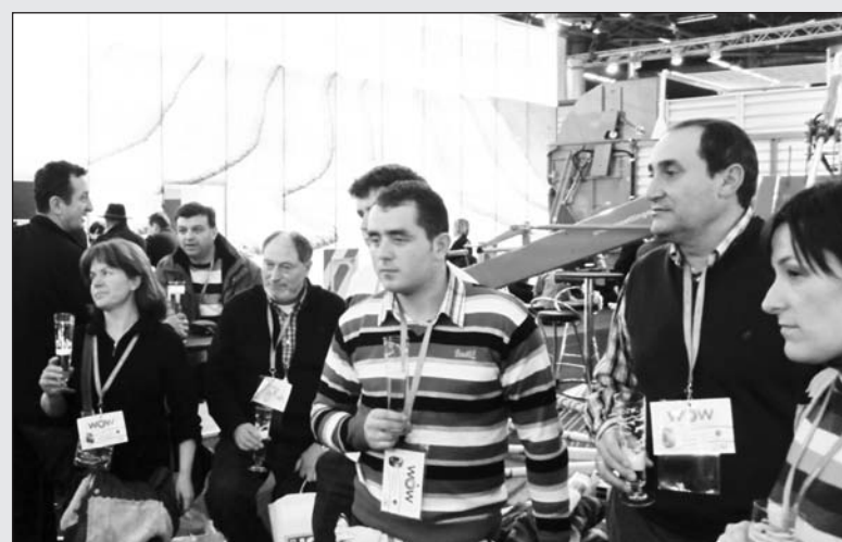
Participantes en el viaje a París. Arriba, en el paseo en barco por el Sena. Debajo, en la feria de maquinaria.-