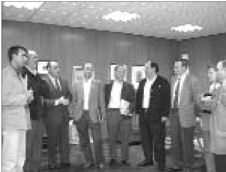
Un momento de la reunión entre ASAJA y la Junta