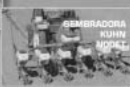
SEMBRADORA KUHN MODET