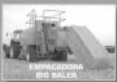
ENRIQUECIDA En cualquier servicio también los días festivos