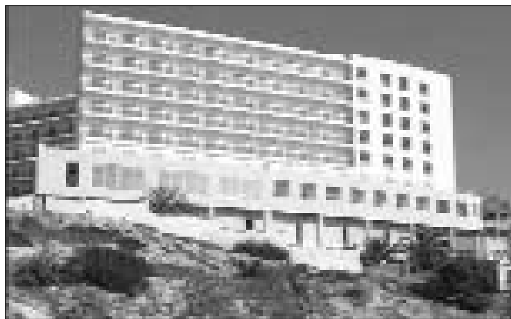
El hotel de Calpe pertenece a la misma cadena que el de Cullera