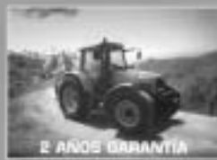
2 AÑOS GARANTÍA Nuevo gama N.F. 7400 Transmisión continua Dyna VT.

¡Consulte al profesional del sector alfalfero!