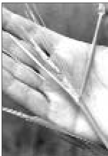
Una espiga afectada por nefasia.-

Por su parte, el presidente de la Cámara Agraria Provincial expuso una cuarta petición que ha tenido una buena acogida por parte de los representantes de la Junta. Se trata de la creación de grupos de trabajo para efectuar tratamientos de preemergencia en las zonas donde hiberna la mariposa causante de la plaga. Con el fin de controlar la plaga de una forma efectiva, se realizaría una experiencia en una zona delimitada de la comarca afectada para comprobar los resultados después y, si son buenos, trasladar la experiencia al resto del territorio afectado.