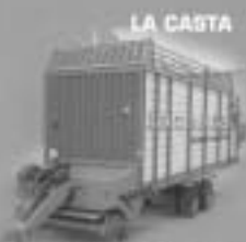
AUTOCARGADORES Matriculaciones año 2003: 112 Unidades Matriculaciones Licencia: 67 Unidades