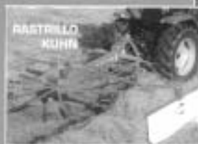
RASTRILLO KUHN (El arte de recoger el buen trabajo)