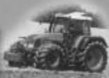
TRACTORES FENDT Recomendado por todos los fabricantes de autocargadores