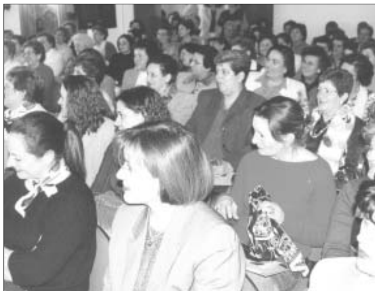
La jornada contará con el vicepresidente de AGE.

también fomentar el autoempleo y acercar formación y empleo a todas las mujeres que se acerquen hasta Guardo.