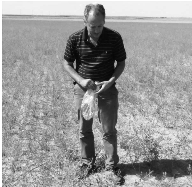
Un técnico de ASAJA PALENCIA observa los daños de los topillos en la alfalfa.-

El seguro es una garantía básica para asegurar las rentas del agricultor.