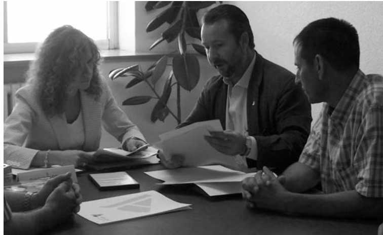
En 2007 ASAJA ya presentó una queja por los topillos ante el Procurador del Común.-