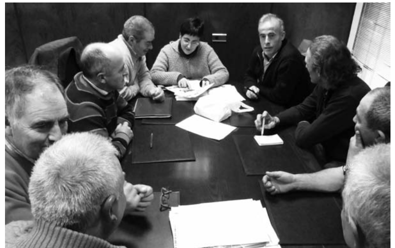
Reunión de la sectorial de ovino celebrada la semana pasada. -