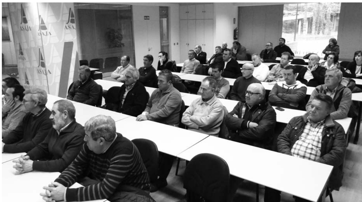
Asistentes a la reunión convocada por ASAJA PALENCIA para abordar la reclamación de los daños. Debajo, la asesora jurídica de ASAJA explicó el proceso a los afectados.-

Los conejos, principalmente, pero también jabalíes y venados provocan la mayor parte de los daños