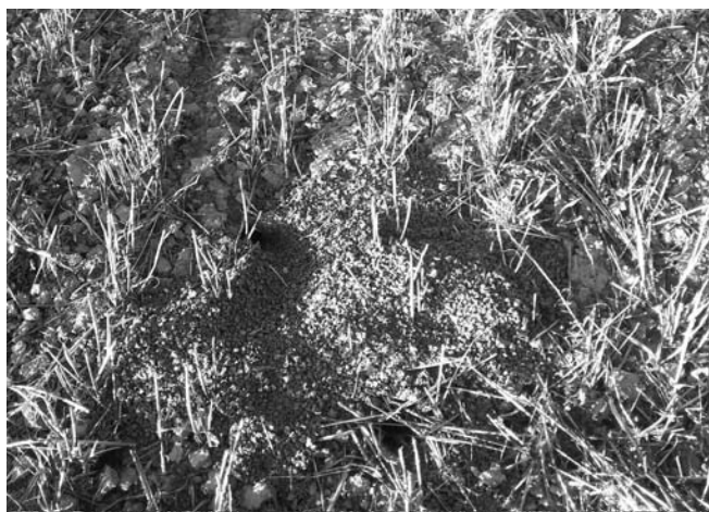
Las vezas son uno de los cultivos más dañados actualmente por la plaga de topillos.-