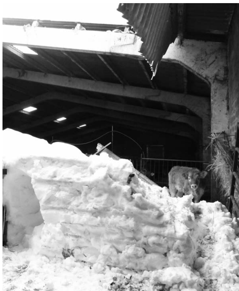
Un ternero en la nave que cedió por la nieve acumulada en el tejado en La Pernía.-

Baste decir que una semana después del temporal, han comenzado a aparecer vacas y caballos muertos en la zona norte por falta de alimento como consecuencia de la nieve.