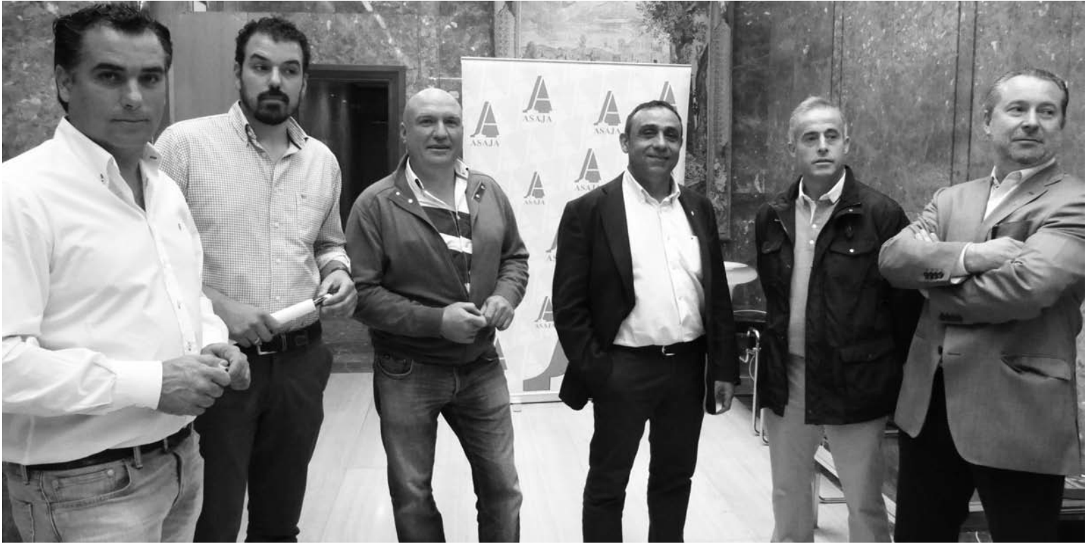
El comité ejecutivo de ASAJA PALENCIA con el presidente regional de la organización.-