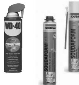
ESPUMA POLIURETANO PISTOLA / CANULA SOUDAL 750 ML.