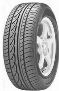
NEUMÁTICO 205/55 R16 91V PIRELLI