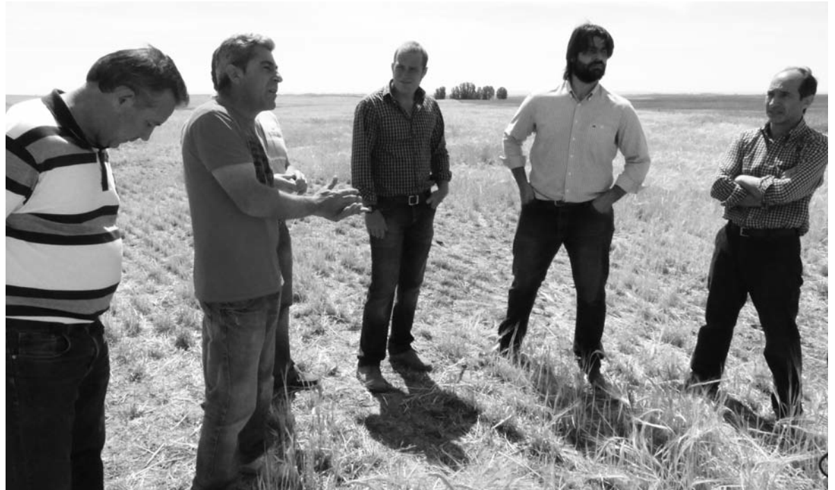
Agricultores y miembros de la JAL de Villaramiel denuncian la situación en que se encuentran los campos por la plaga de topillos.-

ASAJA PALENCIA, que recibe a diario declaraciones de siniestro por daños de topillos, aclara que estos datos no son más que la punta del iceberg, ya