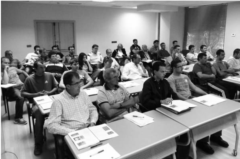
Curso se manipulador de fitosanitarios que se celebra en ASAJA PALENCIA.-