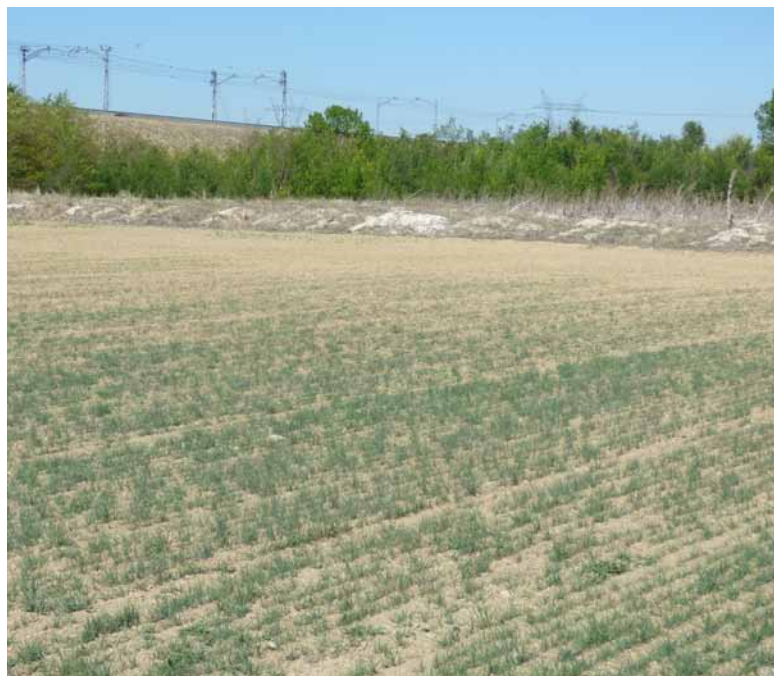
El cereal presenta este aspecto.-

Además, una gran parte de trigos, vezas y otras forrajeras presentan daños irreversibles, con un gran número de hectáreas con una merma de cosecha muy significativa, y en otras hectáreas con reducción de cosecha por debajo de la media de los últimos diez años.