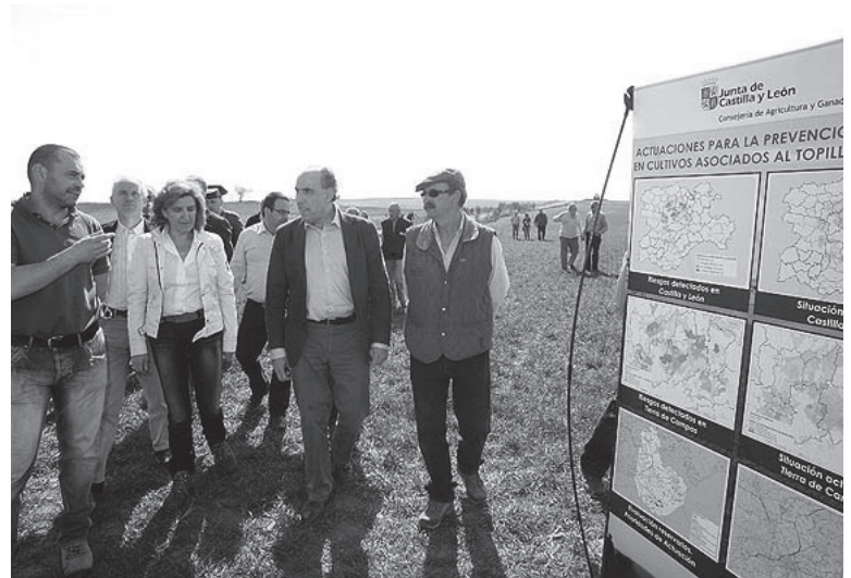
Visita de la viceconsejera a Villadiezma para comprobar las actuaciones llevadas a cabo frente al topillo, el año pasado.

Y es que la organización agraria considera que para controlar estas poblaciones sería conveniente efectuar quemas controladas que eliminaran los excesos de maleza en los límites de las parcelas, así como mantener limpios los cauces fluviales.