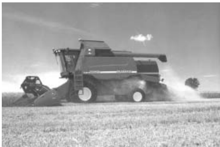
Cosechadora de cereal 9640

Pre-limpiador. La limpieza comienza con el paso de aire a alta velocidad por el pre-limpiador, que separa el tamo y los residuos de la parte inferior de la capa de grano. En el pre-limpiador se elimina un 25% del tamo. Cerca de un tercio del grano es aspirado durante esta fase, cayendo directamente sobre el sílfido de grano limpio, y reduciendo el volumen de grano y pajas que pasa a la caja de cribas. Resulta sumamente eficaz.