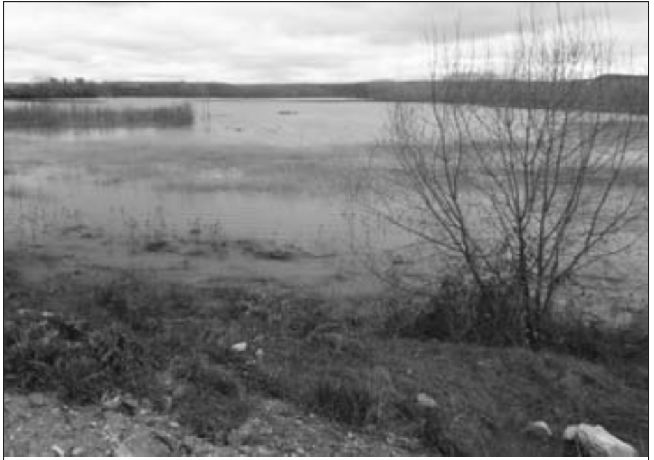
Este aspecto presentaba el Pisuerga a su paso por Soto de Cerrato.-

La cara positiva de las lluvias es la garantía de las reservas de agua en los pantanos para la campaña de riego, todo lo contrario de lo que sucedía en la pasada campaña.