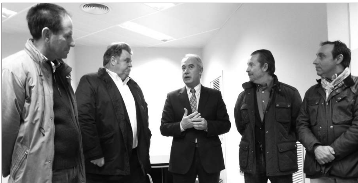
En la imagen superior, exterior de la oficina en la calle Marcelino Arana. Sobre estas líneas, la bendición de los locales y los dirigentes de ASAJA con el alcalde de Herrera.-