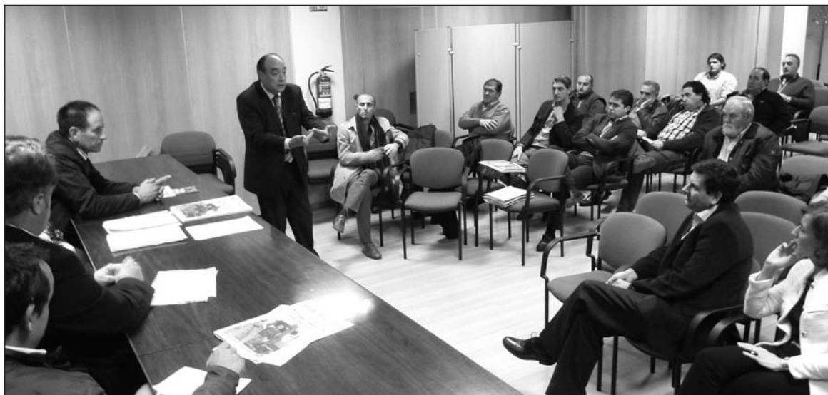
Reunión de dirigentes de ASAJA con los procuradores regionales en las Cortes y representantes de empresas de maquinaria. -

La decisión de la Consejería de Agricultura pone freno a la