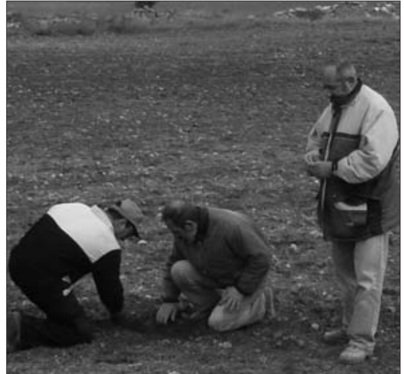
Agricultores observan los daños provocados por los jabalíes.-

Después de mucho tiempo sin soluciones, el Ayuntamiento por fin ha autorizado las cacerías en el Monte el Viejo que permiti-