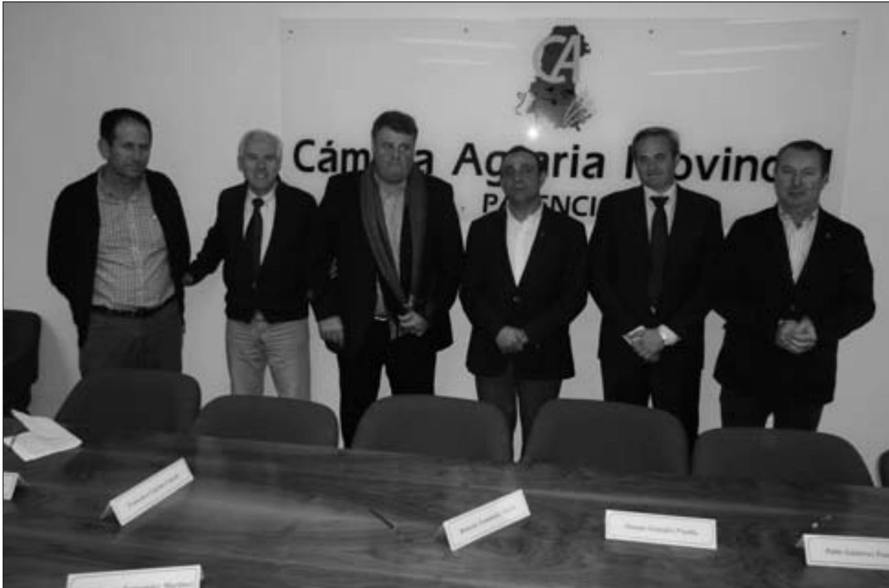
El presidente de la Cámara Agraria, en el centro, con el número 2 y 3 y el delegado territorial y el jefe de Servicio de Agricultura.-

Tras ganar ASAJA las elecciones por mayoría absoluta