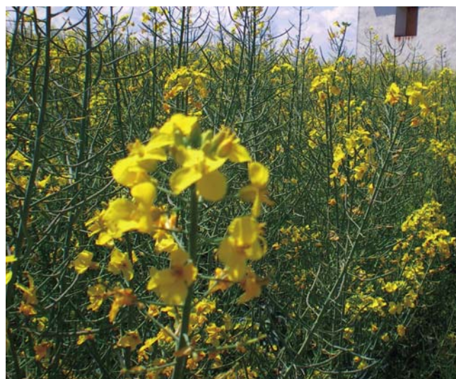
Plantación de colza.

tivos de invierno y primavera aunque pertenezcan al mismo género, como por ejemplo los cereales de invierno y de primavera. Sin embargo, el trigo duro y el trigo blando pertenecen al mismo género.