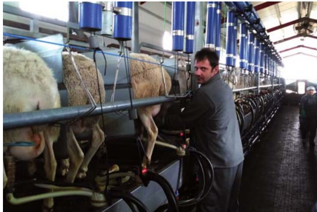
Imagen de una granja de ovino de leche de nuestra provincia.

Castilla y León lidera la producción nacional de leche de oveja, con un 70 por ciento del total. También lidera el censo, con más de tres millones de cabezas, de las