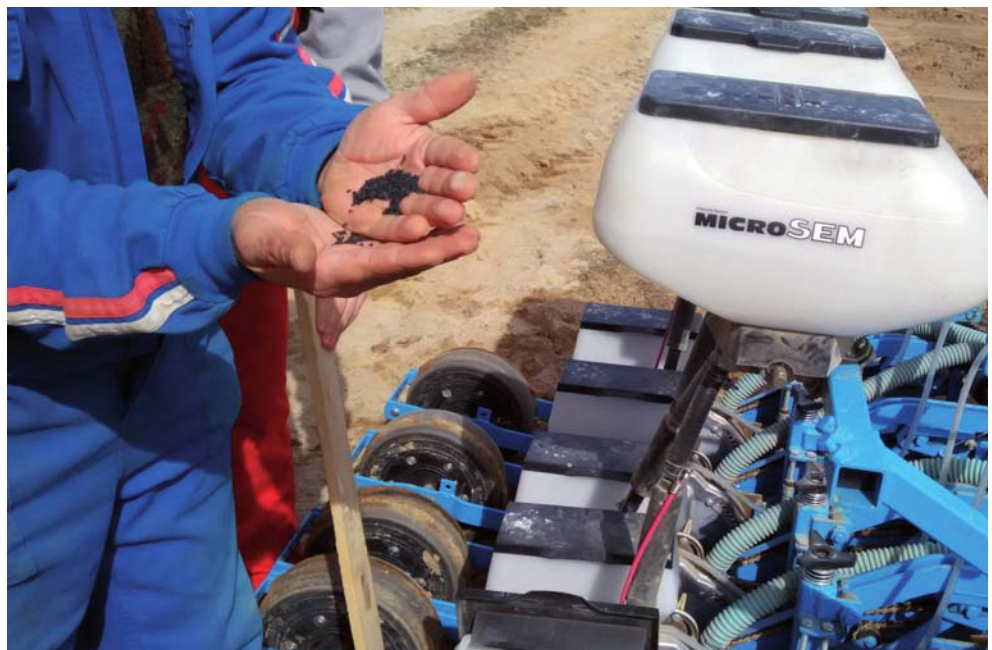
Sembradora dispuesta para el trabajo en una parcela de Collado de Contreras.

De hecho, el embalse de Las Cogotas se encuentra al 46,8 por ciento de su capacidad de almacenamiento, que en total suma 59 hectómetros cúbicos. Así, a finales de abril contaba con 27,6 hectómetros cúbicos de agua embalsados, frente