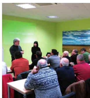
Uno de los cursos de ASAJA.

La ausencia del mismo conlleva importantes sanciones económicas. ¡No te la juegues!