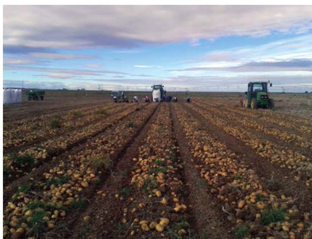
Una de las explotaciones patateras en La Moraña.

Con estas labores bien realizadas se asegura el correcto drenaje durante todo el ciclo del cultivo. Igualmente influye un correcto abo-