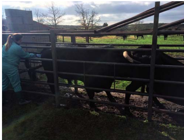
Veterinaria realizando el saneamiento ganadero.

En caso de que los animales se incorporen a explotaciones situa-