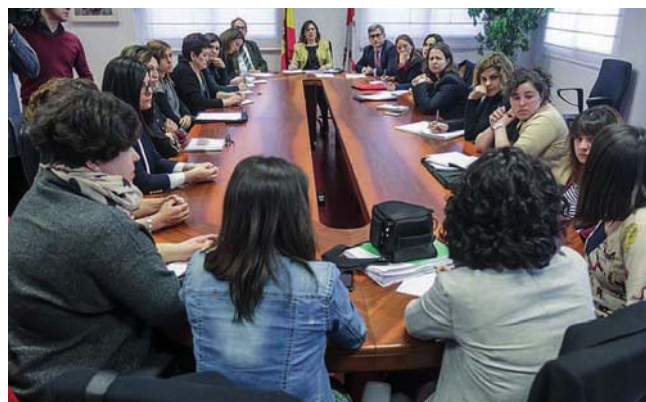
Grupo de trabajo por la incorporación de la mujer, en Burgos.

De las 592.000 mujeres que viven en el medio rural, solamente 12.000 están incorporadas al sector agrario. La Junta apuesta por la incorporación de la mujer para evitar la despoblación de los pueblos,