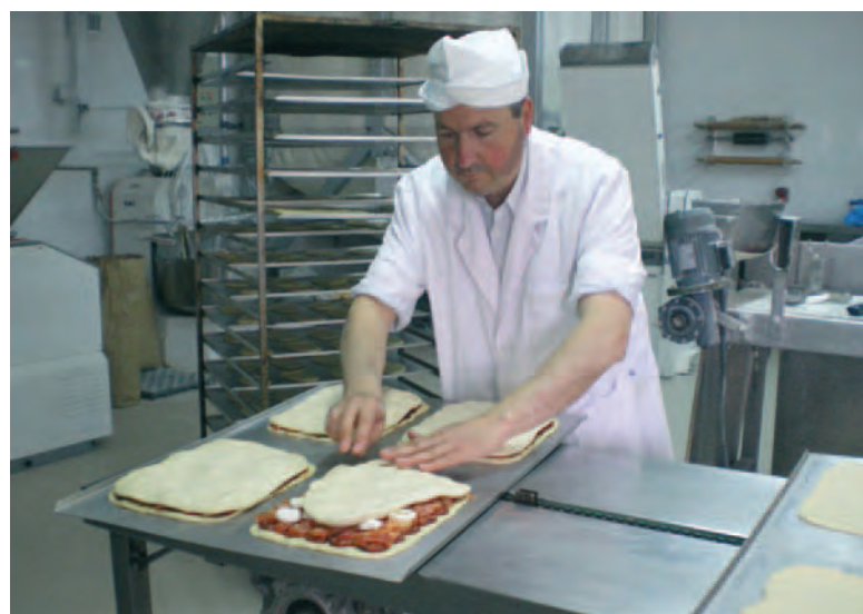
El propietario de una fábrica de hornazos en Muñogalindo.

Para más información y presentación de solicitudes, consulta en cualquiera de las oficinas de ASAJA, repartidas por toda la provincia abulense.