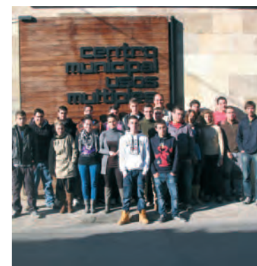
Curso impartido en Candeleda.