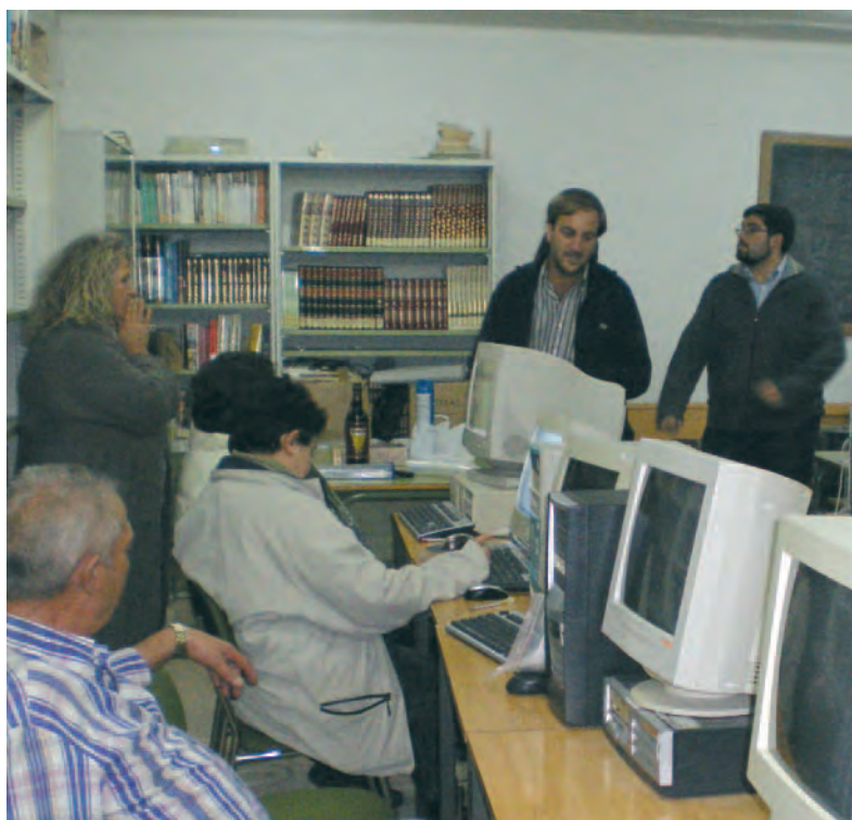
Uno de los cursos de informática, impartido en Padiernos.

Todas las actividades tienen una duración de 25 horas lectivas y el alumnado dispone de dos meses de plazo para realizarlos, contando con profesores y tutores online que atienden las dudas y realizan un seguimiento del alumnado.