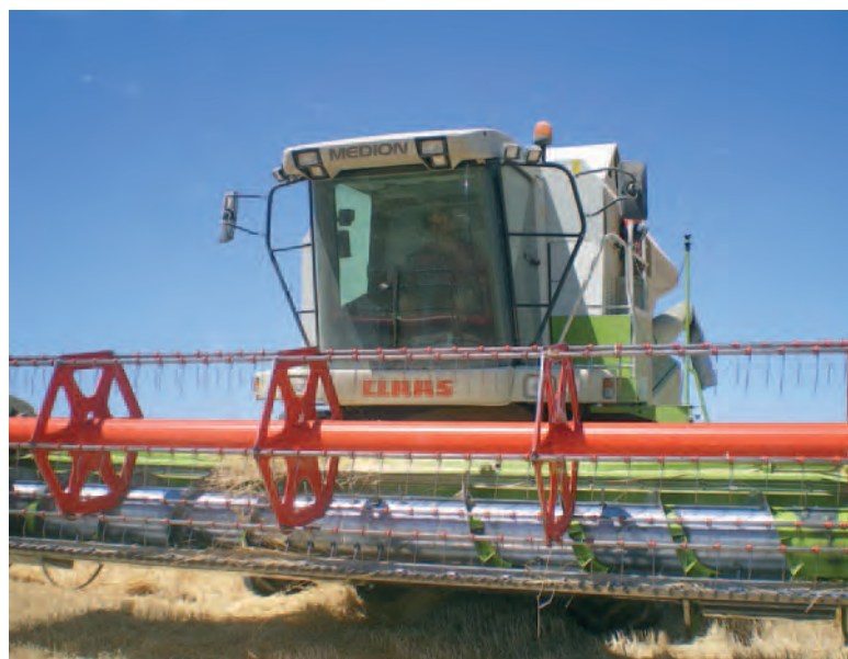
Una cosechadora en los campos de la Moraña.

Más información en cualquiera de las oficinas de ASAJA en Ávila.