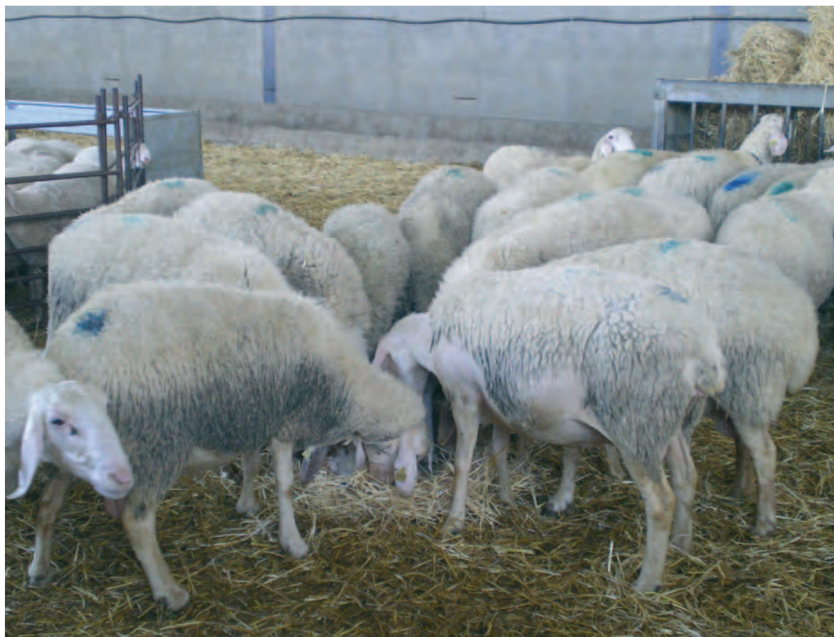
Explotación de ovino de la provincia.

Si bien la evolución epidemiológica de la enfermedad se considera favorable, se ha detectado la circulación viral del serotipo 1 en zonas geográficas muy delimitada en el norte de la Comunidad Autónoma de Extremadura. Por ello, se ha considerado necesario volver a establecer la vacunación obligatoria frente al serotipo 1 en aquellas áreas de mayor riesgo en las que se ha demostrado la circulación del virus en los dos últimos años con objeto de avanzar hacia la erradicación final de la enfermedad. Así, se vuelve a establecer la vacunación obligatoria