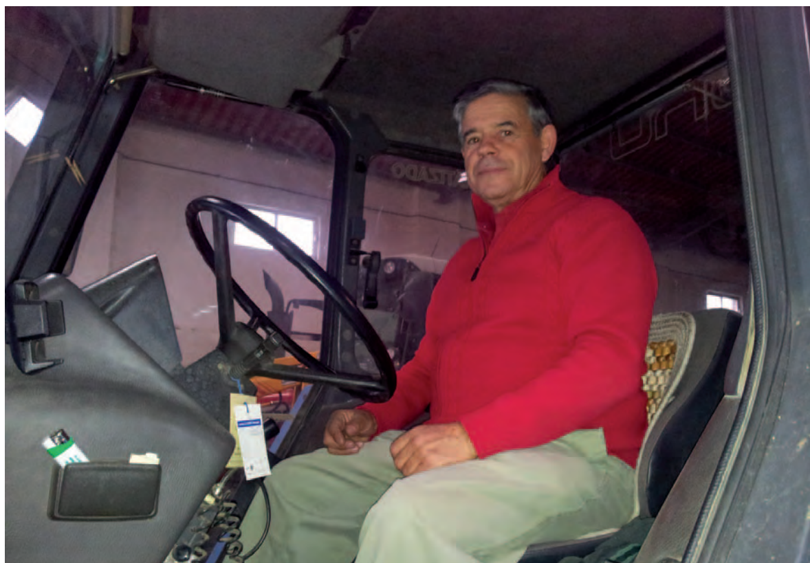
Agricultor jubilado de Crespos.

1. El acceso a la pensión deberá haber tenido lugar una vez cumplida la edad que en cada caso resulte de aplicación, sin que a estos efectos sean admisibles jubilaciones acogidas a bonificaciones o anticipaciones de la edad de jubilación.