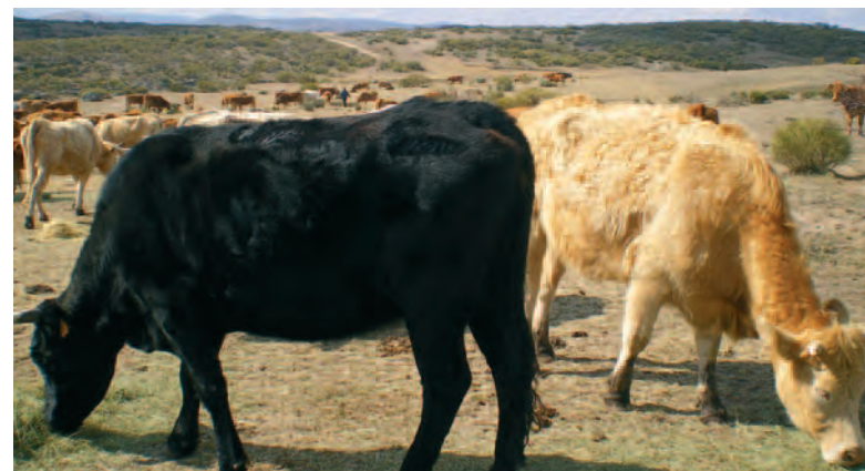
Reses en el término municipal de Navalacruz.

comenzar su trabajo rápidamente y para desarrollarlo de una forma impecable”.