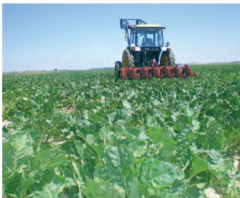
Aspecto de un campo de remolacha de la campaña anterior.

ASAJA reconoce que la compensación propuesta supondría el cobro de 2,75 euros por tonelada, que se sumarían al máximo de 39 euros que percibe el productor por tonelada de remolacha tipo, fijándose así el pre-