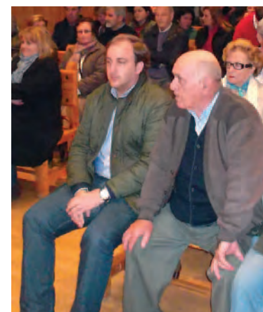
Pino, en el pleno de Candeleda.

la provincia, por la importancia que tienen para los ganaderos.