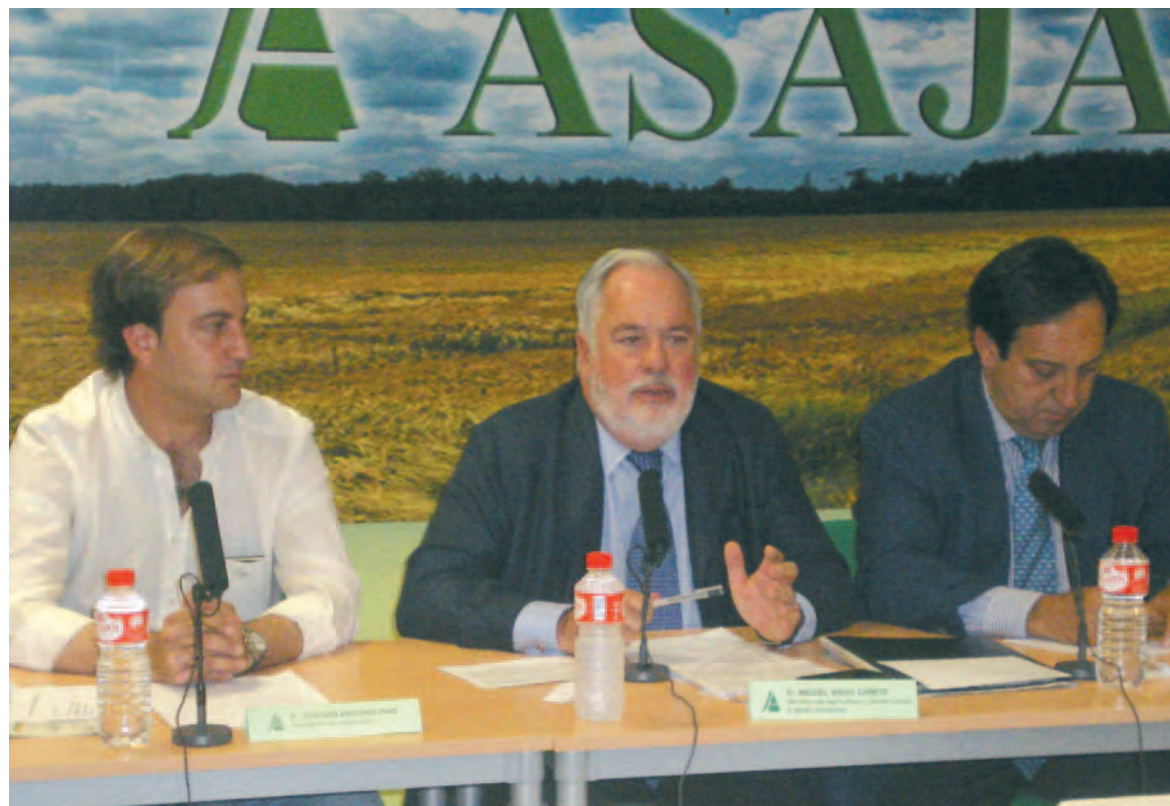
Pino, Arias Cañete y Barato, durante el encuentro con agricultores y ganaderos celebrado en ASAJA-Ávila en 2012.

Así se desprende de las declaraciones del ministro Arias Cañete