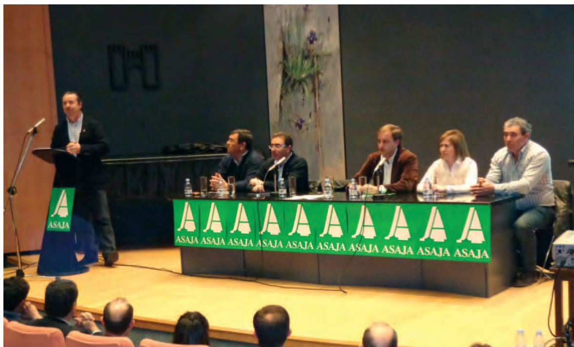
Dujo, durante su intervención en el Congreso Provincial.

Dujo alabó en su intervención el trabajo y la dedicación de la organización provincial