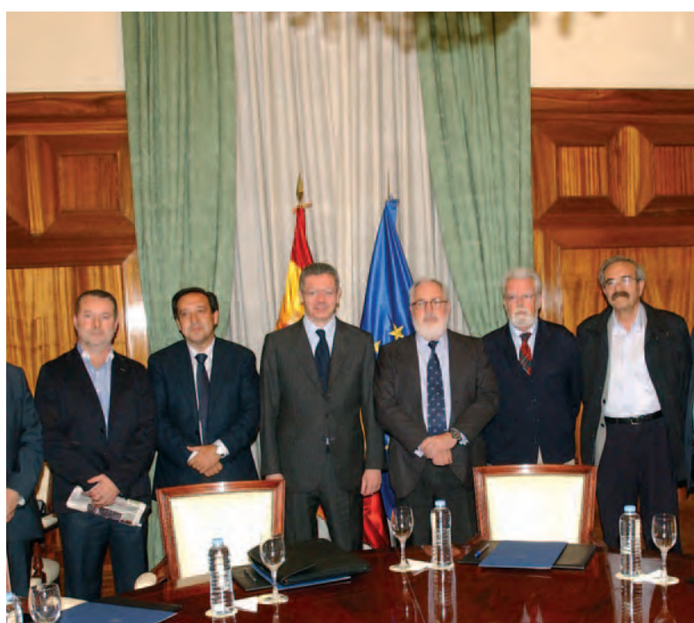
Los presidentes regional y nacional de ASAJA, con Gallardón y Arias Cañete.

El ministro Ruiz Gallardón se comprometió a responder en 15