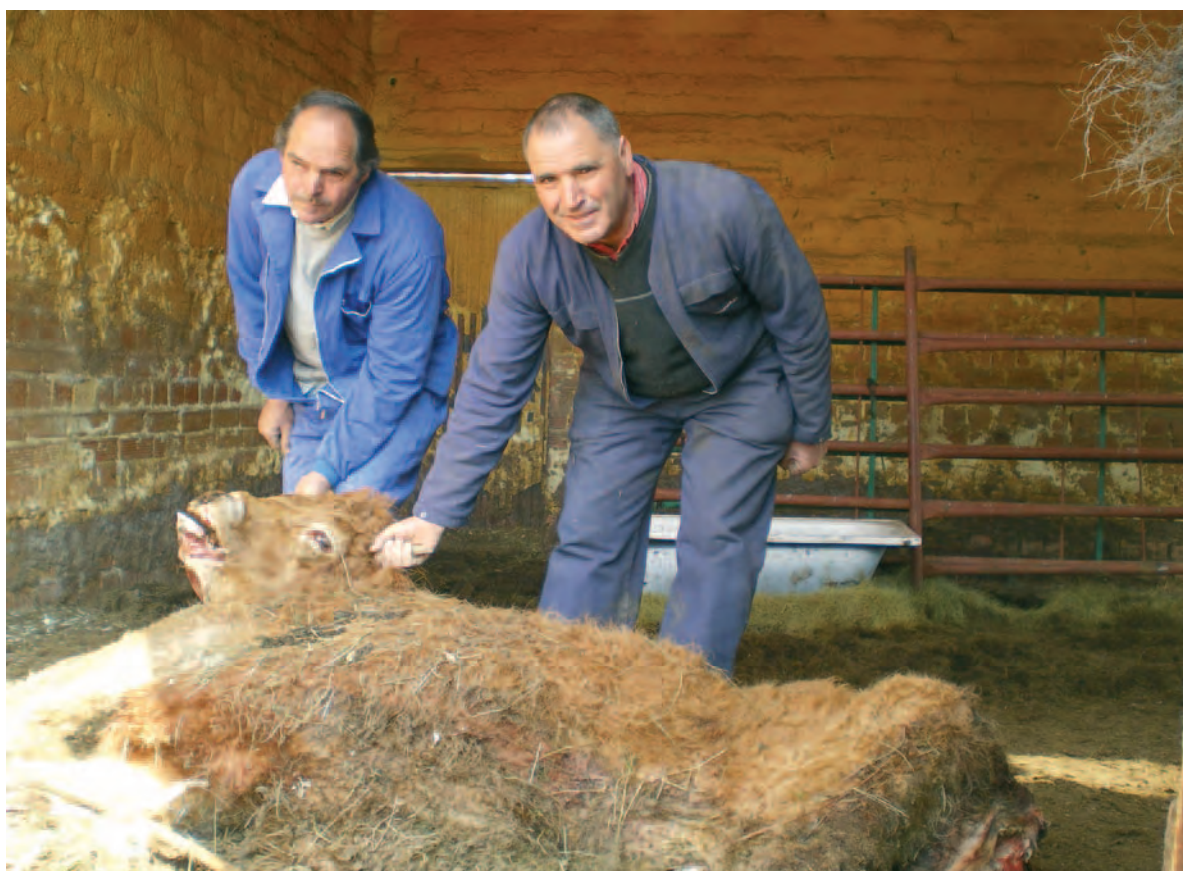
Dos ganaderos muestran una de sus reses, muerta por un ataque de lobos.

Una de las exigencias que ASAJA siempre ha puesto sobre la