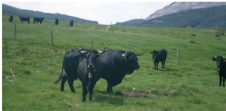
Reses de raza Avileña-Negra Ibérica.

Con la aprobación del modelo de libro de explotación por parte de la Junta de Castilla y León, ASAJA recuerda que desde principios de abril se ha comenzado a emitir un nuevo libro de registro tanto para las explotaciones de nueva creación como a las ya existentes. Los ganaderos deben acudir a la Unidad Veterinaria para obtener el libro de registro. En ASAJA también se facilitan los trámites necesarios.