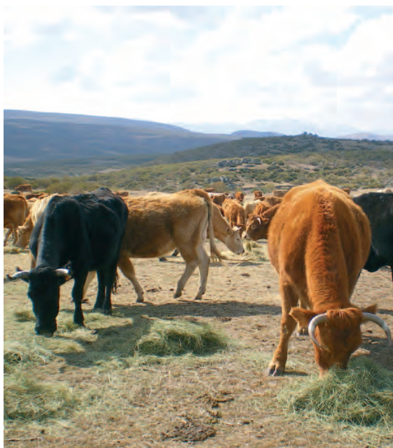
Vacas pastando en campos abulenses.

Asimismo, recordó los esfuerzos realizados desde la organización profesional agraria ante las administraciones competentes para poner fin a un problema que en ocasiones supone el sacrificio de ganaderías enteras o la imposibilidad de trashumar, una vez que la fauna salvaje ha transmitido al ganado enfermedades