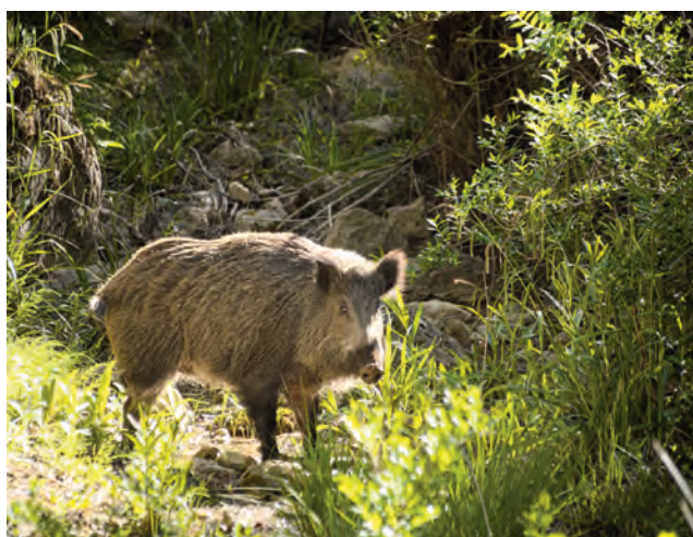
Los jabalíes ocasionan problemas a ganaderos y agricultores.

Topillos, conejos, avutardas y jabalíes causan periódicamente