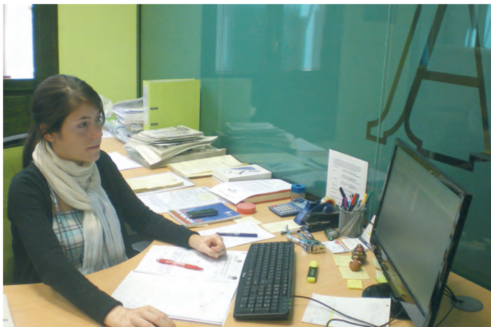
Imagen de la oficina de ASAJA de Ávila.

Esta convocatoria ha estado marcada por el retraso en la publicación del PDR que ha hecho modificar la normativa a última hora con cambios en cuanto al cálculo de ayudas, justificación de inversiones y tramitación de expedientes. Se han presentado en la región unos 1.000 expedientes de incorporación y 1.400 expedientes de mejora.