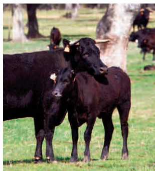
Raza Avileña-Negra Ibérica

Se subvencionará la creación o mantenimiento de libros genealógicos, lo que incluye los gastos derivados de dicha actividad, como local u oficinas, ordenadores y material informático, adquisición de material de oficina no inventariable y contratación y gastos de personal técnico y administrativo.