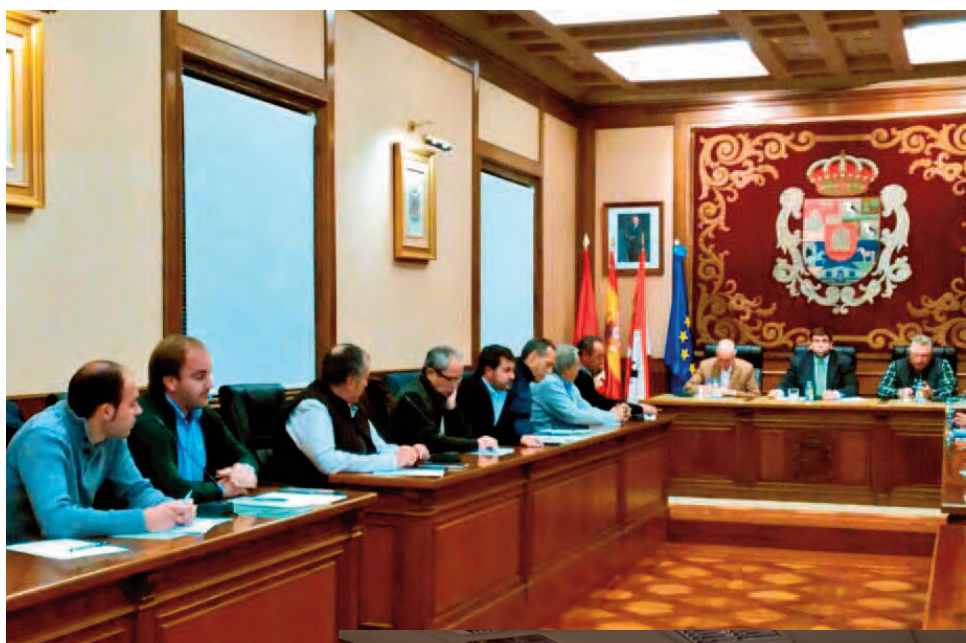
Encuentros de ASAJA con la Diputación Provincial y la Junta de Castilla y León.

Las provincias de Ávila y Salamanca son las más perjudicadas. En el caso de nuestra provincia, las ins-