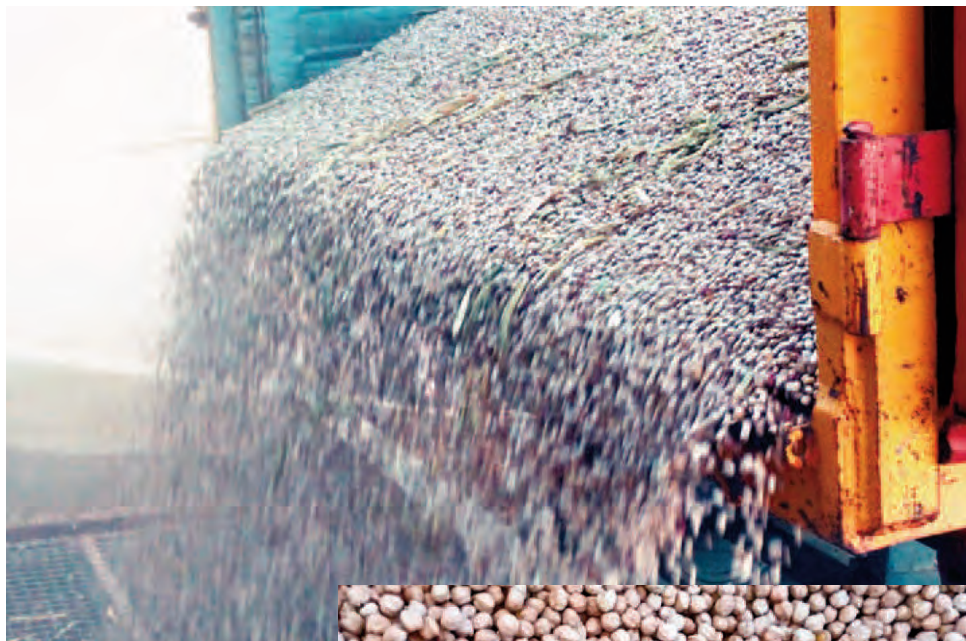
Arriba, descarga de judías en una cooperativa de La Moraña. Derecha, imagen de garbanzos.

Se espera cerrar la cosecha con una producción que rondará las 1.425 toneladas, una cantidad similar a la de 2014, pese a que el año anterior se cultivaron menos hectáreas de leguminosas en nuestra provincia. Se han producido unas 621 toneladas de guisante seco, cerca de 540 toneladas de judías secas y solo 107 toneladas de garbanzo. Se cal-