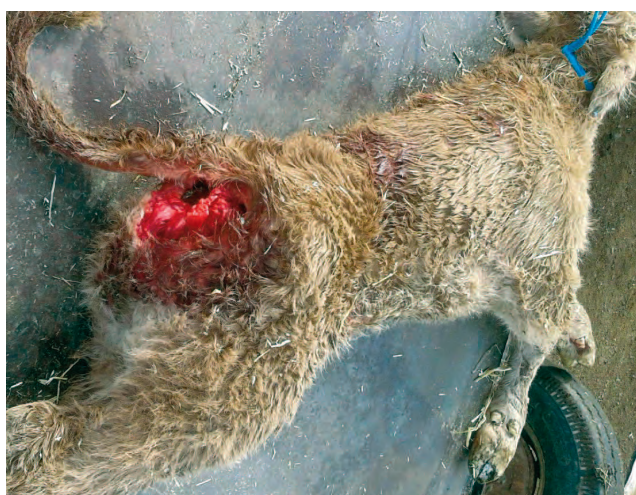
Ternero muerto tras la lobada en una explotación de Hoyocasero.

Mientras se multiplican los ataques y la pérdida de animales, la Junta de Castilla y León permanece impasible a las demandas de protección de los ganaderos, sigue pagando con mucho retraso las indemnizaciones a los afectados y hace dejación de sus funciones en cuanto a control poblacional de los