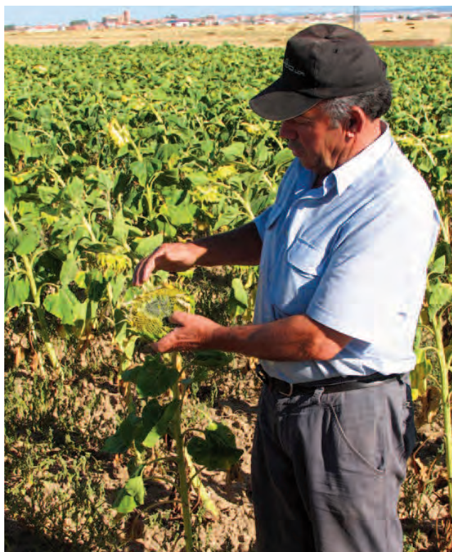
Agricultor en su plantación de girasoles.

El año pasado, se sembraron 4.254 hectáreas de girasol en la provincia con un resultado peor que en esta campaña, ya que se cosecharon 3.079 toneladas. Este año, según los datos de la Junta, se ha aumentado la superficie de girasol en regadío, lo que ha contribuido a conseguir mejores resultados pese a las condiciones meteorológicas adversas de la primavera y el verano.