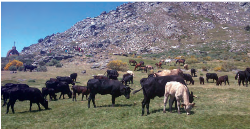
Ganado trashumante en el Puerto de El Pico.

Destaca su apotación al campo, la cultura y las tradiciones