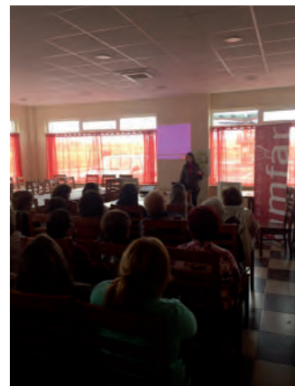
Varios momentos de la celebración de las jornadas de AMFAR en San Juan del Olmo y en Solosancho.