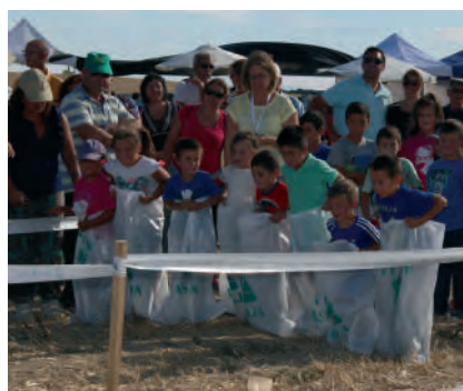
Actividades infantiles del concurso.