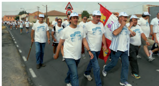
La Marcha Blanca, una reivindicación histórica para el sector.

ASAJA mantiene el apoyo al acuerdo del sector, que busca dentro del marco legal frenar la caída de precios y proteger a los productores con el respaldo de las administraciones, pero rechaza el decreto de ayudas porque no se ajusta a la realidad de las explotaciones y discrimina a Castilla y León.