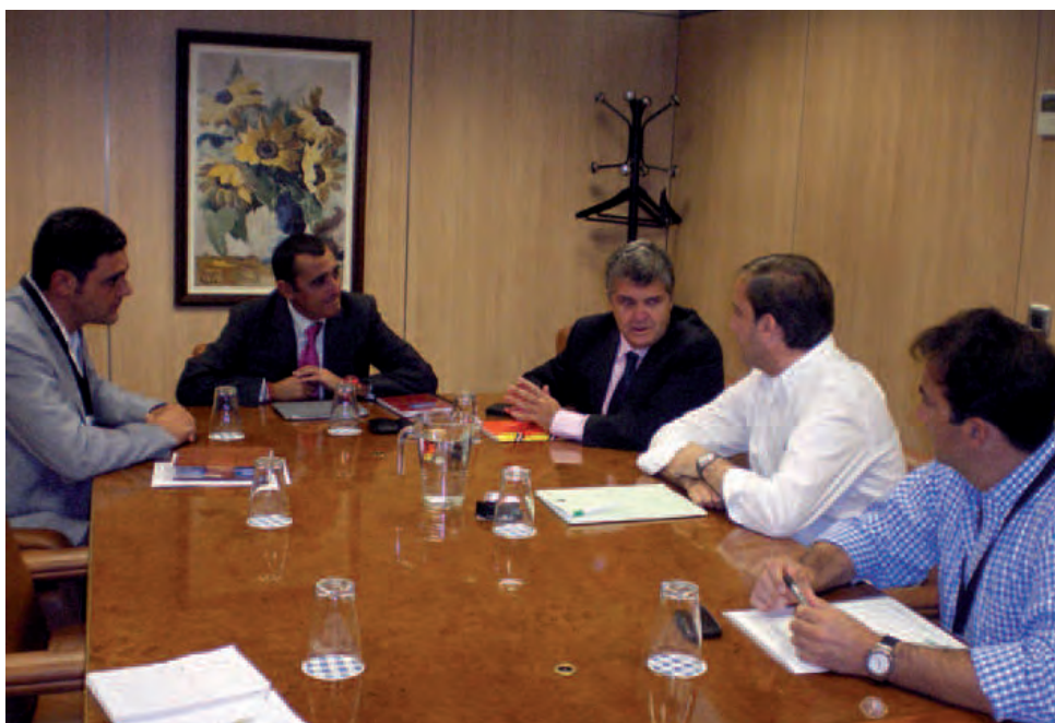
Un momento de la reunión mantenida en el Ministerio de Agricultura en septiembre de 2012.

Se sigue trabajando en nuevas medidas para mejorar en los saneamientos ganaderos