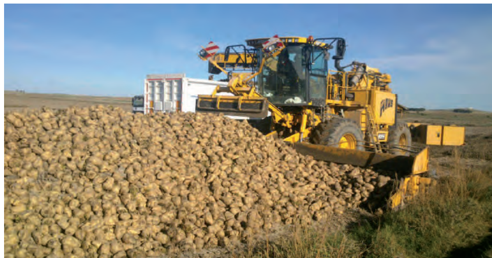
Imagen de la recogida de la remolacha en una parcela de la zona norte.

Una cosecha de buena calidad gracias a las condiciones de la planta, libre de plagas y con apenas inci-