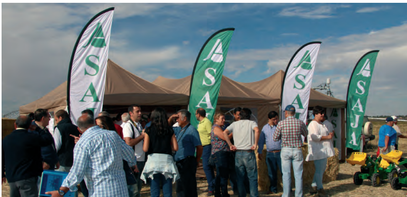
La carpa de ASAJA de Ávila fue la más concurrida y animada durante toda la jornada del XL Campeonato Nacional de Arada.