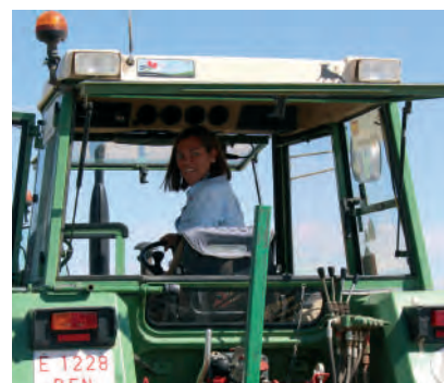
La consejera de Agricultura, al volante.