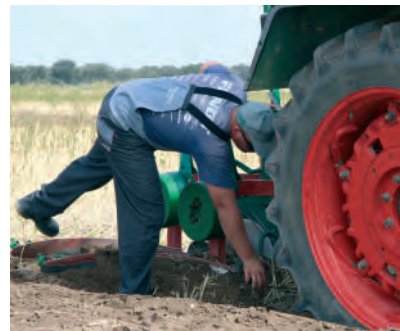
Ajuste del tractor durante la prueba.