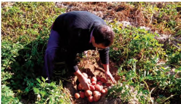
Un agricultor arrancando patata roja en campos abulenses

Con estos datos, se espera arrancar 56.650 toneladas de patata tardía, 10.250 toneladas de tubérculo de media temporada y sólo 240 toneladas de variedad temprana.