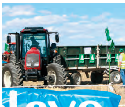
Concurso de remolque marcha atrás.