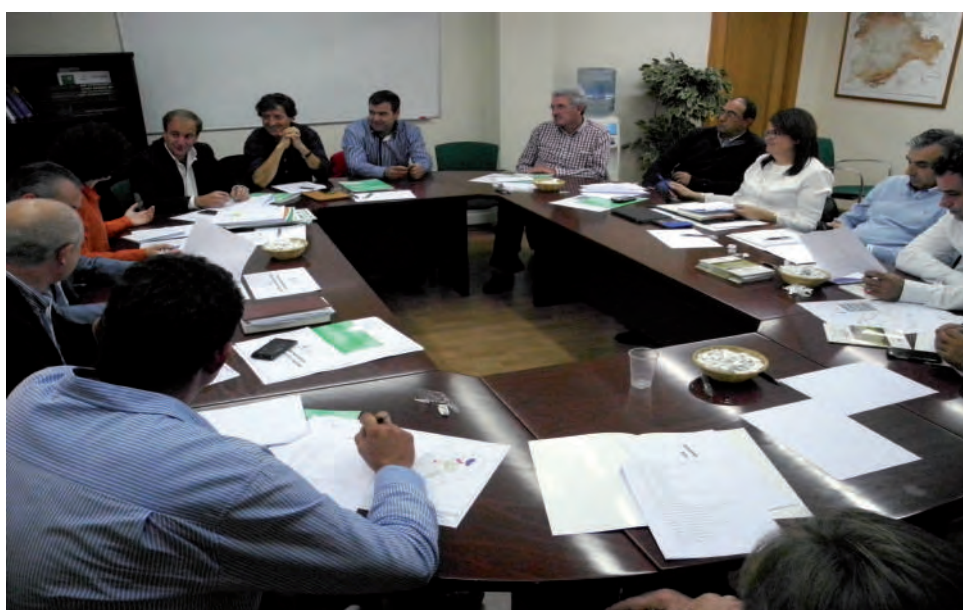
Junta Directiva de ASAJA de Castilla y León celebrada este mes de octubre en Valladolid.

Desde 2009, el año en el que más recursos se destinaron al sector, el departamento fue recortando sus aportaciones, y esta tendencia no se ha corregido pese a la mejora de los indicadores económicos del país.