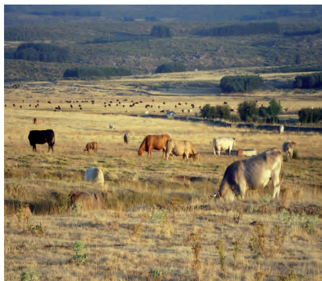
Ganado de extensivo pastando en una zona de pasto.

En el caso de los cereales de invierno , no se puede cultivar la misma especie dos años consecuti-