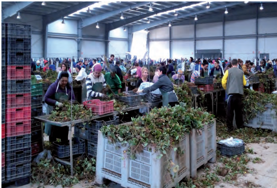
Temporeros de la fresa en plena clasificación de las plantas, en una nave de la provincia.

Del 0,75% para este ejercicio y del 1% para el próximo año