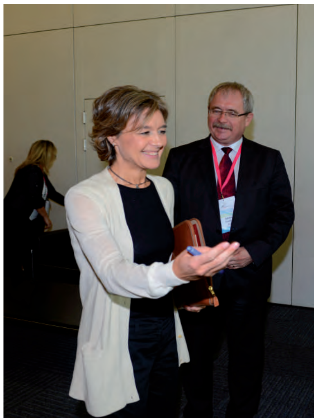
La ministra de Agricultura, Isabel García Tejerina.

También se ha pronunciado al respecto la consejera de Agricultura y Ganadería de la Junta de Castilla y León, quien ha señalado que uno de cada cuatro tractores nuevos vendi-