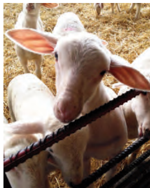
Cordero en una explotación.

Además, se subvencionará con hasta 100€ la adquisición de cabra lechera; en el caso del ganado ovino, se aportarán hasta 70€ por animal de aptitud lechera y hasta 25€ por la adquisición de cabras u ovejas de de aptitud cárnica. En el caso de que los animales adquiridos se hallen inscri-