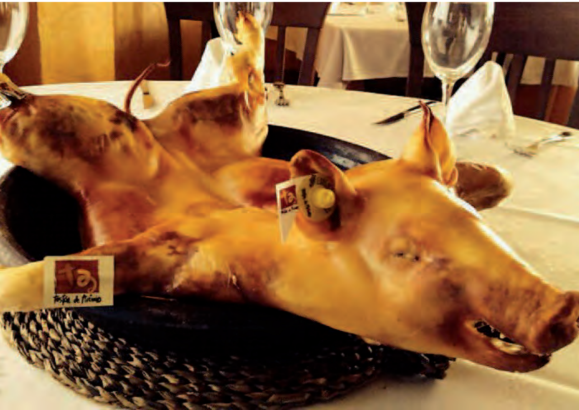
Presentación del ‘Tostón de Arévalo’ en uno de los restaurantes arevalenses adheridos a la marca.

ASAJA de Ávila realiza una valoración positiva de su primer año de comercialización