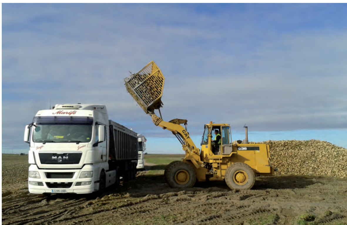
Retirada de remolacha en la Moraña en esta campaña.

El suplemento de precio requerido para llegar a los 40 euros se aplicará a toda la remolacha de cuota producida en la campaña 14/15 por los agricultores acogidos a todos los complementos acordados con anterioridad, así como a la producción de remolacha que pudiera destinarse a la