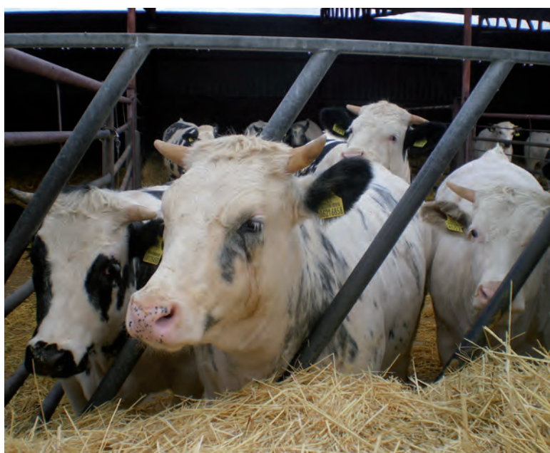
El vacuno de carne obtuvo este año mejor resultado que en 2012.

agricultores y ganaderos y sus familias: medio ambiente, empleo, servicios sanitarios y educativos o infraestructuras”.