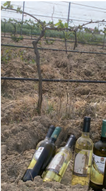
Vinos de Madrigal.

ASAJA-Ávila ASAJA informa a los viticultores de Castilla y León que en los próximos días la Consejería de Agricultura y Ganadería publicará la orden que regula ayudas a los Planes de Reestructuración y Reconversión de viñedo para la campaña vitícola 2013/2014. Esta convocatoria introducirá algunos cambios que complicarán la tramitación de unas ayudas cuyo plazo de solicitud coincidirá con el periodo navideño, ya que está previsto que concluya el 15 de enero, por lo que ASAJA sugiere a los agricultores interesados que estén pendientes de la tramitación. Como en años anteriores, las actividades subvencionables por esta línea –financiada con cargo al Fondo Europeo Agrícola de Garan-