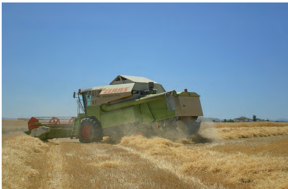
Este año, la cosecha arrojó en general rendimientos menores que en 2012.

Dujo también ha recordado que muy próximamente la Comunidad Autónoma contará con su propia Ley Agraria, una normativa importante “que debería nacer abierta a recoger otros aspectos que, si bien no gestiona el departamento de Agricultura, sí repercuten en los