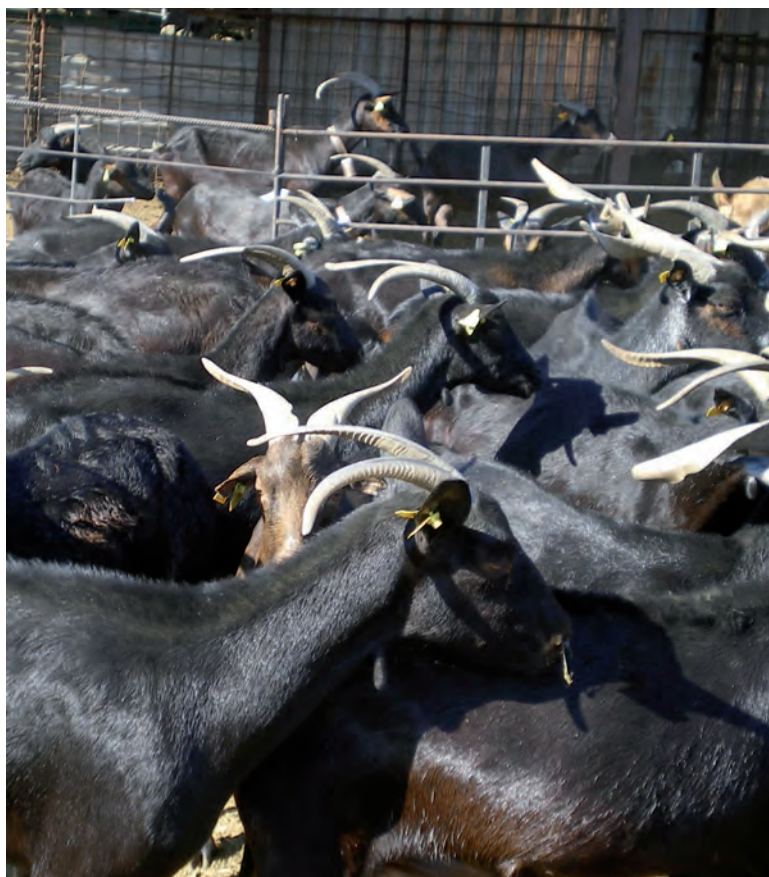
Ganado caprino en Candeleda.

Por su parte, el importe unitario para la ayuda para compensar las desventajas específicas en el caso de vacas de leche dentro de la Política Agrícola Común de 2013 se