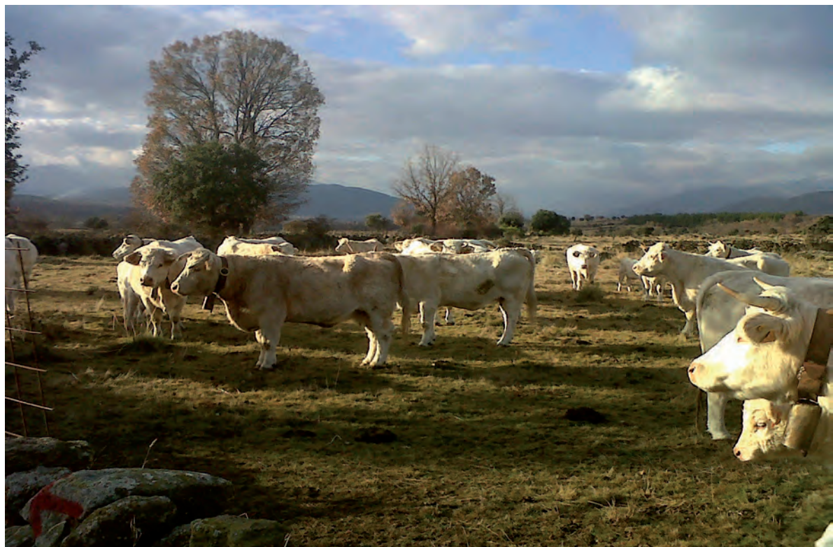
Ganado charolés de pura raza de la comarca El Barco-Piedrahíta.

De esta manera, el Programa Nacional Español de Erradicación de Tuberculosis para el año 2014 elimina la obligación de realizar sistemáticamente dos pruebas a los ganaderos de la Comunidad de las unidades veterinarias de alta prevalencia, por lo que a partir de 2014 sólo tendrán que realizar la segunda prueba los ganaderos que tengan animales positivos en su explotación, según recoge una resolución