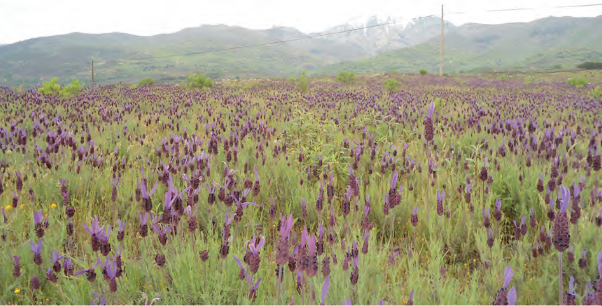
Vista paisajística desde El Raso, en Candeleda.

La normativa unifica los procedimientos ambientales y acorta los plazos