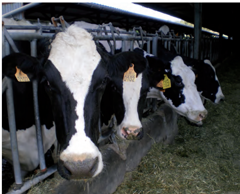
Las producciones están sometidas en la UE a un intenso control.

Para ASAJA, este es el fallo principal del conocido como “paquete de Bali”, alcanzado en la IX Conferencia de la OMC, que por otro lado tiene puntos positivos, puesto que persigue impulsar las exportaciones y el comercio mundial. Por primera vez en este foro del comercio internacional no se han puesto en cuestión las ayudas agrarias de la Unión Europea, unas ayudas que ya no se consideran incompatibles con el libre mercado mundial al haberse reducido considerablemente y al estar desacopladas de la produc-