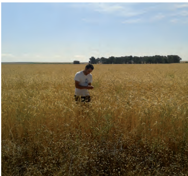
Un joven agricultor observa el estado del cereal.

No se quemarán rastrojos en todo el ámbito nacional, salvo que, por razones fitosanitarias, la quema esté autorizada por la autoridad compe-