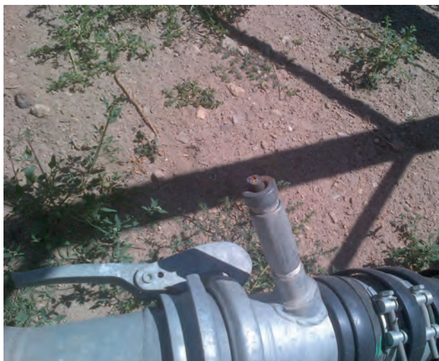
Robo de cable de cobre en la Moraña.

Con el nuevo Código Penal que ha entrado el 1 de julio en vigor ya no habrá falta de hurto y esta se transforma en delito leve de hurto siempre que la cuantía de lo sustraído no excede de 400 euros, pero con una particularidad muy relevante, respecto a la tipificación: se considera un delito agravado de hurto, sancionado con una pena de prisión de uno a tres años la sustracción de produc-