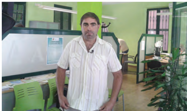
Jesús se acaba de incorporar al campo.

Asimismo, está abierto el plazo para solicitar ayudas de modernización de explotaciones, destinadas a