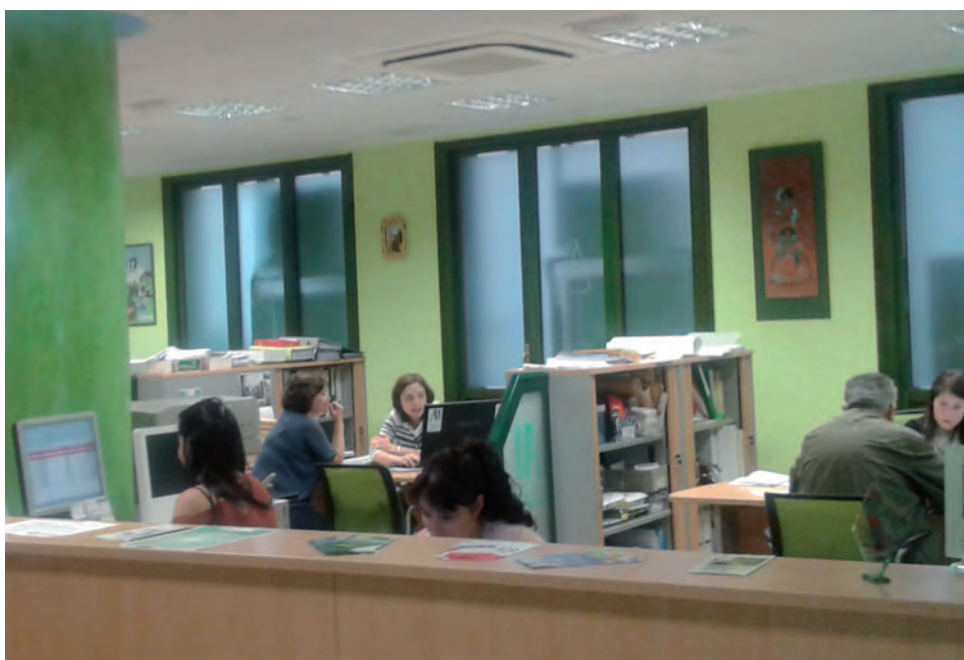
Oficinas de ASAJA en Ávila, durante la campaña PAC 2015.

La organización profesional agraria agradece a socios y simpatizantes su confianza