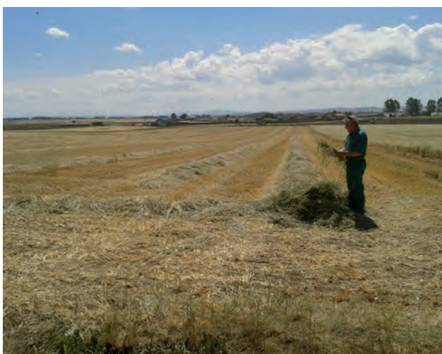
Un agricultor observa el resultado de la siega en verde.

En secano, los agricultores están reduciendo sus expectativas de entre 1.500 a 2.000 kilos/hectárea a apenas 1.000 kilos. Por eso algunos