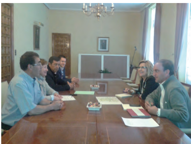
Miembros del Comité ejecutivo con la subdelegada del Gobierno.