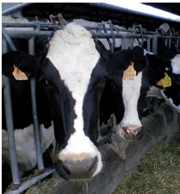
Explotación de vacuno de leche.

De esto es de lo que quiere ASAJA que se hable al día siguiente de la toma de posesión, entendiendo que las demás cuestiones de índole agrario son menos urgentes y pueden esperar. El sector del vacuno de leche está vendiendo sin precio como siempre, por lo tanto los contratos a medio plazo no se han implantado, y cuando llega la liquidación fijada de forma unilateral por la industrial, es con caídas de precios que hacen ya insostenible este negocio. Si en mayo la mayoría de la producción se vendió por debajo de los 29 céntimos de euro el litro, para la liquidación de junio se anuncian nuevos recortes. Pero es más, a esta crisis de precios se suma las limitaciones en las entregas que están imponiendo las industrias a muchos ganaderos,