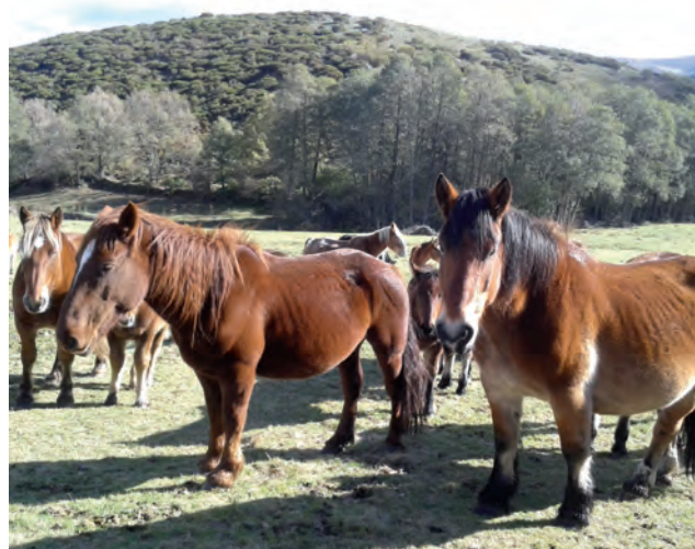
Explotación de caballos de carne.

Asimismo, ASEGASA, la Correduría de Seguros de ASAJA, ofrece un nuevo seguro para caballos de monta que incluye la responsabilidad civil y la retirada de cadáveres. Un seguro novedoso porque además de la cobertura de los daños a terceros que pueda ocasionar en animal y la defensa jurí-