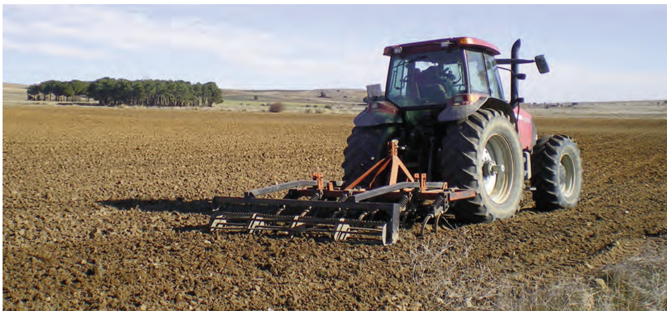
Un agricultor trabajando la tierra.

TRIBUTACIÓN | EN LA TRANSMISIÓN DE DERECHOS DE PAGO ÚNICO