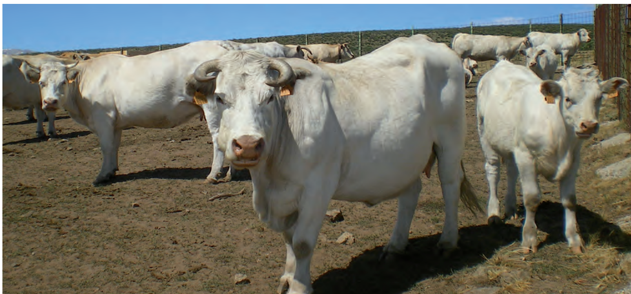
Ganado vacuno en la provincia.

EN LA MODALIDAD A TIEMPO COMPLETO, CON UNA UNIDAD DE TRABAJO AGRARIO (UTA)