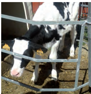
Vacuno de leche.

ASAJA de Ávila reclamó a los ministerios de Agricultura y Hacienda, a través de la organización regional y nacional, la inclusión de estos sectores, afectados por la sequía, en la reducción de los índices de rendi-