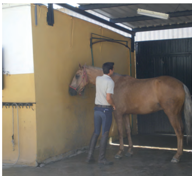
Caballo de monta.

Así, por un precio económico, el propietario de este tipo de animales de recreo tendrá cubierto la retirada del cadáver del animal. Solicita más información sin compromiso en cualquiera de las oficinas de ASAJA de Ávila, repartidas por toda la provincia o en el número de teléfono 920 100 857.