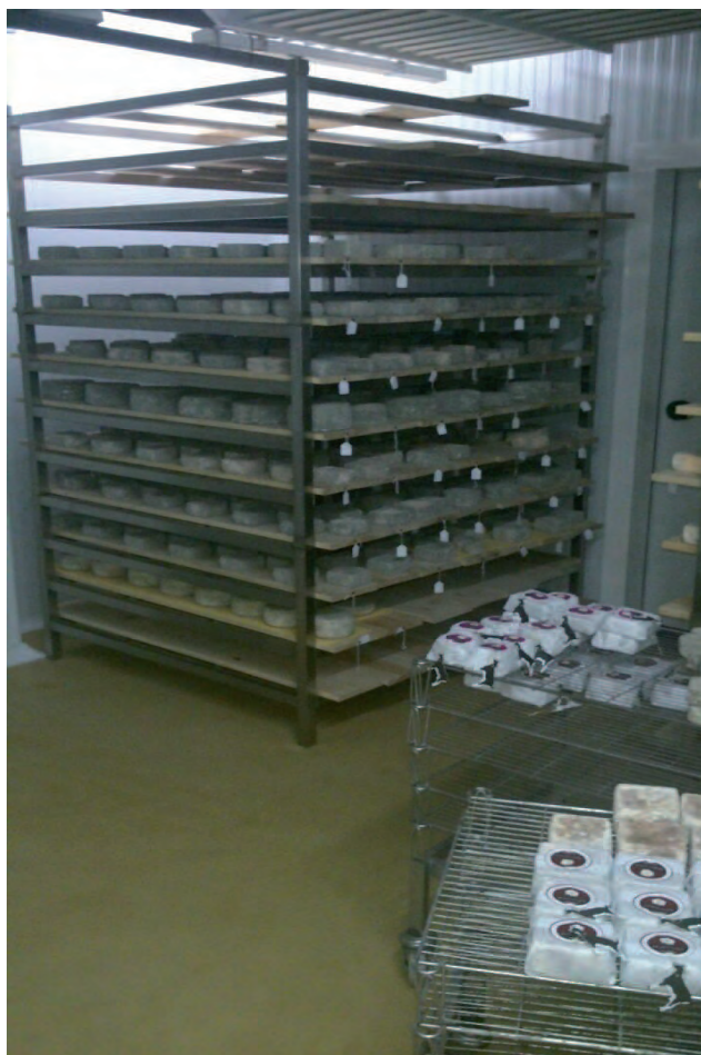
Una de las cámaras de la quesería Montealijar, en Las Navas.

Esta convocatoria, la primera dentro del nuevo periodo de programación 2014-2020, para la modalidad a tiempo completo ofrece una prima básica de 20.000 euros que se irá incrementando si el solicitante cumple requisitos como incorporarse en sectores considerados estratégicos (ovino-caprino, vacuno de leche y de carne, porcino ibérico, patata y hortalizas, remolacha, herbáceos de alto valor, viñedo y agricultura ecológica), si se instala bajo la modalidad de titularidad