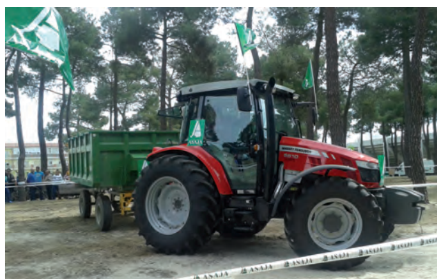
Participante del III Concurso de habilidad con tractor y remolque.

Las actividades organizadas por ASAJA en la Feria de Arévalo incluyó el taller práctico ‘Las claves de la arada’, a cargo del campeón de arada de España David Rodríguez.