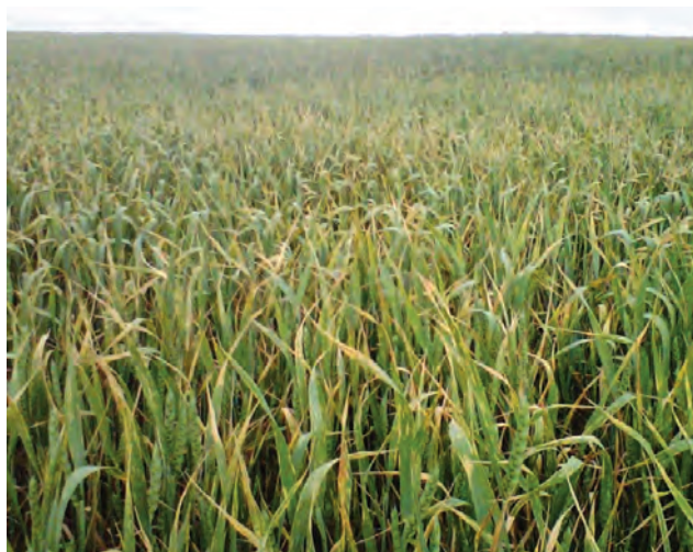
Parcela afectada por roya amarilla (archivo).

Ahora la alerta se refiere a insecto como la nefasia o polilla del cereal; tronchaespigas (tanto Calamobius filum como céfidus) y lema. En cuanto a los hongos, se