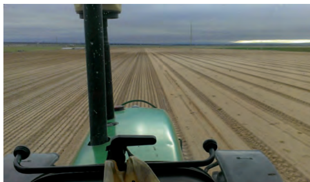
Vista de la parcela desde el tractor.