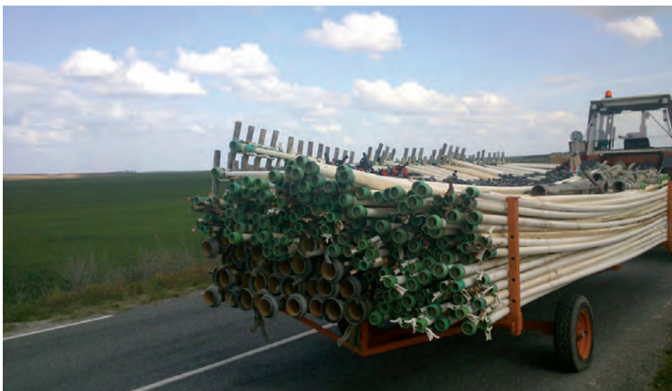
Material para el riego.

En cuanto a las actividades subvencionables, incluyen la clasificación, acondicionamiento, fabricación, transformación y comercialización de los productos agrarios de la propia explotación, con vistas a la apertura de mercados para la exportación. Asimismo, la convocatoria financia actuaciones dirigidas a la adaptación de las explotaciones con vistas a reducir los costes de producción, ahorrar energía o agua, o la incorporación de nuevas tecnologías, incluidas las de informatización y telemática. Los agricultores y ganaderos podrán modernizar su explotación con maquinaria, pivots, nuevas instalaciones de ordeño o la construcción de naves.