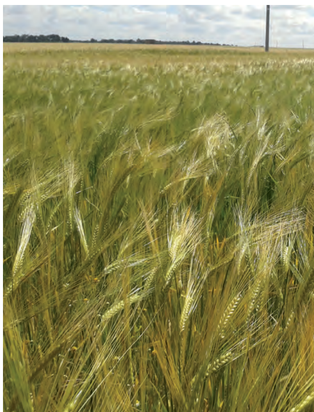
Cereal en los campos de la provincia.

Los agricultores que hayan contratado el seguro creciente de cultivos herbáceos en diciembre en seco y prevean que la producción va a ser mayor de lo asegurado inicialmente podrán suscribir el