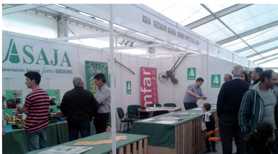
Expositor de ASAJA en la Feria de Arévalo.

importancia de la industria agroalimentaria y abogó por contar con una distribución “propia”.