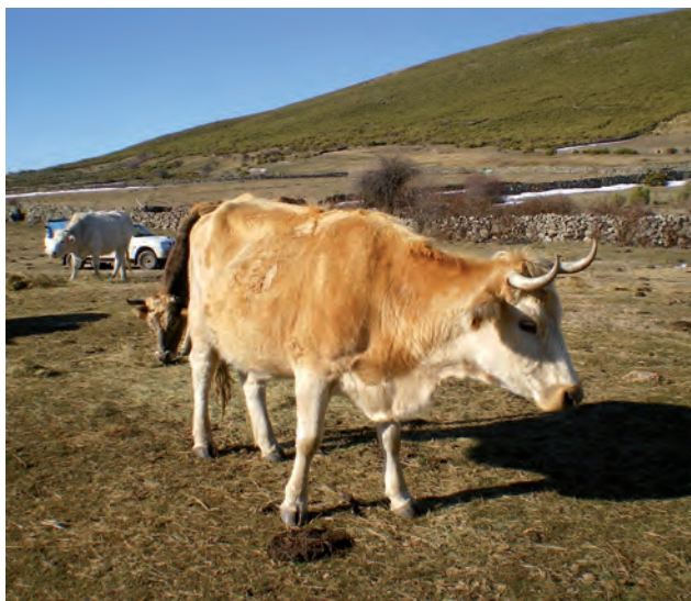
ASAJA propone un plan específico para la ganadería de montaña.

- Compromiso para encontrar soluciones a los ataques de lobos, mediante la introducción de diversas actuaciones, como medidas de protección y control poblacional de la especie. Control de la fauna salvaje (ciervos, corzos...) y que