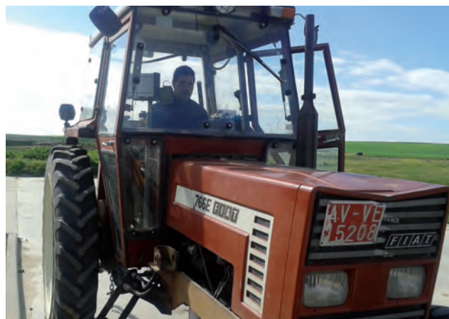
Tractor con problemas para pasar la ITV.

El 31 de diciembre de 2014 finalizó la moratoria decretada por la Junta de Castilla y León, por lo que desde el mes de enero son muchos los tractores de los años ochenta que están teniendo dificultades para superar la ITV. ASAJA ofrece de forma gratuita a sus socios información y asesoramiento, así como el informe necesario para superar la Inspección.