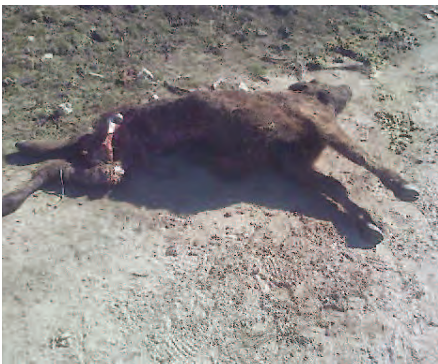
Res muerta como consecuencia de un ataque de lobos.

ASAJA recuerda que los técnicos de las oficinas de la organización profesional agraria tramitan gratuitamente este tipo de daños a