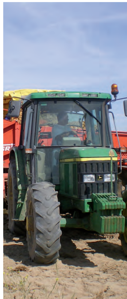
Recolección de patata.

En concreto a Castilla y León se dirigen, como estaba previsto, 13.890.023 euros, el 25 por ciento de la financiación precisa que, junto al otro 25 por ciento que aporta la Comunidad Autónoma y el 50 por ciento restante procedente de Bru-