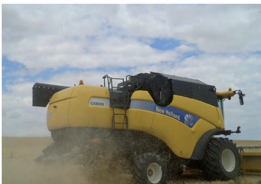
Cosecha de cereal en Blasconuño de Matacabras.

ASAJA había solicitado en la Mesa de la sequía medidas efectivas para paliar esta situación y que se