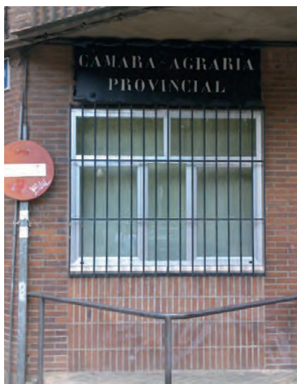
Sede de la Cámara agraria.

ASAJA teme que, como ya ha sucedido en los dos últimos plenos, se plantee vender el patrimonio de los agricultores para hacer frente a