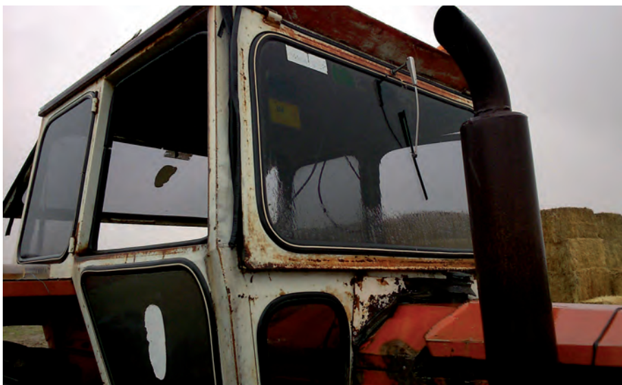
Cabina de un tractor que podría beneficiarse del Plan PIMA.

Hasta el momento, aunque el Real Decreto que regula estas ayudas contempla únicamente identificar el tractor que se va a achatarrar, la aplicación informática requería la baja del tractor y el certificado de achatarramiento antes de conocer si