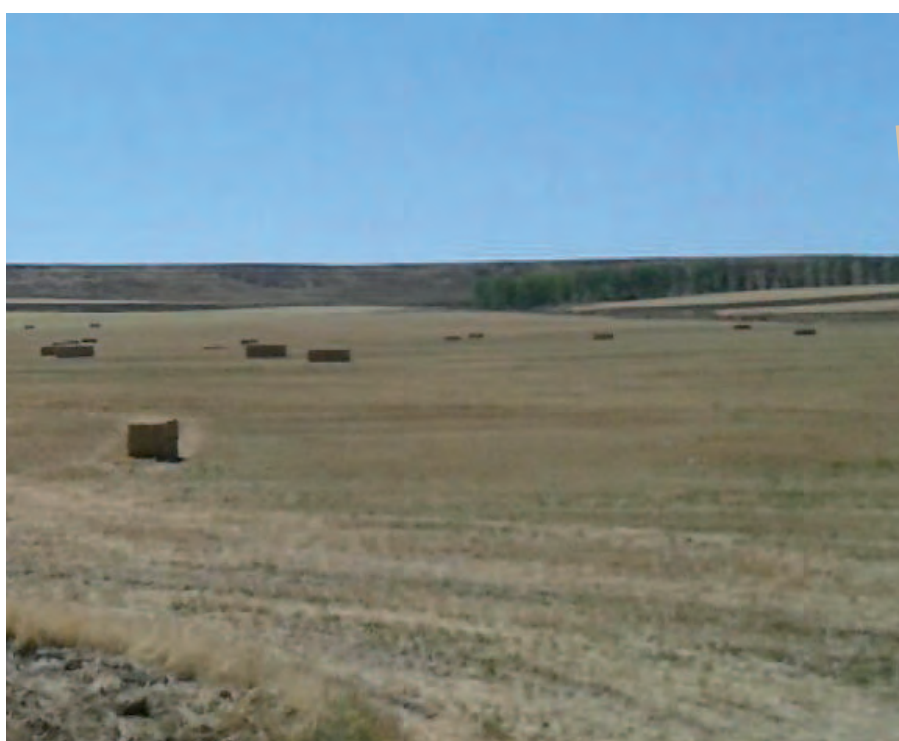
Parcela en Riocabado donde se celebrará el Campeonato de arada.

Una parcela de más de 40 hectáreas albergará la competición, en la que también se desarrollará el completo programa de actividades diseñado, que incluye la Gran exposición de maquinaria y medios de producción, con la participación de las empresas de tractores y maquinaria