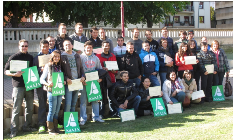
Curso I.E.A celebrado en León

Dado el interés que sigue despertando la incorporación de jóvenes al campo, y prueba de ello es la concurrencia a estos cursos de formación, ASAJA ha pedido a la Junta de Castilla y León que habilite la partida presupuestaria suficiente para atender estas peticiones de ayudas, que agilice los trámites administrativos y pague cuanto antes los apoyos comprometidos una vez certificados los expedientes, y que publique antes de finalizar el año la convocatoria de estos fondos. También, la organización agraria hace un llamamiento a las entidades financieras que operan en la provincia para que crean en estos jóvenes que deciden hacer de la agricultura y ganadería su profesión y que le financien sus proyectos viables, ya que sin financiación privada es muy difícil montar una explotación agroganadera incluso contando con apoyos oficiales.