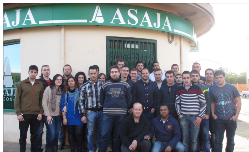
Curso I.E.A celebrado en Santa María del Páramo