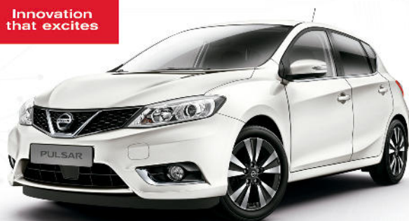
NUEVO NISSAN PULSAR DIG-T 115 CV DESDE

¿PREFIERES TECNOLOGÍA Y DISEÑO? ¿O DISEÑO Y TECNOLOGÍA?