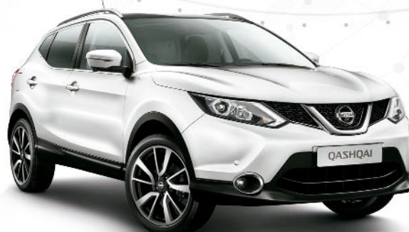
NUEVO NISSAN QASHQAI DIG-T 115 CV DESDE