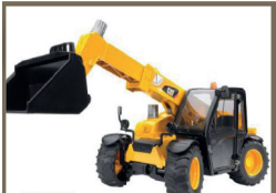
253354 CARTEPILLAR TELESCÓP.