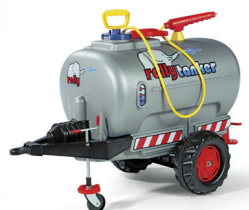
251760 CISTERNA GRIS + BOMBA