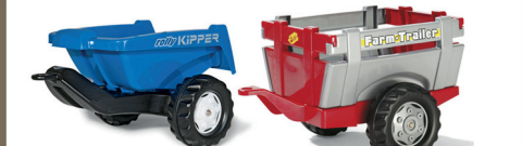
259391 REMOLQUE ROLLY KIPPER II