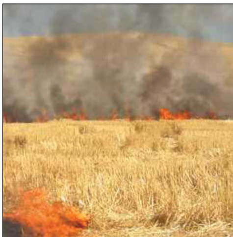
Quema de rastrojo.

La superficie que finalmente ha solicitado la medida apenas alcanza las 30.000 hectáreas, una cifra muy pequeña y alejada de cualquiera de las previsiones iniciales. En principio, un 25% de la superficie de cereal podía incluirse en esta campaña, es decir, unas 500.000 hectáreas, pero la tardanza en la aprobación de la medida