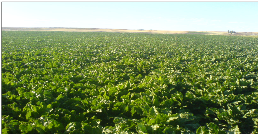
Plantación de remolacha azucarera.

Asimismo, unos 3.602.692,51 euros se han destinado al aprovechamiento forrajero extensivo mediante pastoreo con ganado ovino y caprino, han ido