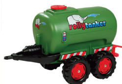
251756 CISTERNA AGUA DOBLE EJE

Válido del 1 de Diciembre 2016 al 31 de Enero 2017