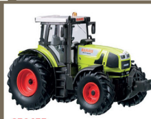
250455 CLAAS ATLES 936 RZ