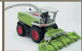
250353 CLAAS JAGUAR 900