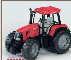
250338 CASE CVX 170