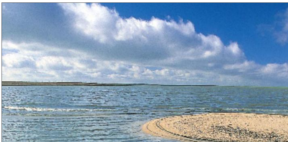
Una imagen del Azud de Riolobos.